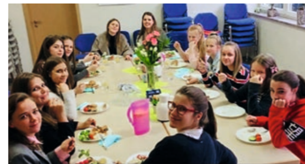
Auch leckeres Essen gehört zu einem gelungenen Tag.

Wenn sich junge Frauen in einer Adventgemeinde zum Beispiel zu einem »Beauty-Tag«, einer Pyjamaparty oder einem Filmabend treffen, handelt es sich wahrscheinlich um eine Veranstaltung von »girls4christ« (»G4C«). Hier wird aber auch über spezifische Lebenslagen, Probleme und Herausforderungen geredet. »G4C« gehört auch in Mittelrhein zur Abteilung Frauen.