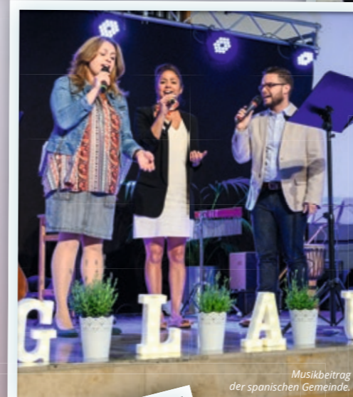
Musikbeitrag der spanischen Gemeinde.