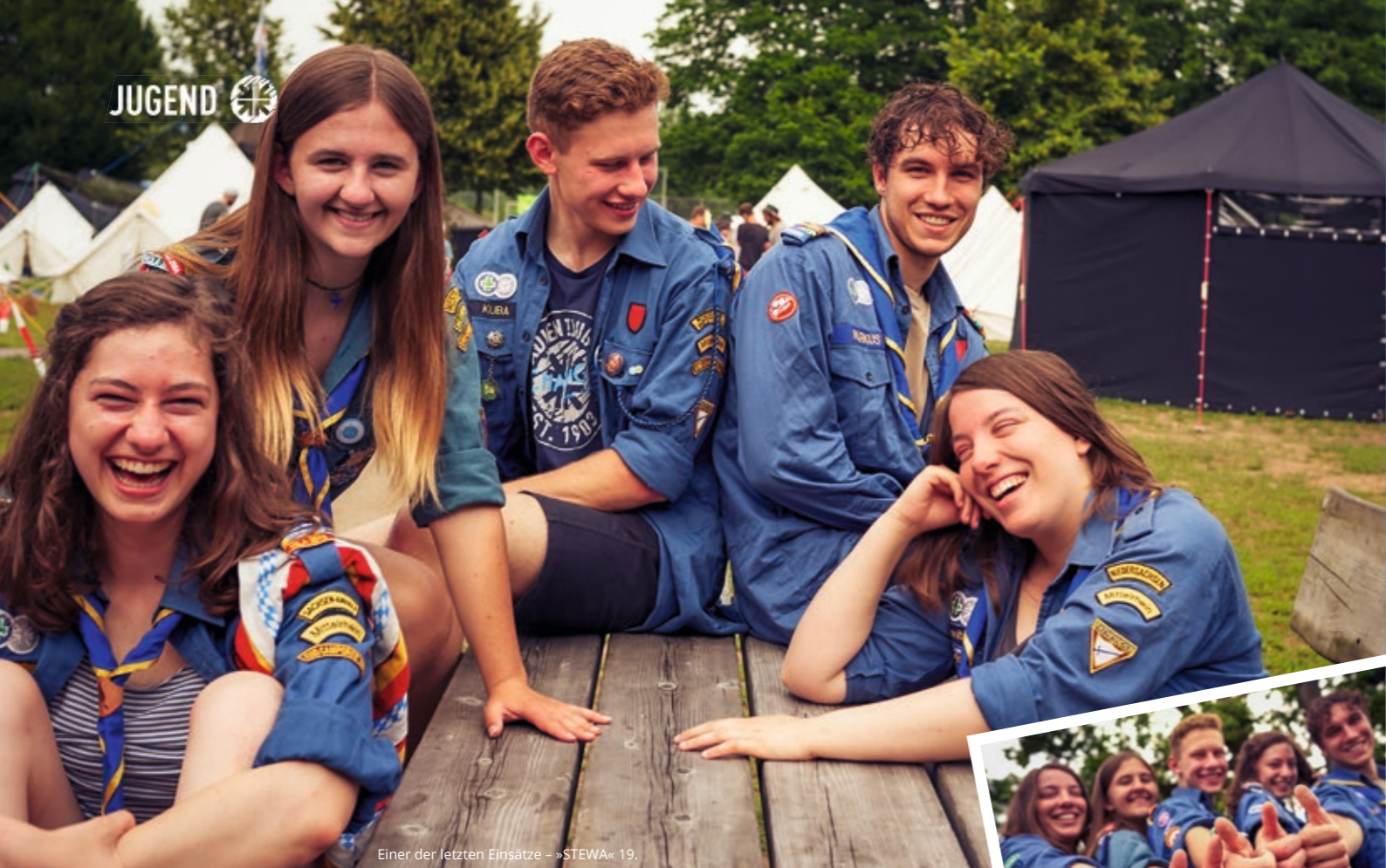
Einer der letzten Einsätze - »STEWA« 19.