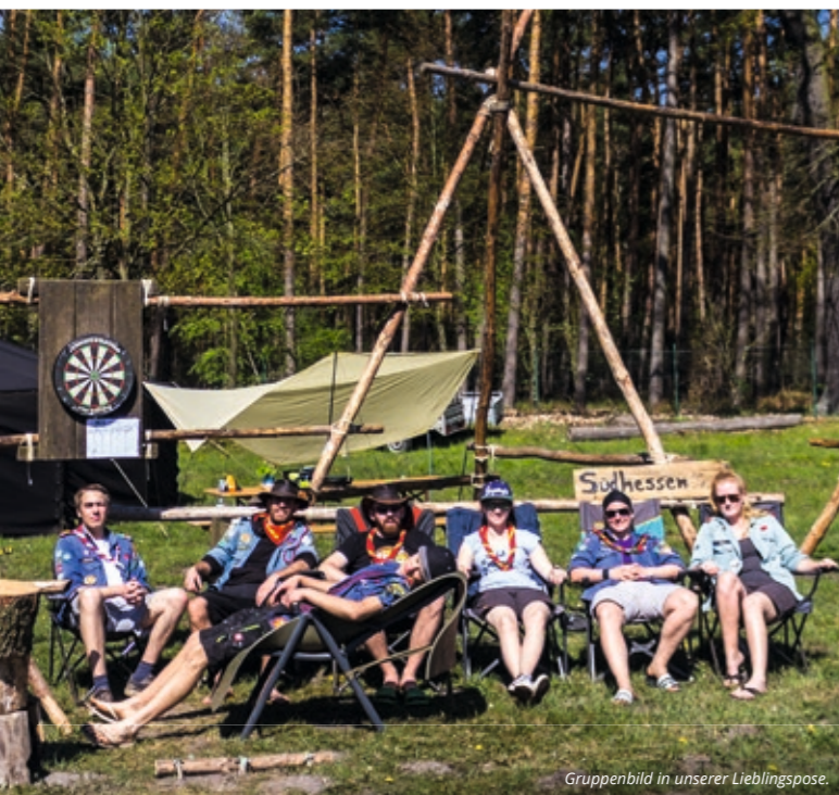
Gruppenbild in unserer Lieblingspose.