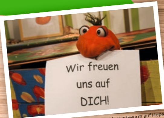
Fribonius Maximilian Balthasar von Einzahn, der Holzwurm auf HopeTV.

Ab 13:00 Uhr: Fribos Umweltaktion, Programm mit Fribo und Dominik und Basteln und Kochen mit Wilma und Carla