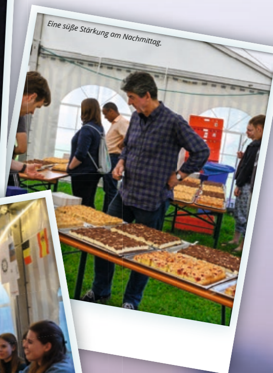
Eine süße Stärkung am Nachmittag.