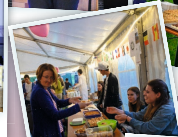
Nicht nur Gespräche, sondern auch leckeres Essen gehörten zum Tagesausklang auf der Aulawiese.