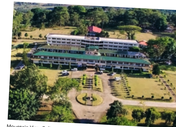
Mountain View College.

1.300 Euro inklusive Flug. Lass dich vom Preis nicht abschrecken. Wenn Gott dich braucht, gibt es immer Möglichkeiten. Sei kreativ, frage Verwandte, Freunde und deine Gemeinde. Es gibt viele Leute, die nicht verreisen können, aber gerne andere finanziell unterstützen. Oder suche dir einen Ferienjob.