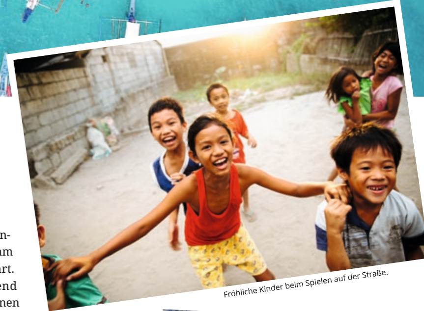
Fröhliche Kinder beim Spielen auf der Straße.

Die Philippinen sind ein Land der Gegensätze: Regenwald und wunderschöne Strände, einsame Inseln und überfüllte Städte, arm und reich. Die Bevölkerung ist zu 81 Prozent katholisch, doch oft wird dieser Glaube vermischt mit indigenen Elementen, darunter Animismus, Geisterglaube und Hexenkunst. Viele Menschen suchen nach der Wahrheit. Deshalb brauchen diese Menschen DICH!