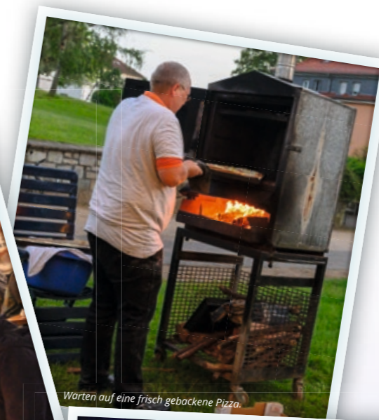
Warten auf eine frisch gebackene Pizza.