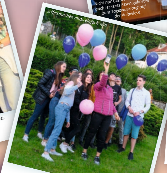
Selbstmachen muss einfach sein.