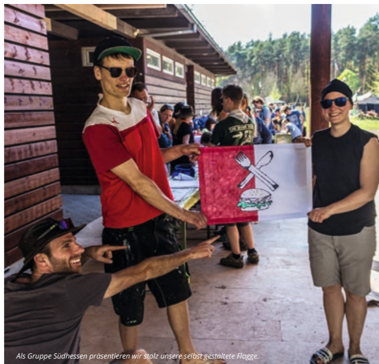
Als Gruppe Südhessen präsentieren wir stolz unsere selbst gestaltete Flagge.