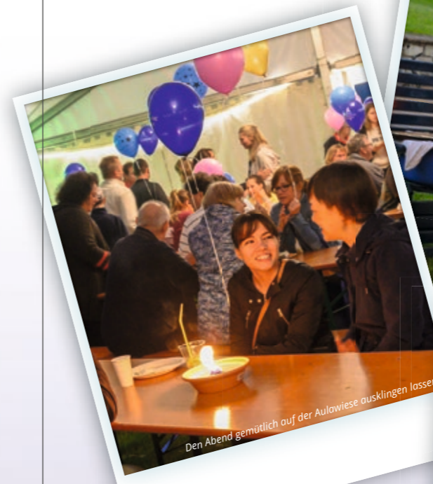
Den Abend gemütlich auf der Aulawiese ausklingen lassen.