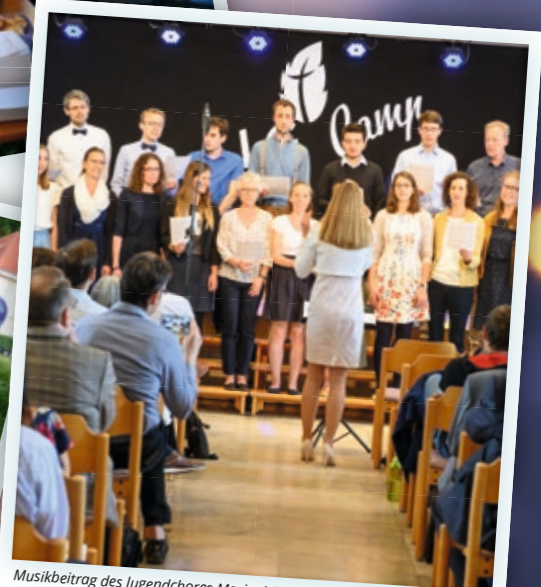
Musikbeitrag des Jugendchores Marienhöhe.