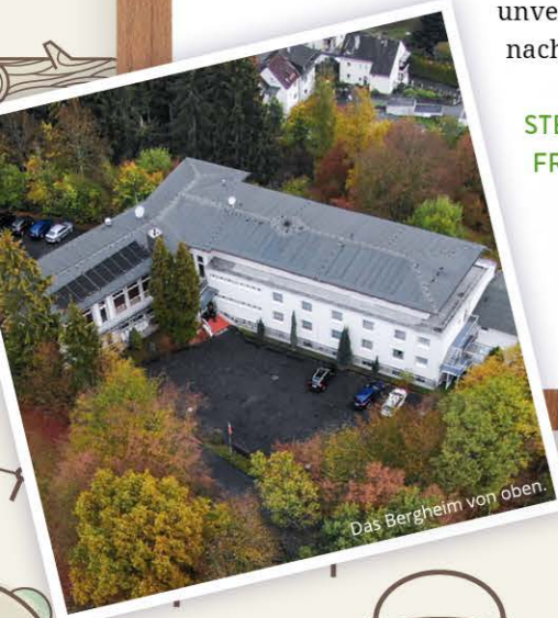
Das Bergheim von oben.