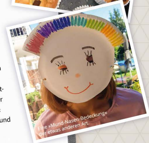
Eine »Mund-Nasen-Bedeckung« der etwas anderen Art.