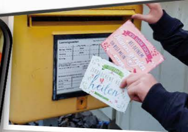
Kommunikation über verschiedene Kanäle.