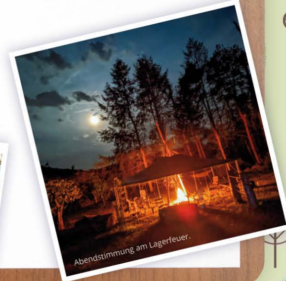
Abendstimmung am Lagerfeuer.