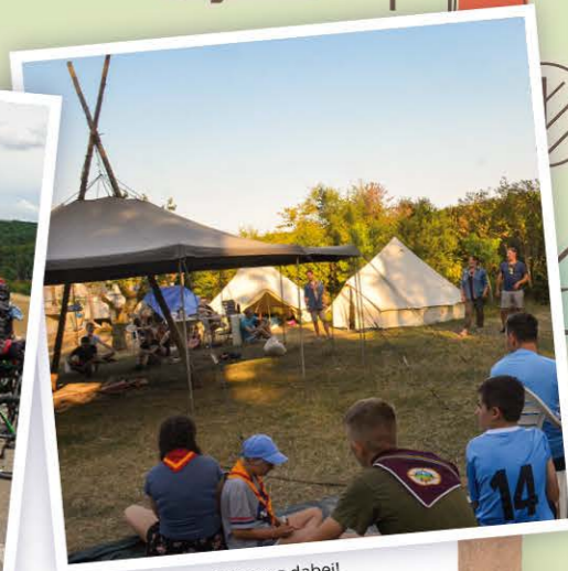
Alle sind mit Begeisterung dabei!