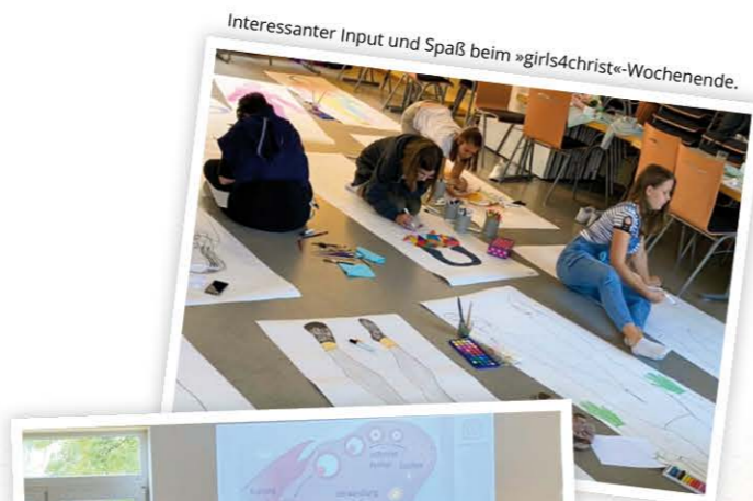
Interessanter Input und Spaß beim »girls4christ«-Wochenende.

Kreativ näherten wir uns dabei einem ganz besonderen Wunder der Schöpfung – dem weiblichen Körper – und nutzten die Gelegenheit für ausführlichen »girls.talk«. Im nächsten Jahr werden wir viermal die Möglichkeit haben, uns als »girls4christ« zu treffen: an zwei ganzen Sonntagen und an zwei Sabbaten in Kombination mit dem »Frauen Impuls Sabbat«. Wir freuen uns auf dich!