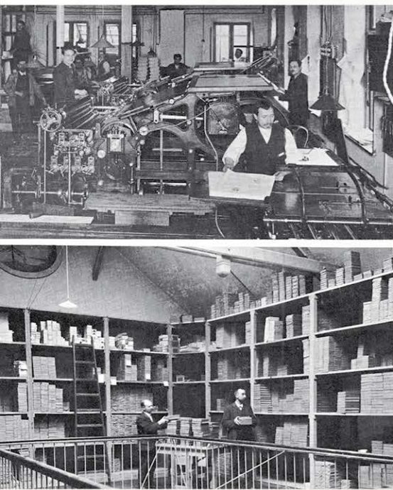
Ein Blick in die Anfangszeit des Verlags.