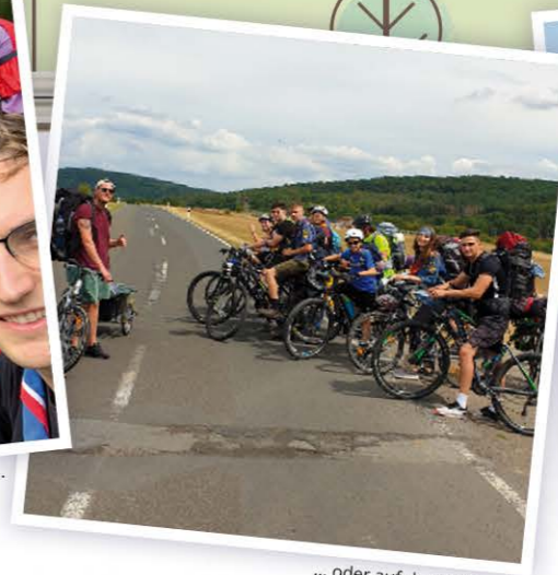
... oder auf dem Fahrrad: