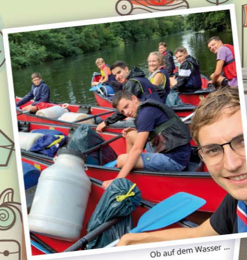
Ob auf dem Wasser ...