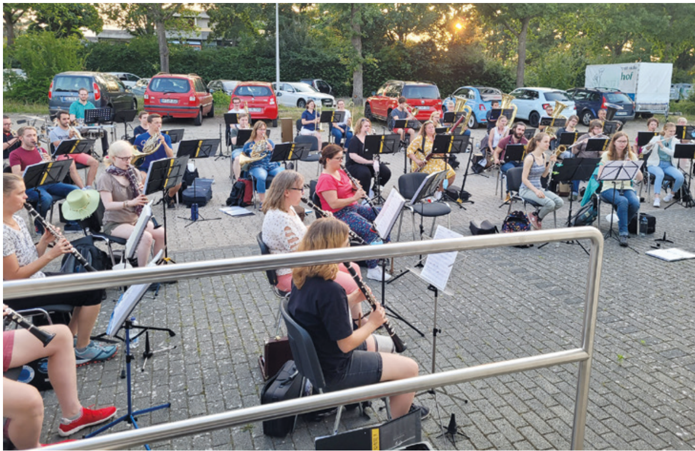
Probe am letzten Donnerstag

Blasorchester Wixhausen sammelt für Opfer der Flutkatastrophe