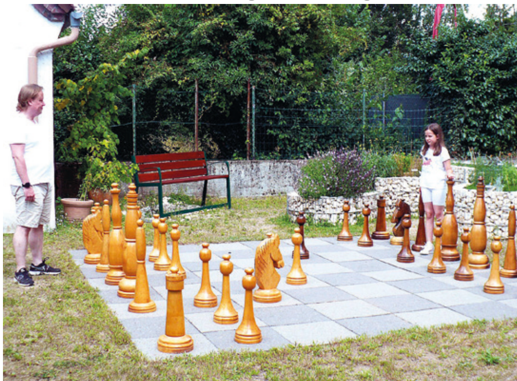
Schachbrett im Hof, Wixhausen Ostendstraße 27-29

(ev) Trauen Sie sich zu, eine Schachgruppe zu gründen und zu leiten? In der Wixhäuser Ostendstraße können Sie in schöner Umgebung in der freien Natur spielen. Bei schlechtem Wetter steht der Saal zur Verfügung, wo bereits jeden