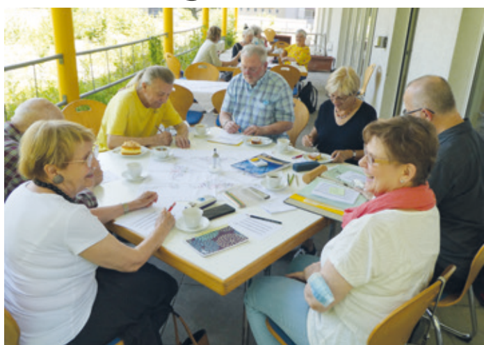
Beim Gedächtnistraining auf der Dachterrasse

(ww) Die notwendigen Einschränkungen durch die