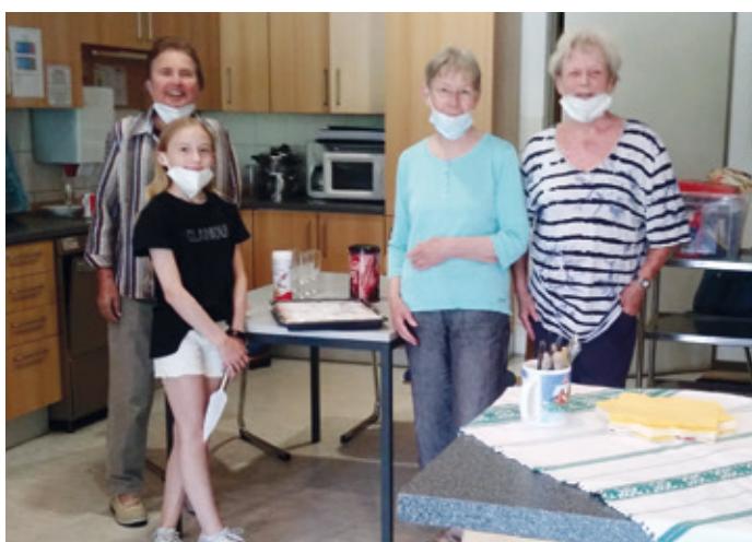
Die Kuchenbäckerinnen im Nachbarschaftscafé

(ots) Vier Springreitsattel und einen Reithelm im Wert von mehreren Tausend Euro haben Einbrecher am Samstag (24.7.) auf dem Gelände eines Reitvereins in der Kranichsteiner Straße erbeutet. Zwischen 0.30 Uhr und 6 Uhr brachen die Täter in die Pferdeboxen des Reiterhofes ein und ließen die wertvollen Reitutensilien mitgehen. Das Kommissariat 43 in Darmstadt ist mit dem Fall betraut und nimmt sachdienliche Hinweise von Zeugen zu den Tätern oder dem Verbleib der Beute unter der Rufnummer 06151/9690 entgegen.