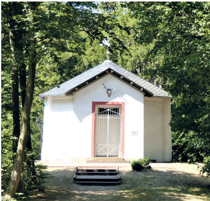
(Abb. 9a) Dianaburg

Für naturhistorisch Interessierte gibt es hier viel zu entdecken. An der Dianaburg und im Wald gegenüber stehen seltene aus Stocktrieben entstandene hohe Kiefern, darunter Sechslinge, von denen allerdings nicht mehr alle Stämme erhalten sind. Außerdem ist eine Totholzeiche zu bestaunen, in deren Stamm Guckfenster eingelassen sind mit Insekten, die u.a. hier ihren Lebensraum haben (Abb. 9b).