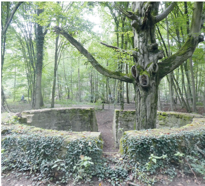
(Abb. 8) Charlottenplatz an unterer Stockschlagschneise

Nicht genug mit Brunnen, Bäumen und Teichen landgräflicher Herrlichkeit. Am Weg steht links im Wald ein schanzenartiger Jagdschirm, in dessen Mitte inzwischen ein Baum wächst. Durch die Schießscharten konnten die Jäger auf Tiere schießen, ohne selbst angegriffen oder bemerkt zu werden. Erbaut hat diesen und andere gemauerte Schirme Landgraf Ludwig VIII. Charlottenplatz heißt der Ort, benannt nach seiner Schwester Henriette-Charlotte. Sie war angeblich nicht nur jagdbesessen wie ihr Vater und ihr Bruder, sondern auch verschwendungssüchtig und zudem wenig glücklich mit einem nicht grade reichen Kasseler Prinzen verheiratet. Sie hielt sich lieber am prunkvollen, aber hoch verschuldeten Darmstädter Hof auf als bei ihrem Gatten.