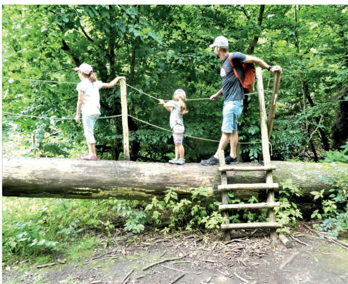
(Abb. 11) Der Fabienne Steig bei der Dianaburg

Im September 2018 zog das Sturmtief Fabienne quer durch Deutschland und richtete besonders im Rhein-Main Gebiet riesige Schäden an. Umgeworfene Bäume blockierten Landstraßen und Orte wie Mörfelden. Im Kranichsteiner Wald wurden in wenigen Minuten Jahrhunderte alte Bäume entwurzelt oder wie Streichhölzer umgeknickt. Auf 800 Meter hat das Bioversum in Kranichstein diesen Steig geplant, um die Dramatik der mit dem Klimawandel einhergehenden Waldschäden erlebbar zu machen. An Seilen als Orientierungshilfen geht es auf und über umgefallene Baumriesen und an mannshoch aufragenden Wurzeltellern vorbei. Der Weg führt durch eine zerstörte Welt, deren Eindringlichkeit im Kopf Spuren von Nachdenklichkeit und Zukunftsbesorgnis hinterlässt. Aber die in dieser Apokalypse aufkommenden Jungpflanzen, die Pilze und Moose auf vermoderndem Holz sind auch Anzeiger für die Selbsthilfekräfte der Natur, die einen sich selbst überlassenen Wald hervorbringen werden – der nichts mit dem gemein haben wird, den wir immer noch, und ganz besonders im Messeler Park, bestaunen können. Sieben Stationen informieren Sie auf dem Steig. Festes Schuhwerk sollte man anhaben. Für Kinder ist der Steig ein ganz besonderes Erlebnis und allein schon einen Besuch wert. Beim alten Forsthaus Kalkofen finden Sie Parkmöglichkeiten.