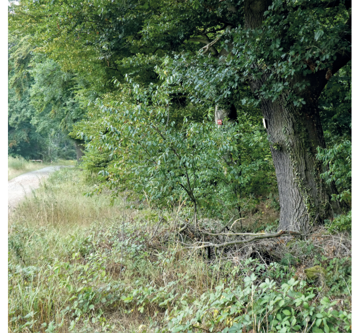
(Abb. 12) Der Graben des Ärgers der Arheilger Bauern

Kurzum: Die Arheilger Bauern wollten kein Wild auf ihren Feldern und der Landgraf ihnen keinen Zaun spendieren. So kam es, dass den Arheilgern ein Schutzzaun vor dem Wald verweigert, ihnen aber huldvoll genehmigt wurde, in mühevoller Schufferei selbst einen tiefen Graben als Schutz gegen das Wild ausheben zu dürfen. So war das damals. Gehen Sie nicht achtlos an diesem weithin unbekanntem und unscheinbarem Ort großen Ärgers vorbei.