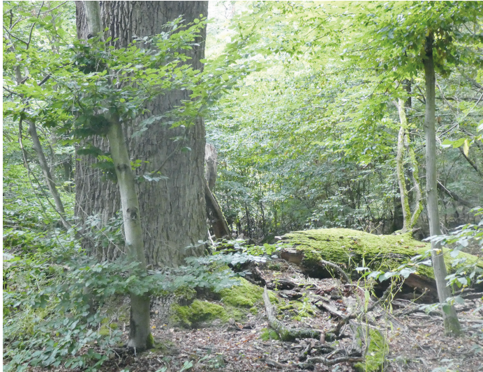
(Abb. 7) Baumveteran an Unterer Stockschlagschneise

Biegen Sie nach Querung der Silzwiesen in den Unteren Stockschlagweg ein, der mit etlichen weiteren Erinnerungen an landgräfliche Jagdherrlichkeit aufwartet. Nein – Stockschläge wurden an unartige Kinder hier nicht verabreicht. Als Stockausschläge oder kurz Stockschläge bezeichnet man bei Bäumen Triebe, die aus dem Stumpf, auch Stock genannt, wieder austreiben – eine frühe Form der Waldbewirtschaftung. Der gesamte Stockschlagweg ist eine Allee uralter Baumveteranen – lebender und abgestorbener. Es lohnt sich, Blicke nach links und rechts in den Wald und nach oben in die Kronen zu werfen. Bereichern Sie ihre Eindrücke mit einem kurzen Abstecher in die Schneise nach Osten und zurück, wo sich uralte Eichen nur so häufen. Der Erhalt eines Netzes von sogenannten Habitat Bäumen (Tot- und Altholz sowie Nistbäume) sind Beiträge zur Steigerung der Artenvielfalt moderner Forstwirtschaft.