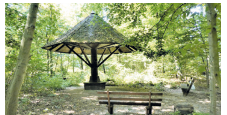
(Abb. 6) Tempel an Georgenbrunnen und Arheilger Viehtrift