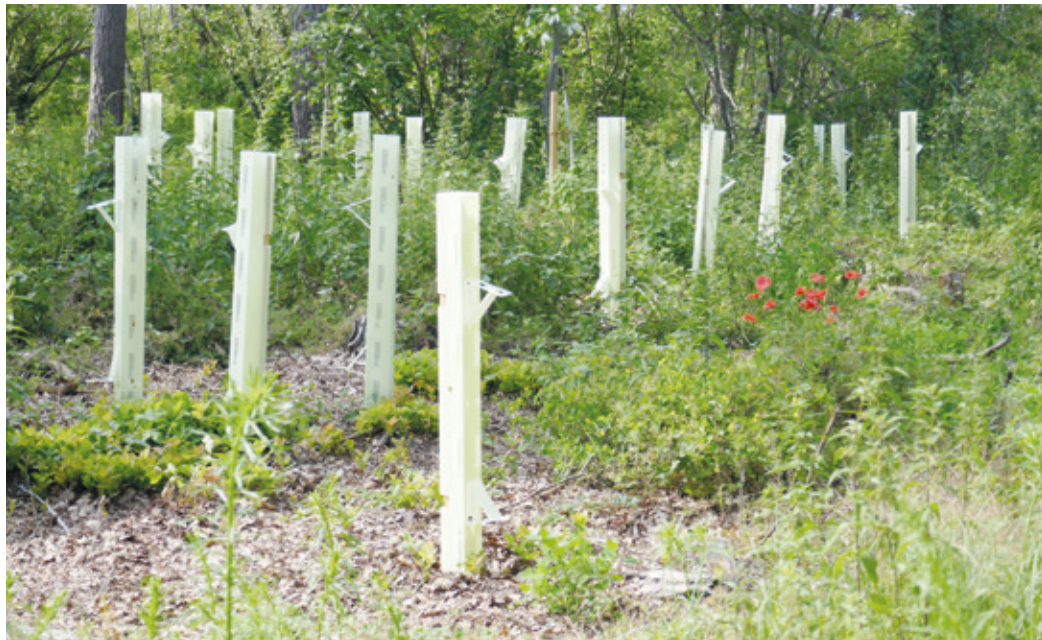
Schutzhüllen für die Jungpflanzen auf dem ORPLID-Gelände.

Ein Konzept für Aufforstung und Nachhaltigkeit