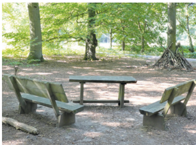
(Abb. 4) Sitzgruppe am Bornweg, Abzweigung nach Messel

Am etwas ansteigenden Weg zur Bornschneise stehen viele alte Eichen. An der Kreuzung mit der Langen Schneise können Sie in diese einbiegen zu einem Besuch von Messel mit seinen Fachwerkhäusern und dem sehenswerten Heimat- und Fossilienmuseum. Südlich des Mörsbacher Grundes steht am Weg eine einladende Sitzgruppe. Von hier können Sie einen kleinen Abstecher zu dem nahen Zinkenteich machen. Es ist ein „Himmelsgewässer“ ohne eigenen Zufluss und es wird nur vom Grundwasser und dem Himmel gespeist. Gegenüber, mitten auf der Zinkenwiese, und daher leider nicht zugänglich, steht einer der vielen Namensbäume im Wald. Die „Huteiche“ ist die letzte Eiche eines ehemaligen Hutewaldes. Hutewälder wurden früher gerne als Waldweiden genutzt anstelle der aufwändig zu pflegenden Mähwiesen. Diese Eiche hat einen Umfang von sechseinhalb Metern. Auf der Webseite des Forstamts Darmstadt finden Sie alle Namensbäume des Forstamtsbezirks östlich von Darmstadt. In die Wälder des Messeler Parks trieben früher auch die Erzhäuser Bauern ihr Vieh. Daran erinnert der am Nordrand des Mörsbacher Grundes verlaufende Erzhäuser Weg (s. Karte).