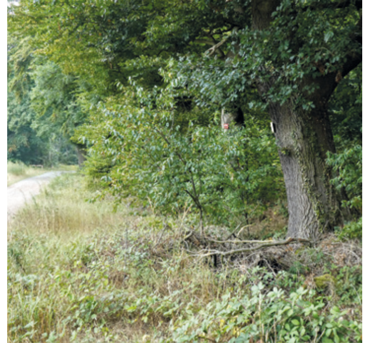
(Abb. 12) Der Graben des Ärgers der Arheilger Bauern

Kurzum: Die Arheilger Bauern wollten kein Wild auf ihren Feldern und der Landgraf ihnen keinen Zaun spendieren. So kam es, dass den Arheilgern ein Schutzzaun vor dem Wald verweigert, ihnen aber huldvoll genehmigt wurde, in mühevoller Schufferei selbst einen tiefen Graben als Schutz gegen das Wild ausheben zu dürfen. So war das damals. Gehen Sie nicht achtlos an diesem weithin unbekanntem und unscheinbarem Ort großen Ärgers vorbei.