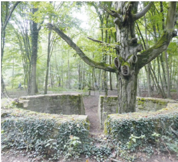
(Abb. 8) Charlottenplatz an unterer Stockschlagschneise

Nicht genug mit Brunnen, Bäumen und Teichen landgräflicher Herrlichkeit. Am Weg steht links im Wald ein schanzenartiger Jagdschirm, in dessen Mitte inzwischen ein Baum wächst. Durch die Schießscharten konnten die Jäger auf Tiere schießen, ohne selbst angegriffen oder bemerkt zu werden. Erbaut hat diesen und andere gemauerte Schirme Landgraf Ludwig VIII. Charlottenplatz heißt der Ort, benannt nach seiner Schwester Henriette-Charlotte. Sie war angeblich nicht nur jagdbesessen wie ihr Vater und ihr Bruder, sondern auch verschwendungssüchtig und zudem wenig glücklich mit einem nicht grade reichen Kasseler Prinzen verheiratet. Sie hielt sich lieber am prunkvollen, aber hoch verschuldeten Darmstädter Hof auf als bei ihrem Gatten.