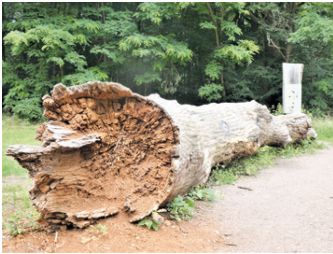
(Abb. 9b) Die Totholzeiche an der Dianaburg