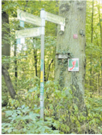
(Abb. 1) Beginn des Stellwegs gegenüber Forsthaus Bayerseich

Gleich am Anfang des Stellwegs weisen Sie etliche Wegweiser auf die gute Erschließung des Waldes für Besucher hin. Die alte Eiche dahinter erinnert an die großen Eichenbestände, die es einstmals in dem Buchen-Eichen Mischwald gab. Bei dieser Tour werden Ihnen noch etliche Eichen-Veteranen auffallen. Ein Spaß für Kinder: Sucht am Wegrand nach dem dicksten Baum, der Euch begegnet! Ein Rollmeter aus Mutters Nähkasten hilft beim Vermessen jeweils in einem Meter Höhe. Beachtet aber, dass man in Naturschutzgebieten die Wege nicht verlassen darf.