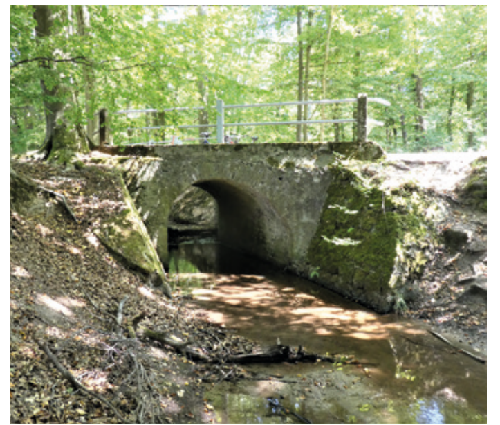
(Abb. 13) Der Hahnwiesenbach im Mörsbacher Grund

Der Mörsbacher Grund gehört zu dem Natura 2000-Gebiet mit den Naturschutzgebieten Heegbachau, Mörsbacher Grund, Silzwiesen und dem Wildschutzgebiet Kranichstein. Das Mosaik aus Wiesen, Wäldern, kleinen Bächen und einigen Teichen macht daraus ein Rückzugsgebiet für viele geschützte Arten und darüber hinaus ein Schutzgebiet von europäischem Rang.