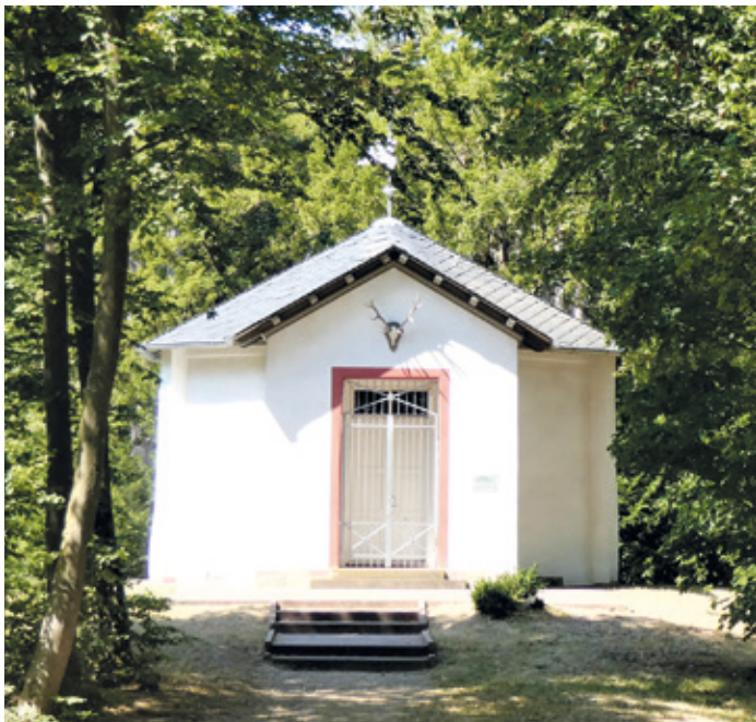
(Abb. 9a) Dianaburg

Für naturhistorisch Interessierte gibt es hier viel zu entdecken. An der Dianaburg und im Wald gegenüber stehen seltene aus Stocktrieben entstandene hohe Kiefern, darunter Sechslinge, von denen allerdings nicht mehr alle Stämme erhalten sind. Außerdem ist eine Totholzeiche zu bestaunen, in deren Stamm Guckfenster eingelassen sind mit Insekten, die u.a. hier ihren Lebensraum haben (Abb. 9b).