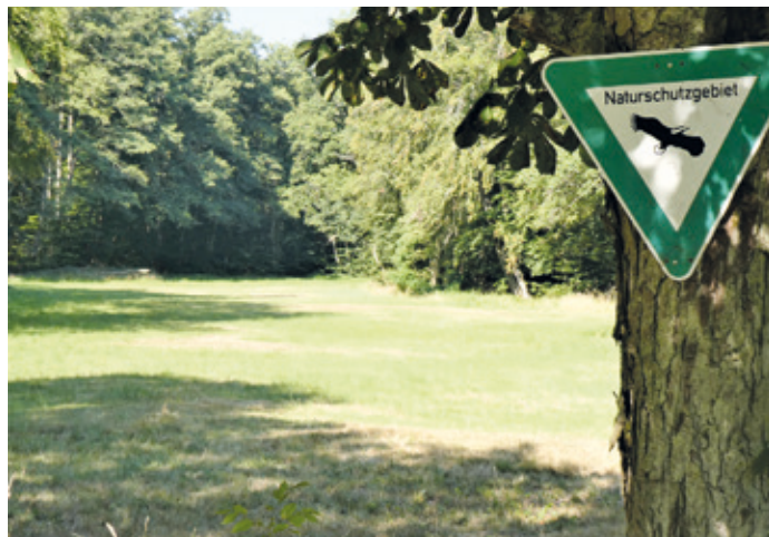
(Abb. 3) Naturschutzgebiet obere Heegbachaue am Dammweg

Die Heegbachaue ist ein Naturschutzgebiet, das die Feuchtwiesen und Altholzbestände beiderseits von Heegbach und Rutschbach zwischen Messel und Egelsbach umfasst. Viele begleitende Wiesenflächen liegen heute brach und werden von Folgestadien besiedelt. Geschützte Wald-Wiesen-Bereiche umfassen weiterhin den Mörsbacher Grund und die Silzwiesen. Für Fremde sind die vielen Namen des Heegbachs sicherlich verwirrend. Östlich der Lütkekmann Hütte mündet in den Bach der Zufluss der Offenthaler Kläranlage. Ab hier heißt er kartografisch korrekt Hegbach östlich davon Rutschbach. Das hält aber die Egelsbacher nicht davon ab, den ganzen Bach Rutschbach zu nennen und die Erzhäuser hält es nicht davon ab, das „e“ genüsslich zu dehnen und den Bach zu verweiblichen, weshalb er im Dorfmund „die Heebach“ und hochgedeutscht Heegbach heißt. Und wenn die Egelsbacher vom Mühlbach sprechen, dann ist damit das gleiche Gewässer gemeint, zumindest westlich der Dreischläger Allee. Dort stand bis 1857 am Rand einer Wiese die einzige Mühle am gesamten Bachlauf.