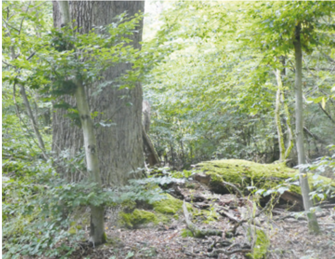
(Abb. 7) Baumveteran an Unterer Stockschlagschneise

Biegen Sie nach Querung der Silzwiesen in den Unteren Stockschlagweg ein, der mit etlichen weiteren Erinnerungen an landgräfliche Jagdherrlichkeit aufwartet. Nein – Stockschläge wurden an unartige Kinder hier nicht verabreicht. Als Stockausschläge oder kurz Stockschläge bezeichnet man bei Bäumen Triebe, die aus dem Stumpf, auch Stock genannt, wieder austreiben – eine frühe Form der Waldbewirtschaftung. Der gesamte Stockschlagweg ist eine Allee uralter Baumveteranen – lebender und abgestorbener. Es lohnt sich, Blicke nach links und rechts in den Wald und nach oben in die Kronen zu werfen. Bereichern Sie ihre Eindrücke mit einem kurzen Abstecher in die Schneise nach Osten und zurück, wo sich uralte Eichen nur so häufen. Der Erhalt eines Netzes von sogenannten Habitat Bäumen (Tot- und Altholz sowie Nistbäume) sind Beiträge zur Steigerung der Artenvielfalt moderner Forstwirtschaft.