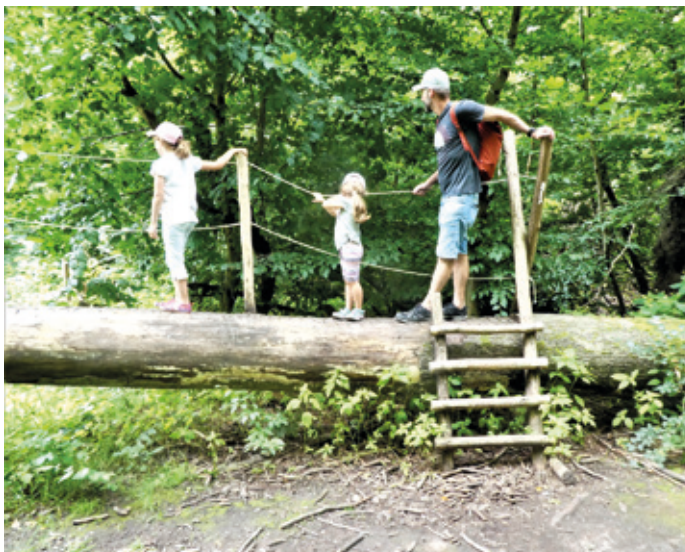
(Abb. 11) Der Fabienne Steig bei der Dianaburg

Im September 2018 zog das Sturmtief Fabienne quer durch Deutschland und richtete besonders im Rhein-Main Gebiet riesige Schäden an. Umgeworfene Bäume blockierten Landstraßen und Orte wie Mörfelden. Im Kranichsteiner Wald wurden in wenigen Minuten Jahrhunderte alte Bäume entwurzelt oder wie Streichhölzer umgeknickt. Auf 800 Meter hat das Bioversum in Kranichstein diesen Steig geplant, um die Dramatik der mit dem Klimawandel einhergehenden Waldschäden erlebbar zu machen. An Seilen als Orientierungshilfen geht es auf und über umgefallene Baumriesen und an mannshoch aufragenden Wurzeltellern vorbei. Der Weg führt durch eine zerstörte Welt, deren Eindringlichkeit im Kopf Spuren von Nachdenklichkeit und Zukunftsbesorgnis hinterlässt. Aber die in dieser Apokalypse aufkommenden Jungpflanzen, die Pilze und Moose auf vermoderndem Holz sind auch Anzeiger für die Selbsthilfekräfte der Natur, die einen sich selbst überlassenen Wald hervorbringen werden – der nichts mit dem gemein haben wird, den wir immer noch, und ganz besonders im Messeler Park, bestaunen können. Sieben Stationen informieren Sie auf dem Steig. Festes Schuhwerk sollte man anhaben. Für Kinder ist der Steig ein ganz besonderes Erlebnis und allein schon einen Besuch wert. Beim alten Forsthaus Kalkofen finden Sie Parkmöglichkeiten.