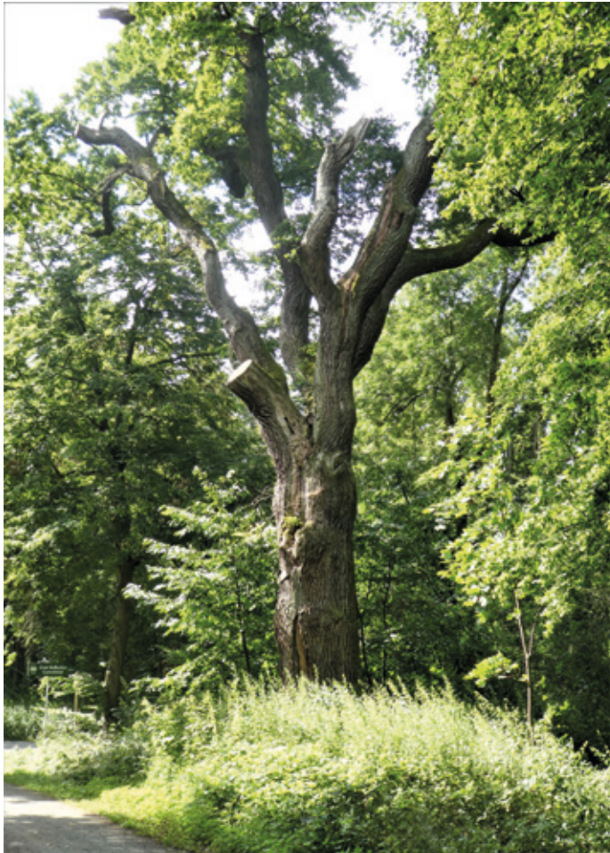
(Abb. 10) Die Dragonereiche

An der Kreuzung zur Kalkofenschneise steht ein weiterer Eichen-Veteran, die Dragonereiche. Sie erinnert an die Hessen-Darmstädtischen-Leibdragoner, die hier unter Ludwig VIII. ein Lager hatten. Auch das ehemalige Forsthaus Kalkofen, heute ein Gartenlokal, war für Ludwig aus ganz anderen Gründen einstmals von Interesse. Hier gab es nämlich einträgliche Kalk- und Lehmvorkommen, aus denen das Material für Kalköfen und Ziegeleien gefördert wurde.