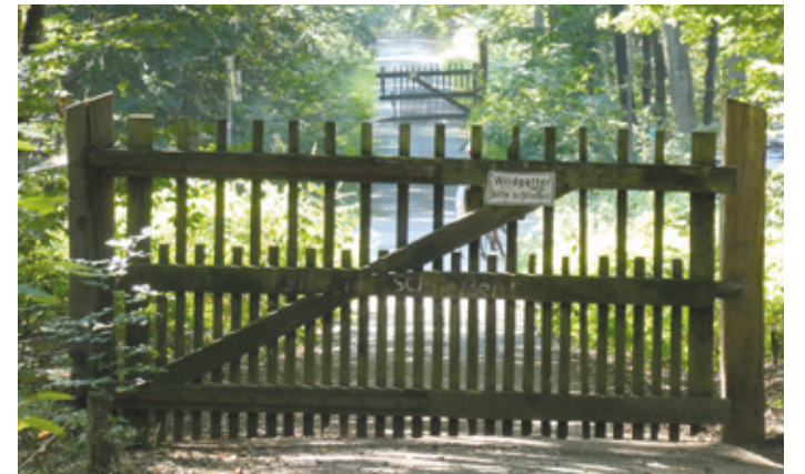
(Abb. 5) Wildgatter im Park

Über die Kalkofenschneise kommen Sie direkt zum ehemaligen Forsthaus Kalkofen mit einem vielbesuchten Gartenlokal. Oder Sie wandeln weiter auf landgräflicher Jagdherrlichkeit. Dazu biegen Sie in die Teichschneise ein und folgen dieser bis zur Kranichsteiner Straße. Dort und an weiteren Waldzugängen gibt es noch die altertümlichen Falltore des einstmals großen Wildparks, der bis nach dem letzten Weltkrieg bestand. Heute sind nur noch kleinere Bereiche im Kranichsteiner Wald eingezäunt. Durch die besondere Aufhängung fallen die Lattentore von selbst zu und die Durchgänge sind für das Wild geschlossen. Von den Falltoren aus landgräflicher Zeit sind keine erhalten. Hüter der Falltore waren einstmals die Förster der Falltorhäuser.