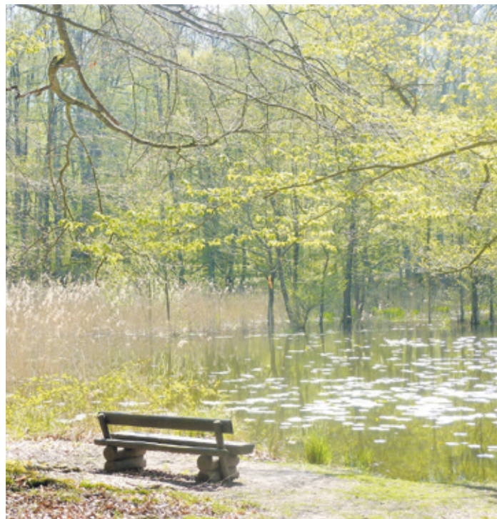
(Abb. 2) Ernst-Ludwig-Teich

Nehmen Sie dann den Weg rechts zur Hanauer-Stein-Schneise. Der Name weist auf die erwähnten Grafen und der solide Unterbau auf eine Fernverbindung hin. Biegen Sie dann links in die Speyerhügelschneise zum Talgrund der Heegbachaue ein. Der erste Waldweg rechts führt Sie zum Ernst-Ludwig-Teich. Dieser ist wegen seiner idyllischen Lage mitten im Wald ein viel besuchter Ort im Messeler Park. Der Teich wurde 1890 angelegt, als man anfing Wälder auch zu Erholungsgebieten umzugestalten. Außerdem lieferte er als Fischteich einstmals kolossale Karpfen und Hechte, wie alte Erzhäuser zu berichten wussten. Heute ist er durch Wasserpflanzen und den breiten Schilfgürtel von Verlandung bedroht. Er trägt den Namen des jagdversessenen Landgrafen Ernst-Ludwig (1678-1739). Um dessen unrühmliche Vergangenheit als absolutistischer Fürst hat man sich bei der Namensgebung seinerzeit wohl wenig Gedanken gemacht hat. Folgen Sie dem etwas holprigen Weg vom Teich bis zum ebenfalls viel befahrenen Dammweg. Dort rechts weiter zur nahen Heegbachaue. Am Waldrand steht die Lütkekmann Hütte, benannt nach einem verdienten Leiter des Langener Forstamtes.