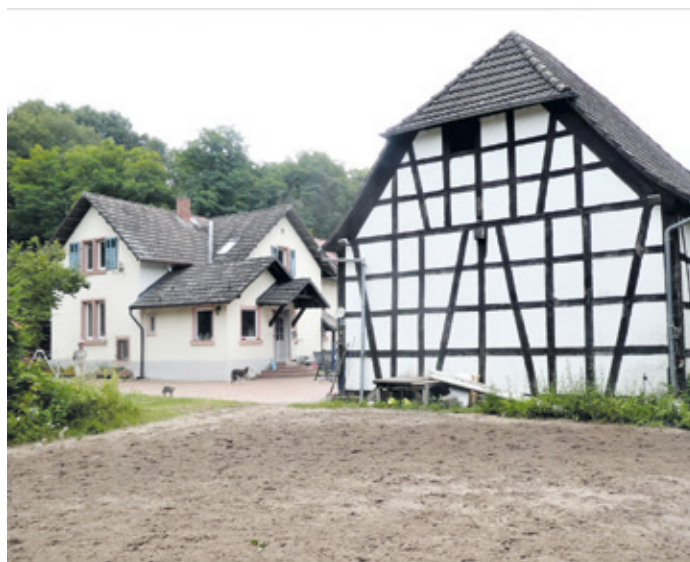
(Abb. 3) Forsthaus Apfelbachbrücke

Der Apfelbach nahebei hat keine Quelle, sondern entsteht aus einer Ableitung des Mühlbachs nahe der Hessenwaldschule. Dieser „Abfallbach“, daher der Namensursprung, sollte die zahlreichen Mühlen am Mühlbach vor Hochwasser schützen. Er fließt fast nur durch Wald zum Heegbachsee und hat daher den Beinamen Waldbach.