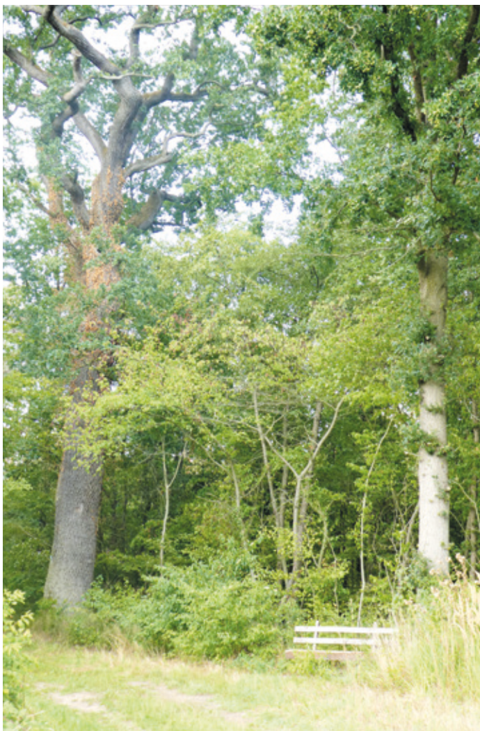
(Abb. 7) Gänsweise

Folgen Sie der pink Markierung auf der Karte vom Wiesental zur Dachsbergschneise und biegen Sie dann in die dritte Schneise rechts zur Gänswieseneiche und zur Gänsweise ein. Die Eiche ist wegen ihres Alters von ca. 250 Jahren ein geschütztes Naturdenkmal. Eine Bank lädt auch hier zum Ausruhen und Betrachten der Ruhe ausstrahlenden Landschaft ein. Durch die Wiese fließt der gleichnamige Bach, der von Erzhausen kommt und dort Weihergraben heißt. Die Gänsweise ist der westliche Teil einer Wiesenzunge, die von Erzhausen bis hierher reicht und in der Erzhäuser Gemarkung Tagwiese heißt. Der weitere Weg auf der Müllerwiesenschneise über die Gänsweise zur Mittelschneise ist anfangs etwas holprig. Er führt an der eirunden Müllerwiese vorbei die einstmals vermutlich von einem Müller bewirtschaftet wurde.