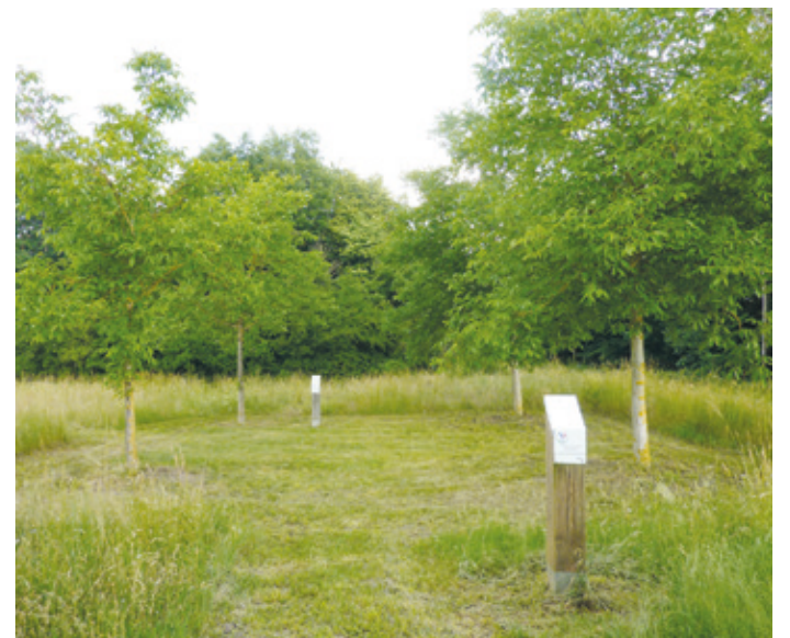
(Abb. 5) Wiesental Walnussquartier

Das Walnussquartier am Bachgrund nahe beim Wiesental ist ein Teil des Regionalpark-Netzwerks Rhein-Main. Das Quartier besteht aus insgesamt sechs Baumgruppen mit jeweils vier Walnussbäumen. Sitzgelegenheiten und Spielmöglichkeiten laden zum Verweilen ein. Infostelen erzählen mehr über die forstwirtschaftliche, mythisch-rituelle und medizinische Bedeutung der Walnuss. Dieser Baum des Jahres 2008 ist ein typischer Vertreter der heimischen Kulturlandschaft. Südlich davon am gleichen Weg liegt der Golfplatz Bachgrund. Die Anlage lohnt einen Abstecher oder einen eigenen Besuch.