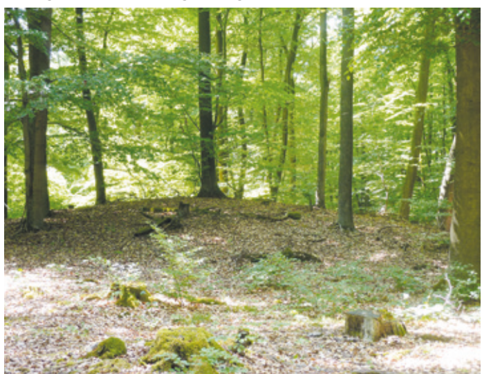
(Abb. 1) Die geheimnisvollen Hügelgräber – Ein Highlight!

Es kann angenommen werden, dass die bronzezeitlichen Erbauer für ihre Totenstätten auch vorhandene Flugsanddünen nutzten und deren Gipfel überhöhten oder auf nahe Sandlager zurückgriffen. Auf das sandige Umfeld weisen die Kiefernbestände des Waldes hin. Die Verstorbenen bettete man auf Bretter, um die sargähnliche Gehäuse errichtet wurden. Dann häuften man vermutlich mit Hilfe von Holzschaukeln, Eimern und obigen Geräten einen Hügel darüber an. Ältere Erzhäuser wussten zu berichten, dass sie dem großherzoglichen Hofrat Kofler um 1900 als Jugendliche bei Ausgrabungen helfen durften.