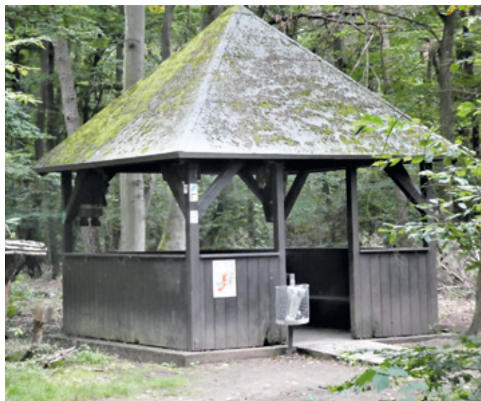
(Abb. 2) Waldtempel

An der Kreuzung der Hügelschneise mit der Rundseeschneise steht eine der vielen von Ehrenamtlichen erbauten Schutzhütten, wie sie auch in den anderen Wäldern rund um Erzhausen zu finden sind. Waldtempel heißt diese wegen ihrer Dachform. Erbaut wurde sie 1980 von dem SPD-Ortsverein Gräfenhausen. Ein guter Ort für eine Pause auch zum Sinnieren über die beiden Hügelgräber nahebei. Im Wald gegenüber liegt rechts ein markantes Beispiel, das heute noch über 2 Meter Höhe und etwa 25 Meter Durchmesser hat – und damit ein Volumen, das über das obige noch weit hinaus geht und 13 Kipperladungen Sand mehr zum Aufschütten heute brauchen würde.