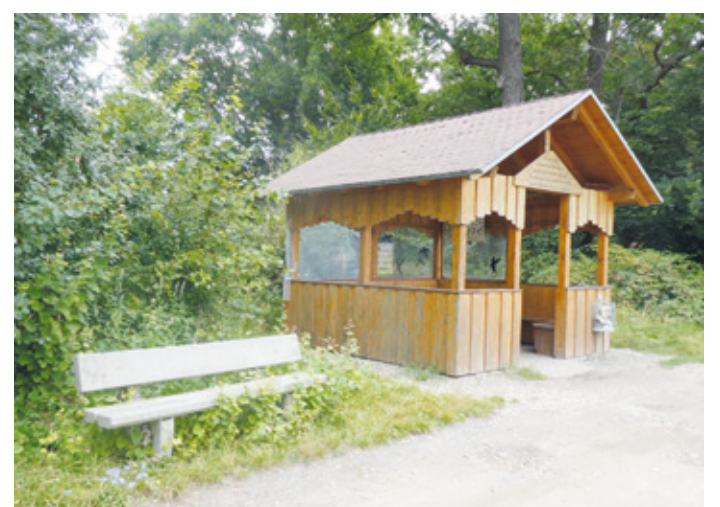
(Abb. 4) Schutzhütte

Vom alten Forsthaus führt ein ausgebauter Weg zu der 2012 von den Schnepenhäuser Kegelfreunden „Blaue Jungs“ nach Vandalismus und Brand wieder aufgebauten Schutzhütte. Bei der Hütte und im Wald stehen noch etliche mächtige Eichen.