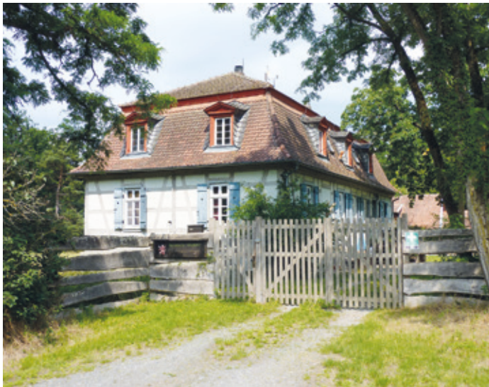
(Abb. 6) Wiesental Fosthaus