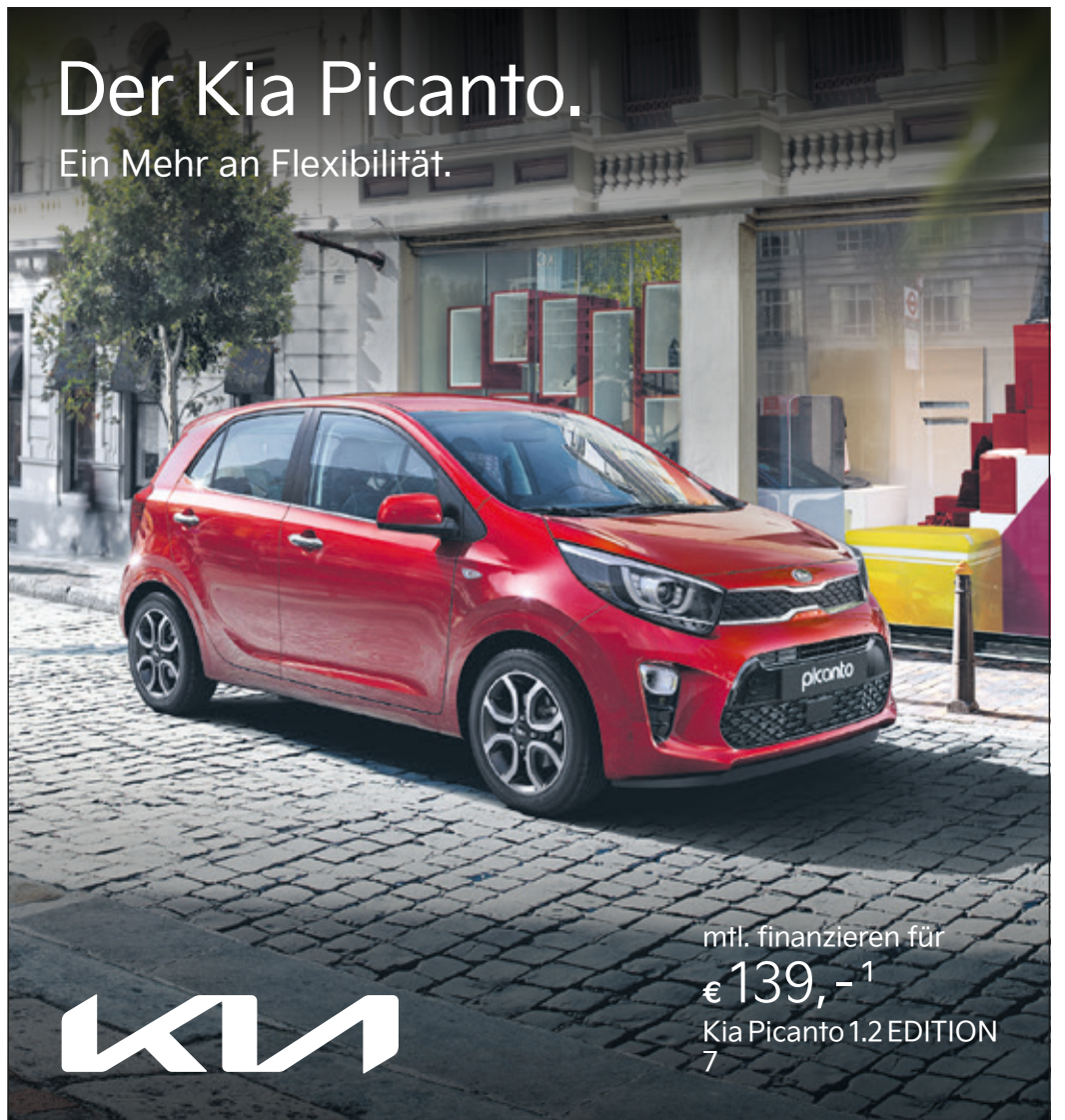
Abbildung zeigt kostenpflichtige Sonderausstattung.

neut das Promenadenkonzert, veranstaltet vom städtischen Kulturamt, mit der Gruppe Dolfins + Stars auf der Seebühne am Brentanosee Ufer, neben dem Jugendcafé Chillmo. In den folgenden Tagen dieser Woche sind weitere Veranstaltungen verschiedener Anbieter in Kranichstein geplant, die konkreten Planungen dazu laufen momentan noch. „Für alle diese Planungen ist natürlich eine weitere positive Entwicklung der Pandemiezahlen Voraussetzung, dazu können wir alle durch entsprechendes Verhalten, besonders aber durch Impfungen, die unter anderem in allen Kranichsteiner Hausarztpraxen angeboten werden, einen wichtigen Beitrag leisten.“ „Wir werden Sie über entsprechende Rundmails aber vor allem über die Arheilger Post über alle weiteren Planungen rechtzeitig informieren,“ so der Förderverein Kranichstein e.V. in seiner aktuellen Pressemitteilung.