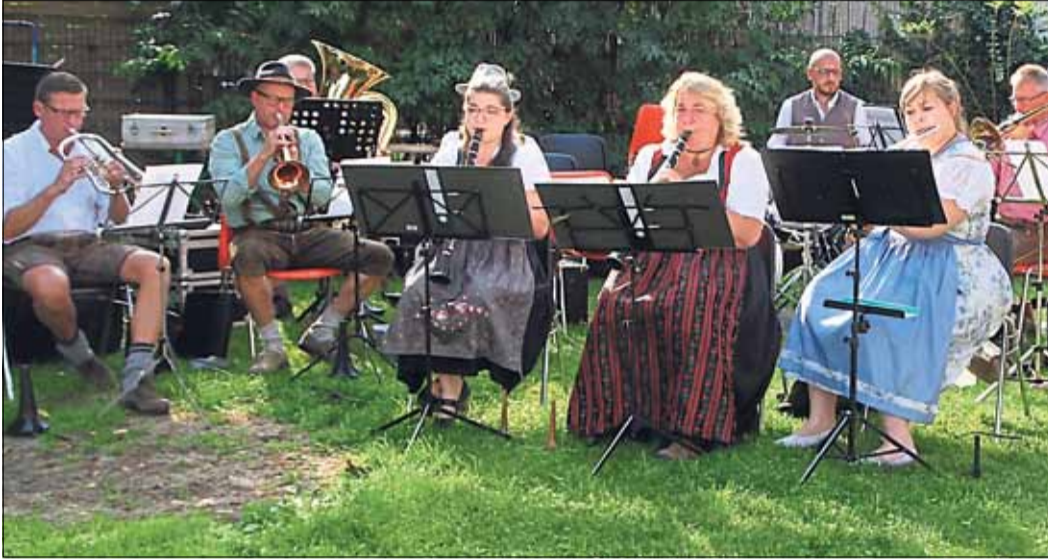
Die Elmbachtaler Musikanten umrahmten das Fest mit volkstümlichen Klängen.