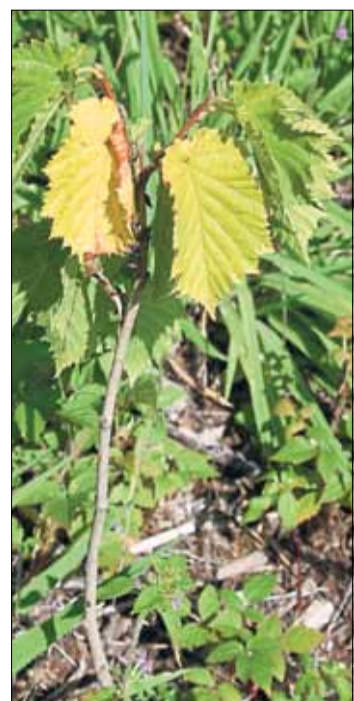
Die Knospen sprießen bei Bumhasel, Elsbeere, Marone und Co. – all diese Baumarten hat die WITO-Initiative Klimapakt auf einer Forstbrache bei Drasenberg gepflanzt.