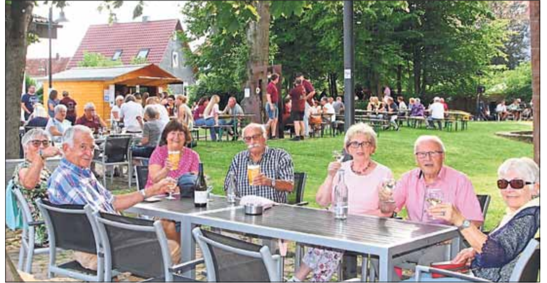
Die Schlüchterner freuten sich auf einen edlen Tropfen und gute Gespräche.