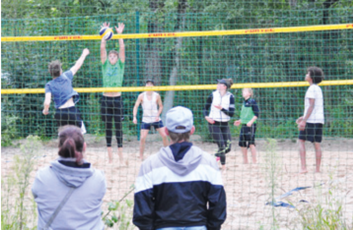
Interessierte Zuschauer beim Beachvolleyball

Sport- & Spielfest mit Tag der offenen Tür am 29.08. beim ORPLID