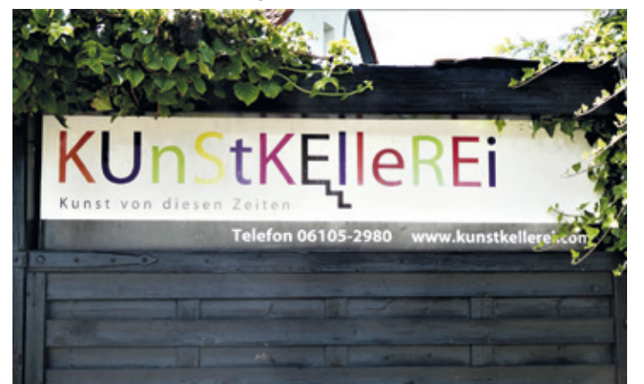
(Abb. 4b) Die KUnStKelleREi

Gleich am Ortseingang von Mörfelden fällt die KunstKellerei auf. Hier erschafft ein Künstler nicht nur „Kunst von diesen Zeiten“, sondern er stellt sie in seinem Garten aus. Gelegentlich lädt der Künstler zu Veranstaltungen ein.