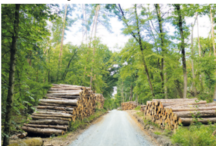
(Abb. 2) Eines der vielen Stammholzlager, hier an der Heegbergquerung

Nach der Heegbergquerung erreichen Sie die Dachsbergschneise, der Sie nach links Richtung Autobahn und Erzhausen folgen. Vor der Autobahn biegen Sie rechts in die Feldschneise ein. In der Sensfelder Tanne gibt es keine Tannen wie etwa im Schwarzwald oder in den Alpen. „Tanne“ bezeichnet im lokalen Sprachgebrauch einen Wald, in dem auch „Tannen“ stehen können, womit lokal, aber botanisch nicht korrekt, Kiefern gemeint sind. Meterhoch sind an vielen Stellen entlang des Weges Kiefernstämme aus Notfällungen aufgeschichtet. Die Trockenheit in den vergangenen Jahren, Engerlinge und der Borkenkäfer haben als kumulierte Ursachen das Absterben beschleunigt. Auf dem gesamten Weg durch den Wald sind die Folgen des Klimawandels „be-greifbar“ zu erfahren.