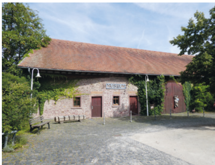
(Abb. 4e) Das Museum in der alten Scheune

Im Hof der Langgasse 45 wurde in einer ehemaligen Scheune das Museum eingerichtet. Besonders thematisiert wird die Geschichte Mörfeldens als Arbeiter-Bauernhof und die Rolle der Frauen die sich um Küche, Kinder und Kühe kümmern mussten, während die Männer bei Opel oder auf dem Bau schufteten.