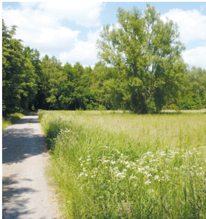
(Abb. 3) Die Hinterste Tagwiese östlich der Feldschneise

Mit den Waldwiesen entstanden auch die Waldränder, die als Saumbiotop mit ihrem Artenreichtum das besondere Interesse der Botaniker finden. Die Hinterste Tagwiese ist auch ein Beispiel für den Nutzungskonflikt zwischen traditioneller Landwirtschaft und dem auf eine höhere Wertschöpfung eingestellten Planlagenbau. Sie ist wegen der teilweisen Umnutzung zu einer umzäunten Blaubeerplantage Anlass für heftige Diskussionen und macht den Zielkonflikt zwischen intensiver Nutzung und Naturschutz in einem Ballungsraum exemplarisch deutlich.