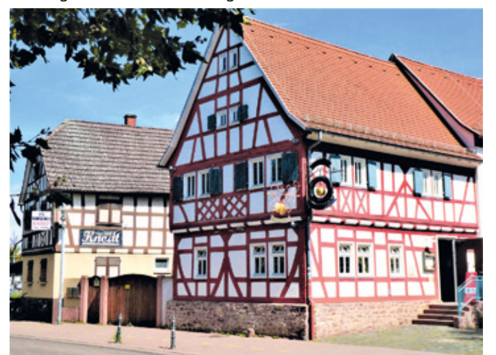
(Abb. 4c) Fachwerkhäuser mit dem Goldenen Apfel in der Langgasse

Lang ist sie absolut betrachtet gerade nicht. Aber in dem einstmalen von krummen Fachwerkgassen geprägten Mörfelden war sie es schon. Hier stehen die evangelische Kirche, etliche Fachwerkhäuser und das Museum. Sie endet oder beginnt, je nachdem woher man kommt, am Rathausplatz, in Mörfelden der Dalles genannt. An der Straße vor dem Museum steht zwischen anderen Fachwerkhäusern der „Goldene Apfel“. Es ist das Traditionsgasthaus in Mörfelden schlechthin. Alt ist es auch. 1731 steht auf einem Balken. Gastronomisch werden Sie hier beim Dalles gleich mehrfach fündig.