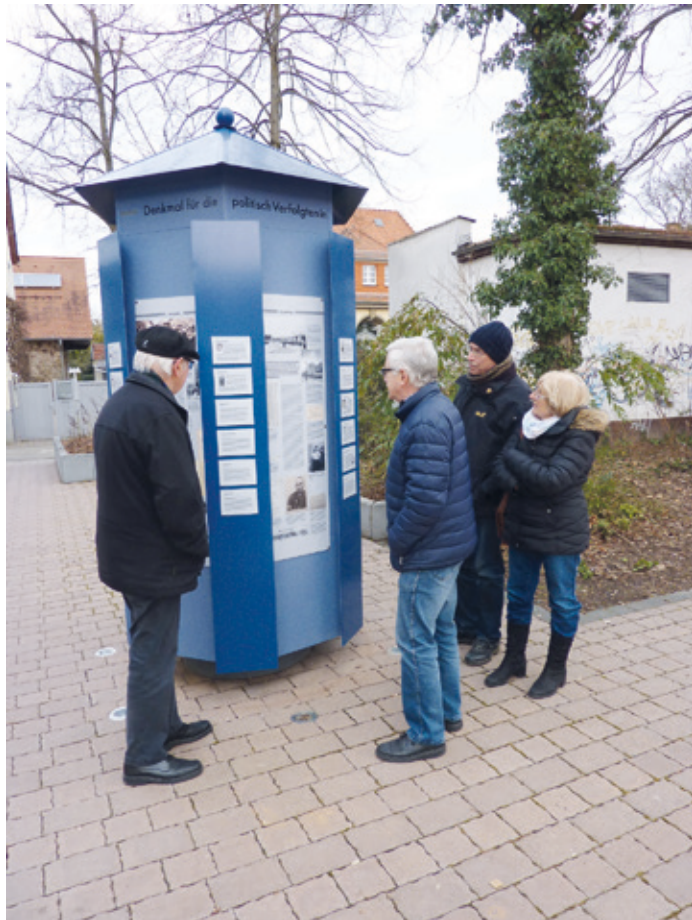
(Abb. 4d) Der blaue Infoturm zur Stadtgeschichte

Näher betrachten sollten Sie direkt neben der Kirche einen blauen Infoturm mit „Stadtgeschichte unter freiem Himmel“. Mörfelden war schon immer eine rote Hochburg der Arbeiterbewegung – was in der NS-Zeit viele Bürger ins Gefängnis oder ins KZ brachte. Biographien und ergänzende Texte vermitteln eine Vorstellung von den bedrückenden Schicksalen Mörfelder Bürger in dieser Zeit. Anhalten und Innehalten lohnt.