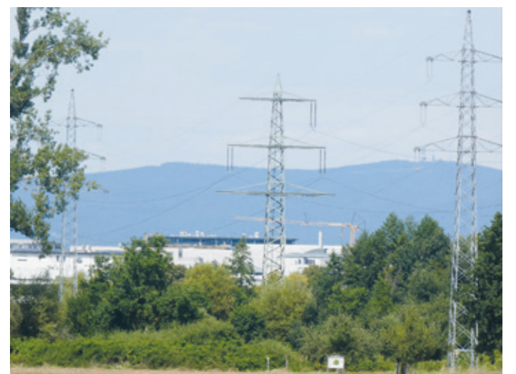
(Abb. 4a) Der Taunusblick

Überhaupt lohnt auf dem kurzen Weg nach Mörfelden der aufmerksame Blick auf eine transformierte einstmalen kleinbäuerliche Feldstruktur und was daraus geworden ist. In Mörfelden gibt es heute keinen einzigen Vollerwerbsbauern mehr. Aber was mit dem Land machen, wenn man es nicht verkaufen will, weil es zum Familienerbe gehört oder weil der Wert im Ballungsraum eher steigt als sinkt? Da gibt es auf einigen Parzellen entlang des Weges frisch angelegte Streuobstwiesen, auf anderen sind vom Nabu betreute Feldholzsinseln ein Refugium für Tiere und Pflanzen. Auf wiederum anderen Geländestreifen haben sich gut gedüngt durch atmosphärischen Stickstoffeintrag auf Brachen Brombeeren und anderer Wildwuchs breit gemacht. Dazwischen bebauen Landwirte von außerhalb, sog. Ausmärker, Felder. Und über allen Feldern erhebt sich fast zum Greifen nahe bei manchen Wetterlagen tiefdunkel der Taunuskamm. Kurzum - bei näherem Hinsehen eine interessante Landschaft.