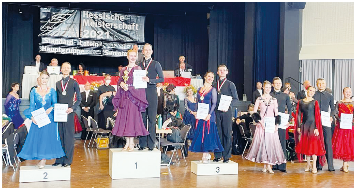
LM HGR C Std: Platz 1 bis 3 sicherten sich Paare des TSZ Blau-Gold Casino Darmstadt und ließen damit der Konkurrenz keine Chance.