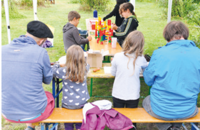
Die Kleinen beim Spielen unter dem Zelt

Schon am Vormittag kamen junge Sportinteressierte für das Deutsche Sportabzeichen oder um Beachvolleyball zu spielen. Trotz Regen hatten sie ihren Spaß und probierten zwischendurch das neuartige Roundnet-Spiel aus. Als das Badminton-Netz aufgebaut war, wurden hier fleißig die Schläger geschwungen, während man sich etwas abseits als Bogenschütze versuchte. Beim Tanztraining durfte zugeschaut werden und der ORPLID-Chor hatte während seiner Open Air-Probe eine ansehnliche Zuschauerschar.