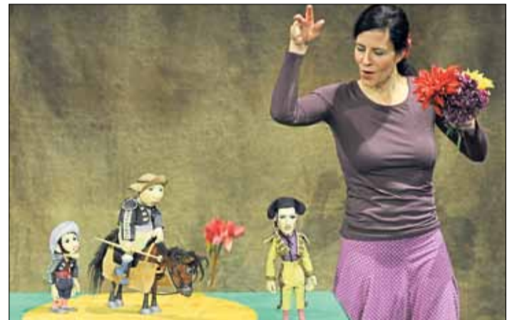
Beste Unterhaltung für Jung und Alt: „Ferdinand der Stier“ in einer Inszenierung des Theaters Kokon aus Weimar.