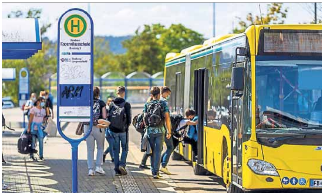
Zu jedem Schuljahresbeginn gleicht die KVG ihre Beförderungskapazitäten im Schülerverkehr mit den gemeldeten Schülerzahlen der einzelnen Schulen ab.

Weiterhin wird auf das bewährte Hygienekonzept bei den beauftragten Busunternehmen gesetzt. Gemeinsam mit dem Main-Kinzig-Kreis wurde außerdem beschlossen, auf den stark frequentierten Linien im Kreisgebiet zusätzliche vorbeugende Maßnahmen zu treffen, um ein Ansteckungsrisiko noch weiter zu reduzieren. Die Fahrzeuge werden mit UV-Entkeimungsgeräten ausgerüstet, um die Luft im Innenraum der Busse zu reinigen. Trotz Lieferengpässen bei den Herstellern hat der Umbau bereits begonnen