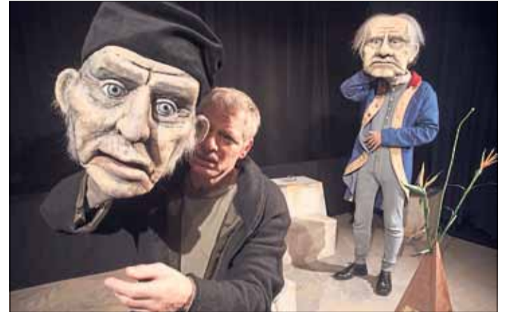
Das TheaterKorona aus Leipzig präsentiert „Die Vermessung der Welt“.

Karten im Vorverkauf gibt es beim Verkehrsbüro der Stadt Steinau, Brüder-Grimm-Str. 70, Telefon (06663) 97388 oder online: www.steinau.de