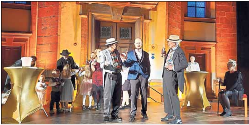
Erlebnis, Vielfalt, Emotionen: Das Ensemble feel-X präsentiert den „Salmünsterer Jedermann“, wie gewohnt, mit einer Prise wohl dosiertem Humor und dem typischen feel-X-Stempel.

Der „Jedermann“ von Hugo von Hofmannsthal wird seit 1920 jährlich bei den Salzburger Festspielen aufgeführt. Das Spiel vom Sterben des reichen Mannes ist