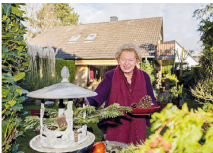
Aufgrund der immer häufiger auftretenden Wetterextreme sollten Hauseigentümer prüfen, ob ihr Versicherungsschutz ausreicht.

(djd) Immer häufiger kommt es auch in Deutschland zu extremen Wetterlagen mit Starkregen, Hochwasser und orkanartigen Böen. Dann sorgen vollgelaufene Keller, entwurzelte Bäume, undichte Dächer und verstopfte Regenrinnen potenziell für große Schäden. Wie können Immobilienbesitzer vorsorgen und ihr Eigentum schützen? Immobilie auf Schwachstellen untersuchen