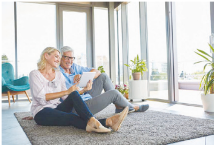
Sicherheit im Zuhause: Elektronische Schließsysteme lassen sich individuell programmieren.

(djd) Schon in der Antike haben Menschen Schlüssel genutzt, um den Zugang zu ihrem Hab und Gut zu schützen. Seit Jahrtausenden besteht damit allerdings ein unverändertes Problem: Schlüssel können verloren gehen oder entwendet werden. Wer bereits einmal das Sicherheitsschloss des Eigenheims aus Sorge vor einem Diebstahl ersetzen musste, weiß, wie kostspielig so ein Missgeschick sein kann. Doch auch die Schließtechnik wird immer smarter und digitaler. Schlüssel individuell programmieren