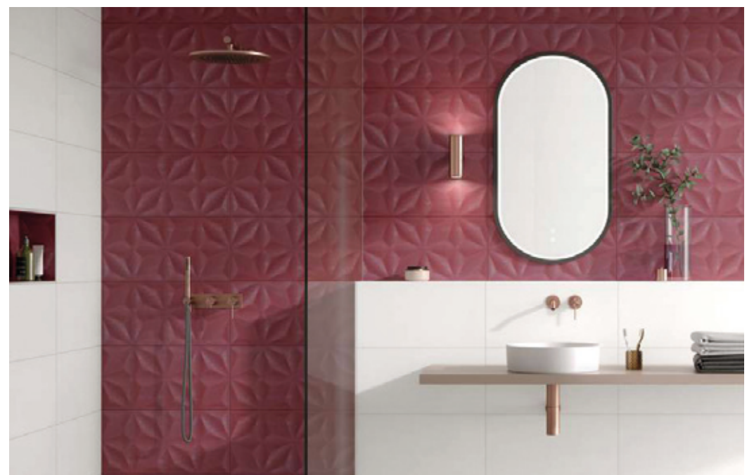
Die Ansprüche an Design, Individualität und Wohnbehaglichkeit sind heute im Bad ebenso hoch wie in den Wohnräumen.