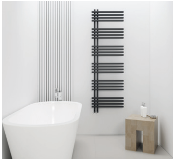
Werden auch höchstem Anspruch an Design und Funktion gerecht: Elektrobadheizkörper aus der neuen Serie Terra von anapont.

Elektrobadheizkörper, die im Online-Shop von anapont zur Auswahl stehen – ohne lange Vorlaufzeit aus. Ruck, zuck herrschen im Badezimmer angenehme 22 bis 24 Grad, wobei die Steuerung ganz bequem über eine Heizpatrone mit Zeit- und Temperaturregelung erfolgt. Da Terra aus Aluminium besteht und das Metall ein hervorragender Wärmeleiter ist, wird der Heizkörper bis in die Spitzen warm. Ob weiß oder schwarz matt – mit seiner hochwertig pulverbeschichteten Oberfläche passt er in jedes Ambiente und macht gute Laune. Sowohl frühmorgens, wenn es schnell gehen muss, als auch am Abend, wenn ein entspannendes Schaumbad auf uns wartet. Weitere Informationen zu den modernen Elektrobadheizkörpern, die optimal als Zusatzheizung geeignet sind, gibt es unter www.anapont.eu .