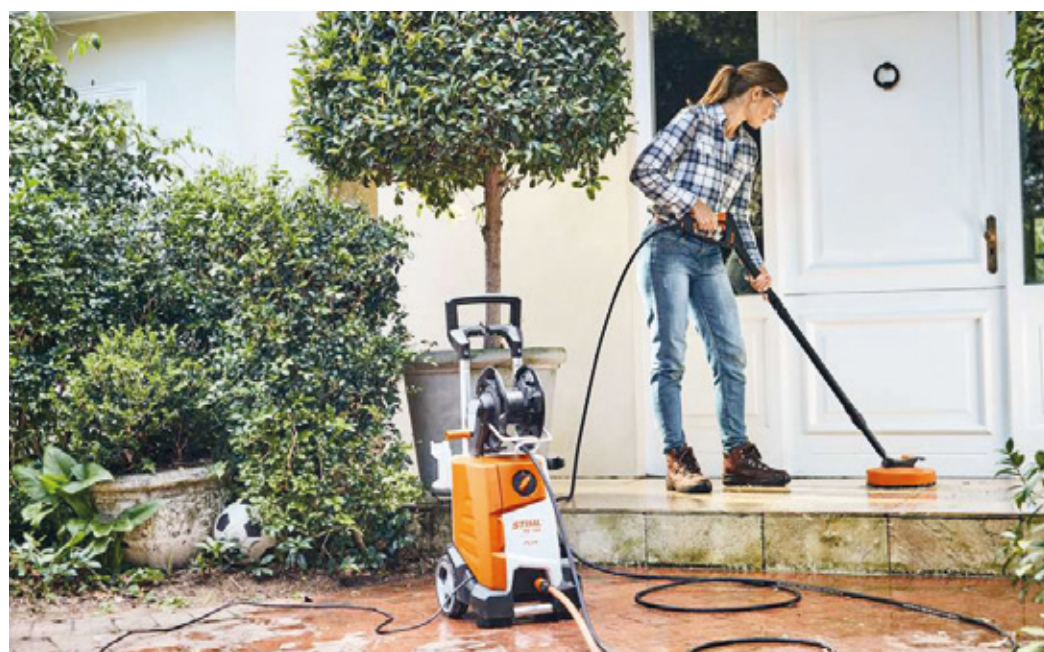
Mit einem Hochdruckreiniger sind Eingangsbereiche, Gartenwege und die Terrasse im Handumdrehen vom Schmutz befreit.

(djd) Auch wenn der Sommer für viele nie enden soll – wenn sich die Blätter der Bäume bunt verfärben und den Look des „Indian Summer“ auch in unsere Gefilde bringen, endet die Saison im heimischen Garten. Die Natur freut sich über die Ruhepause, um sich zu regenerieren und frische Kräfte für die kommende Saison zu sammeln. Hausbesitzer können ihren Beitrag dazu leisten – mit den richtigen Wellnessseinheiten für Gehölze, Beete und Hecken. Der Dank dafür ist ein gepflegter Garten, in dem man die langsam kürzer werdenden Tage bei wärmender Herbstsonne genießen kann. Immer schön sauber bleiben Damit der Herbstputz nicht zur mühevollen Aufgabe wird, erleichtern praktische Gartenhelfer die Arbeit im Garten. Für saubere Verhältnisse auf Zufahrt, Gartenwegen und der Terrasse sorgen Hochdruckreiniger. Auch Verschmutzungen auf den Gartenmöbeln sind damit einfach beseitigt. Hartnäckigen Moos- und Algenbelägen lässt sich bequem mit einem Flächenreiniger wie dem RA 90 zu Leibe rücken. Mit seinen rotierenden Reinigungsdüsen säubert das praktische Zubehör für Stihl Hochdruckreiniger Steinplatten und Holzdecks spritzwasserfrei. Herbststaub sorgt zwar an den Bäumen für Herbststimmung, auf Wegen und Rasenflächen