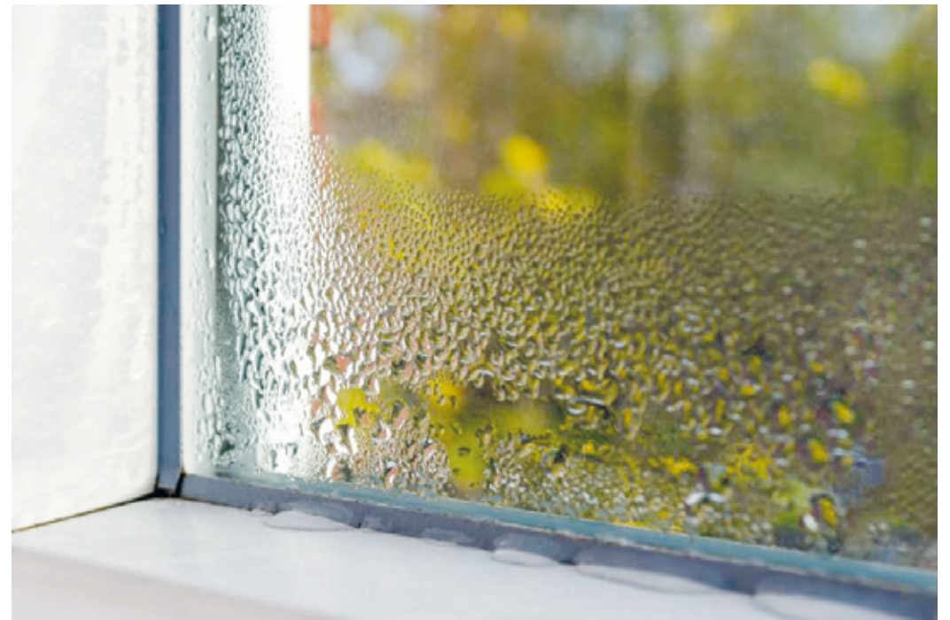
Feuchtigkeit in der Wohnung und als Ergebnis ein erhöhter Energiebedarf: Ein Austausch alter Dichtungsprofile ist dann oftmals unerlässlich.