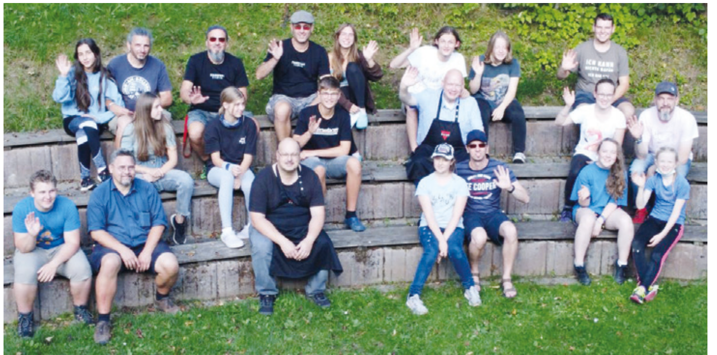
Bericht: Tom Schroeder

Gefördert durch die Hermann-Schlegel-Stiftung