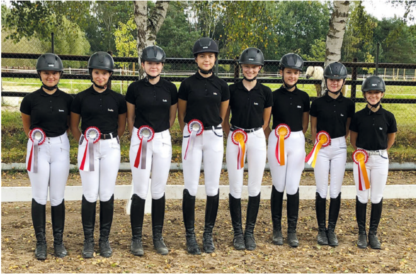
Die Mannschaften Arheilgen II und Arheilgen I waren beim Jugendcup-Finale erfolgreich.

(sj) Der Jugendcup 2021 des Pferdesport-Verbandes Hessen-Nassau endete mit Erfolgen für die beiden Mannschaften des Reitvereins Darmstadt-Arheilgen. Beim Finale, das am 19. September in Dieburg stattfand, konnte sich die Mannschaft Arheilgen II den Sieg sichern. Das Team Arheilgen I kam auf den zweiten Platz. Die Arheil-