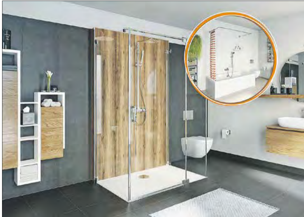
DIE BADEWANNE wurde durch eine barrierefreie Dusche ersetzt.