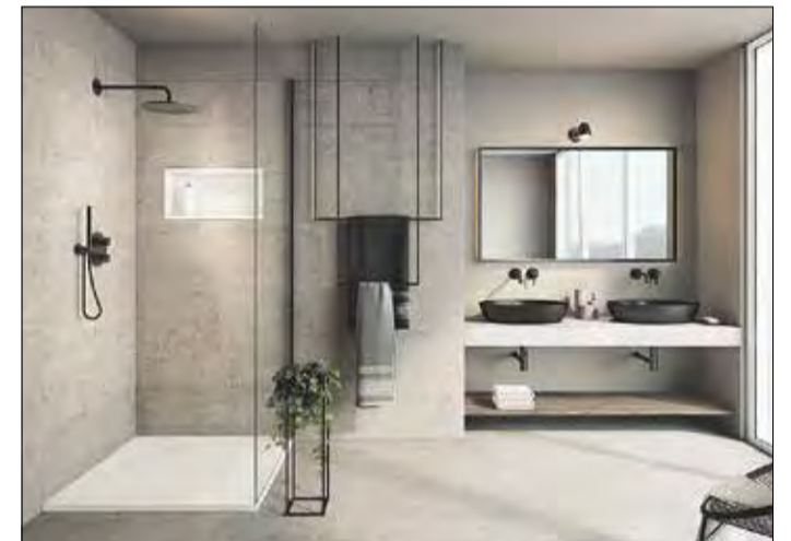
DIE DUSCHELEMENTE aus Mineralwerkstoff sind mit weiteren Badmodulen des Herstellers kombinierbar.

fertigten Elementen wie Sanja von Schedel entscheidet. Dieses ist auch für kleine Bäder mit wenig Platz geeignet. In Verbindung mit individuell konfigurierbaren Wänden aus Glaslaminat kann man bei der Einbaudusche zwischen glänzenden oder matten Optiken wählen, etwa im Beigeton Perla oder im anthrazitfarbenen Fumo. Das Duschkomplettsystem erfüllt die Mindeststandards für "barrierefrei nutzbare" Bäder nach DIN 18040-2 und ist somit bei der KfW-Bank finanziell förderfähig. (djd)