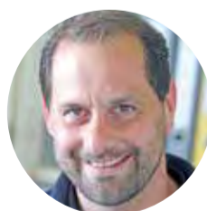
Peter Erbach Autohaus Iser Riedstadt