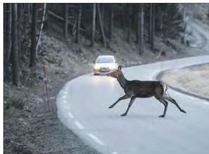
BEI SCHLECHTEN SICHTVERHÄLTNISSEN erhöht sich die Gefahr von Wildunfällen.

Hinzu kommt die Brunft der Hirsche. Wanderer und Förster beobachten die Tiere gerne, für den Autofahrer kann die Situation aber schnell außer Kontrolle geraten. So bestätigt der Gesamtverband der Deutschen Versicherungswirtschaft e. V. (GDV), dass Wildtierunfälle ein Rekordhoch aufweisen: 2019 verzeichnete die Branche 295 000 derartige Kfz-Schäden. Noch nie war diese Zahl so hoch, gleichzeitig werden die Schäden immer teurer.