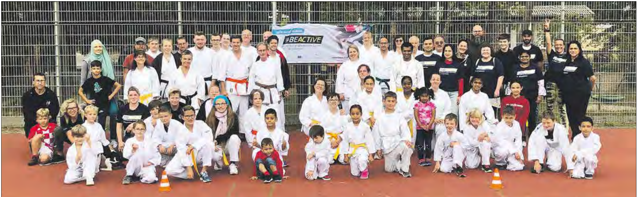
DIE KARATEABTEILUNG des TV 1893 Seeheim e.V.