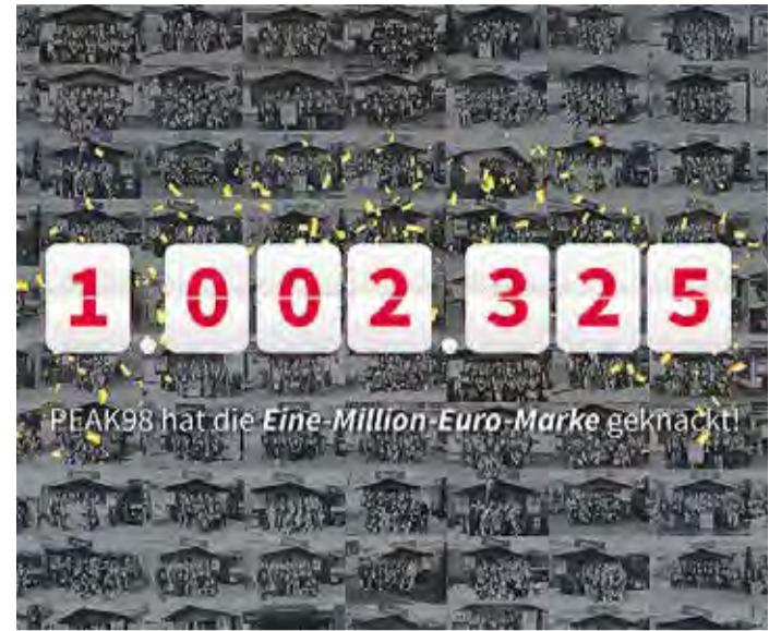
PEAK98 hat die Eine-Million-Euro-Marke geknackt!