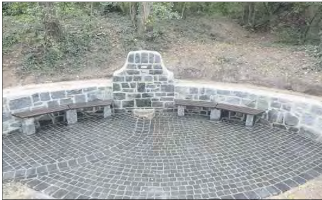
SCHÖN GEWORDEN ist der Eysenbachbrunnen in Eberstadt nach seiner Restaurierung. Am 8. Oktober um 15 Uhr erfährt der Brunnen seine feierliche „Neu-Einweihung“. (Zum Bericht)