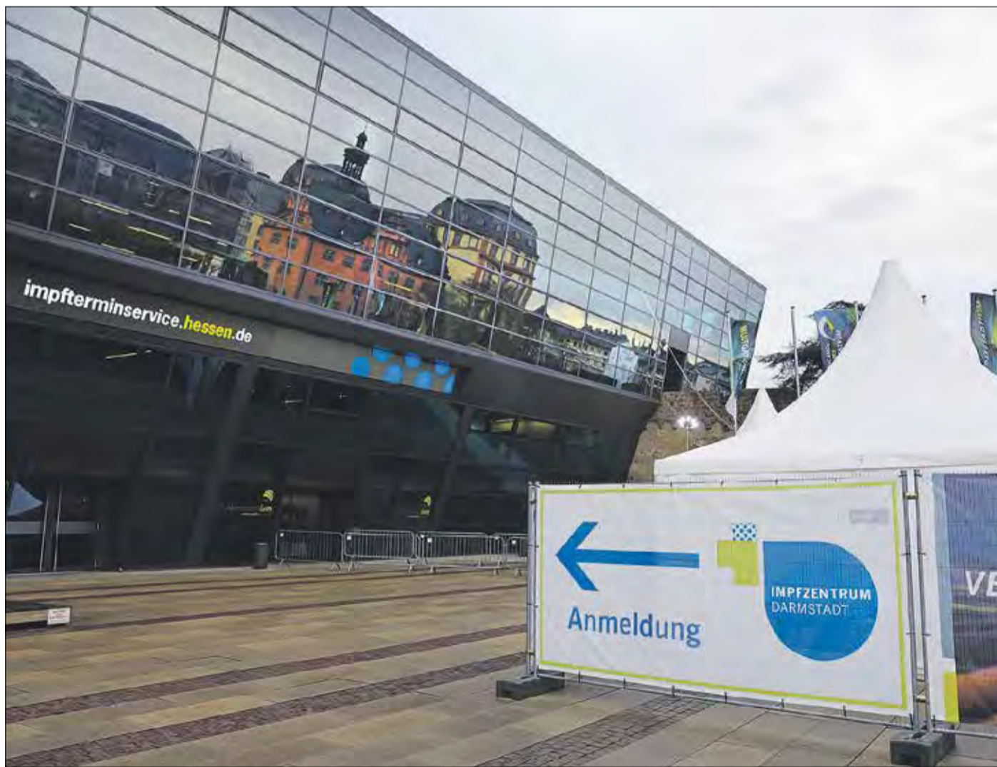
DAS DARMSTÄDTER IMPFZENTRUM beendet seinen Betrieb, wer zukünftig geimpft werden will, muss in die Impfabulanz beim Gesundheitsamt.

Oberbürgermeister Jochen Partsch zieht vor diesem Hintergrund ein durchweg positives Fazit und verweist auf die nach wie vor bestehende Wichtigkeit des Impfens: „Ich möchte mich bei allen Mitarbeiterinnen und Mitarbeitern des Impfzentrums sowie allen weiteren Beteiligten für den professionellen und vorbildhaften Einsatz bedanken. Ohne ihre tägliche Arbeit und Unterstützung wäre die breitflächige Durchführung der dringend notwendigen Impfungen nicht möglich gewesen. Mit den in Darmstadt durchgeführten Impfungen haben wir unseren wichtigen Anteil für die großflächige Immunisierung der Bevölkerung in Hessen geleistet, haben wir verhindert, dass Menschen schwer erkranken oder gar sterben. Auf diese Leistung können wir alle miteinander stolz sein. Wir werden auch nach der Schließung der Impfzentren ein gutes Netz an Impfangeboten haben, so dass jede und jeder die Möglichkeit hat, sich so schnell wie möglich