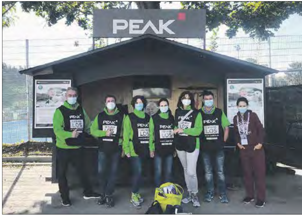
BEI HEIMSPIELEN können Lilien-Fans Lose am PEAK-Stand kaufen.

Beim Heimspiel des SV Darmstadt 98 gegen Dynamo Dresden war es so weit: Mit den Erlösen aus Losverkauf sowie den Punkt- und Torprämien von Verein und Unternehmen im Gesamtwert von 4.604,71 Euro übersprang die PEAK-Spendenaktion die Marke von einer Million Euro. Gesammelt wird seit der Saison 2014/15 vor allem rund um die Spiele des SV Darmstadt 98, aber auch bei Golfturnieren, Benefizkonzerten oder Theateraufführungen – insgesamt bei rund 170 verschiedenen Anlässen. Das Geld geht an verschiedene soziale Organisationen in der Region. „Wir sind stolz, dass wir über die