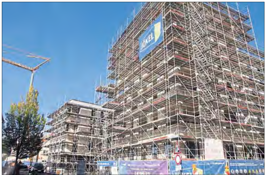
Im Frühjahr 2023 ist das Obertor-Center fertiggestellt.