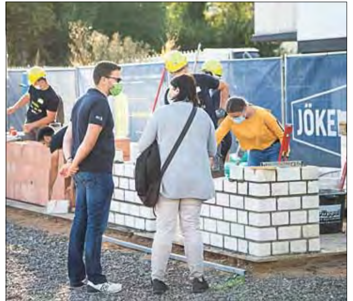
Das Bauunternehmen Jökel hatte verschiedene Stationen aufgebaut, an denen die Schülerinnen und Schüler selbst Hand anlegen konnten.