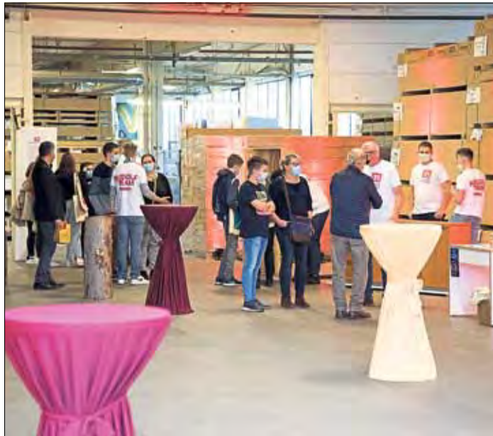
Bei Möbel Rudolf hatten die Jugendlichen die Gelegenheit, sich gründlich zu informieren und sogar in die Produktionsabläufe hineinzuschnuppern.

Wallroth, Sannerz, Ulmbach, im September 2021