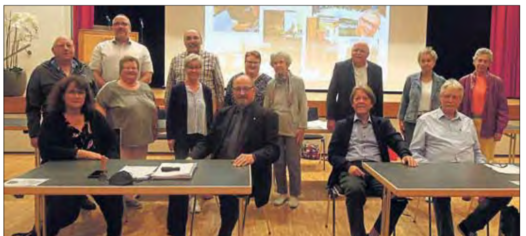
Der neu gewählte Vorstand des Gesangverein Liederkrantz.