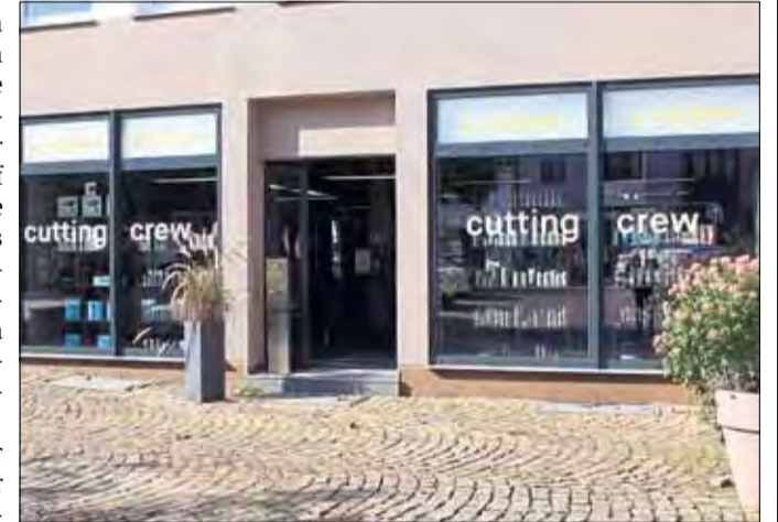
Der Friseursalon Cutting Crew hat neuerdings am Schlüchterner Stadtplatz seinen Standort.