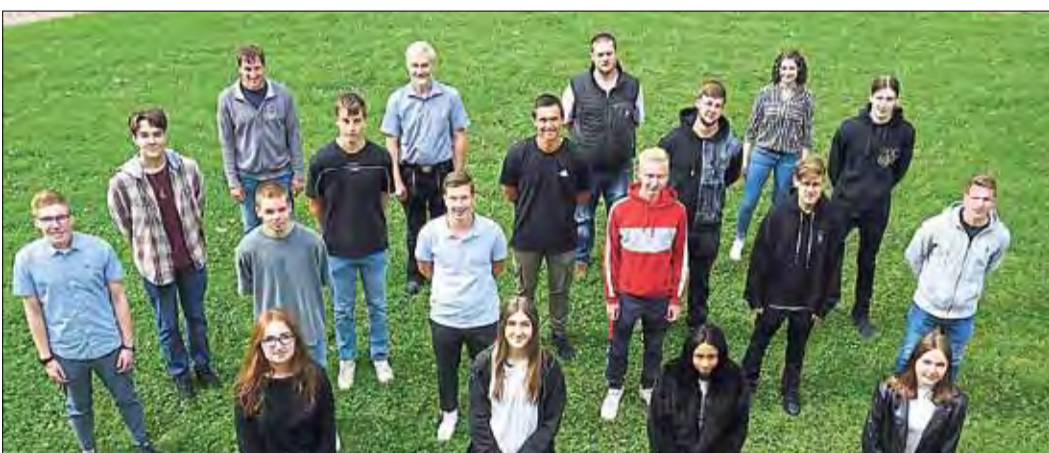
Rekordjahr: Die meisten der Berufsanfänger starten ihre Ausbildung bei Bien-Zenker mit einem Rundgang durch alle Abteilungen.

Für das Ausbildungsjahr 2022 laufen die Ausschreibungen bereits. Interessenten, die im kommenden Jahr ihre Ausbildung beginnen und Hausbauräume wahr werden lassen möchten, bewerben sich am besten jetzt schon für ihren Traumjob bei Bien-Zenker.