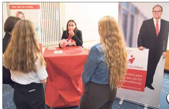
Die Kreissparkasse Schlüchtern gehört zu den ursprünglichen Ideengebern von JESI, die den Fokus auf das Angebot an lokalen Ausbildungsplätzen legen.

Die Anmeldung ist möglich bei larissa.gessner@ekkw.de. Das Anmeldeformular gibt es unter www.kirchenkreisjugend.de.