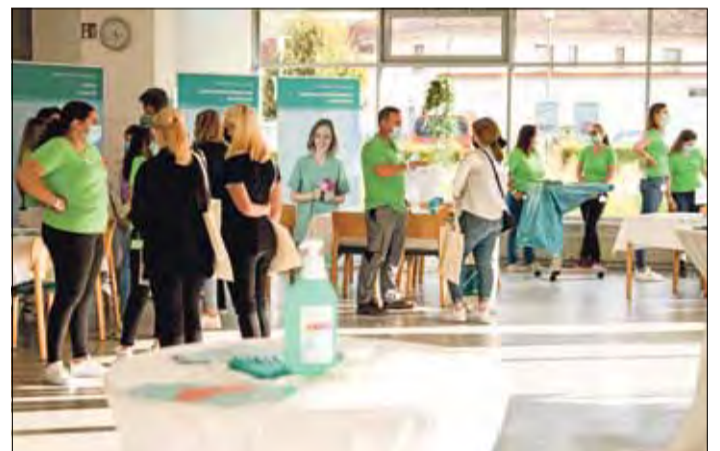
Vielfältig sind die Ausbildungsmöglichkeiten an den Main-Kinzig-Kliniken in Gelnhausen und Schlüchtern. Sie reichen von dem Beruf des Kochs bis hin zu Berufen in der Pflege.