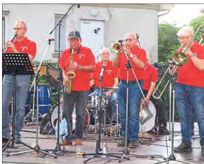
Die Dixie Oldies verströmen bei jedem ihrer Auftritte positive Energie und gute Laune.