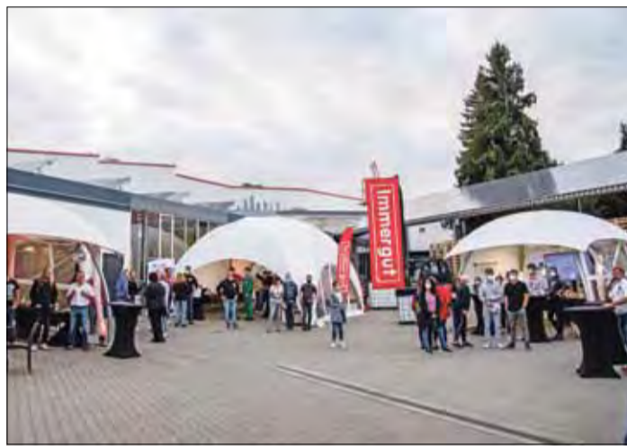
Das Lebensmittelunternehmen Immergut hatte ebenfalls seine Pforten zur Nacht der Ausbildung geöffnet.

internationalen Lebensmittelanbieter von Edeka Habig als auch beim Produkttasting des Unternehmens Immergut gewinnen. Auch mit dem kostenlosem Shuttleservice und der Verlosung eines E-Scooters konnte das Veranstalterteam bei den Gästen punkten.