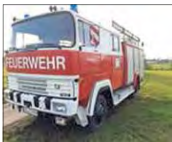
Dieses historische Feuerwehrauto ist bereits 40 Jahre alt.

Es haben sich bisher 17 historische Feuerwehrfahrzeuge zur Geburtstagsfeier angemeldet. Diese werden zwischen 11 und 12.30 Uhr in Lenzis, am Ringweg, zum