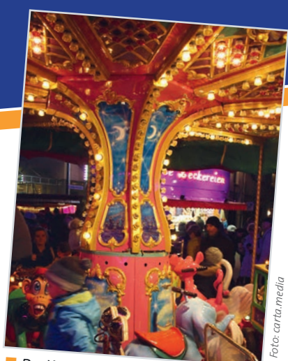
Der Weihnachtsmarkt am Landgrafplatz lockt mit mehr als 30 Anbietern

Die Weihnachtszeit kann man in diesem Jahr in Friedrichsdorf wieder so richtig genießen. Machen Sie sich auf: Es gibt in der Adventszeit für Kinder und Erwachsene viel zu entdecken. Unentgeltlich parken kann man in Friedrichsdorf auch!