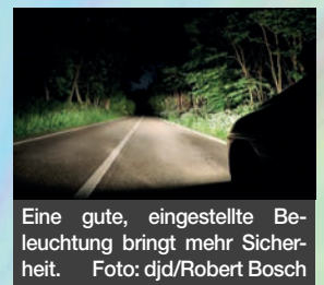
Eine gute, eingestellte Beleuchtung bringt mehr Sicherheit.

mit einem Fahrzeug-Check möglichen Pannen und Problemen vorzubeugen. Altersschwache Batterien gehören ebenso erneuert wie Scheibenwischer, die Schlieren auf der Windschutzscheibe hinterlassen. Wenn die Scheiben oft von innen beschlagen, kann ein Austausch des Innenraumfilters notwendig sein. Unter www.boschcar-service.com/de/de gibt es