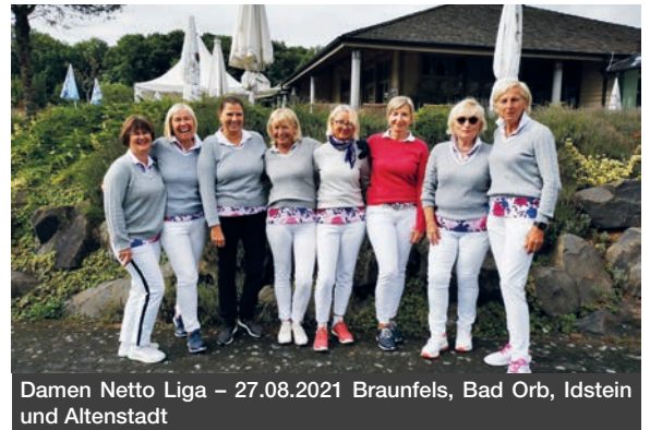
Damen Netto Liga – 27.08.2021 Braunfels, Bad Orb, Idstein und Altenstadt

Das Team konnte einen ausgezeichneten 2. Platz erspielen und verfehlte mit nur 2 Punkten Rückstand den Sieg in Altenstadt. Auch in der Tabelle der 2. Liga wurde es im Saisonergebnis ein 2. Platz was einen sicheren Klassenerhalt bedeutet. Bei widrigen Wetterverhältnissen aber leckerer Rundenverpflegung, die ein vielfaches