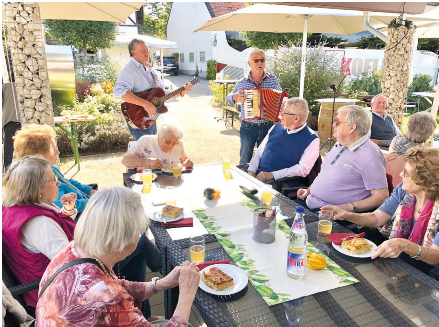
Weingut Schittler & Becker - Zornheim

(rgh) Auf dem Programm der Erzhäuser Senioren-Union der CDU stand geschrieben – Ausflug zum Weingut Schittler & Becker per Bus nach Zornheim (Rheinland-Pfalz) am 23. September, Abfahrt um 14:30 Uhr ab Hessenplatz.