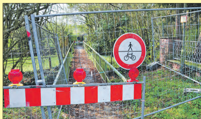
DAUERSPERRUNG. Die Rad- und Fußwegbrücken über den Mühlgraben und die Modau sind seit Jahren gesperrt. Der „Lokalanzeiger“ berichtete bereits in seiner Ausgabe vom 18. April 2019 ausführlich über den desolaten Zustand der Übergänge. Doch nun gibt es Hoffnung für einen Neubau.

wir hatten in unserer Ausgabe vom 9. Oktober den Artikel über die Erneuerung der beiden Fuß- und Radwegbrücken über die Modau veröffentlicht. Hierbei wurde bei der Bildunterschrift anstatt des Textes versehentlich ein Sammelsurium von mehreren Fragezeichen abgedruckt. Diese haben wir nun für Sie durch „Buchstaben“ in die richtige Textform gebracht. Wir bitten, diese „fragwürdige“ Darstellung zu entschuldigen.