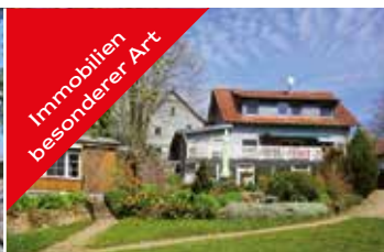
Immobilien besonderer Art