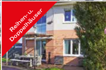
Reihen- u. Doppelhäuser