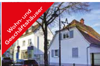
Wohn- und Geschäfts- häuser