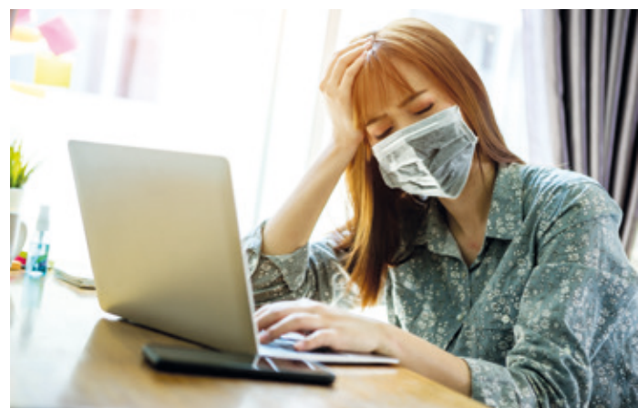
Seelische und körperliche Belastungen können eine regelrechte Erschöpfungsspirale auslösen. Abhilfe ist möglich dank einer ärztlichen Aufbaukur mit B-Vitaminen.

(WLM) Das Dauerfeuer ängstiger Nachrichten, der erzwungene Rückzug ins Private sowie ein weitgehender Wegfall persönlicher Kontakte hinterlassen seelische und körperliche Spuren. Zudem: Schon seit Jahren brauchen Menschen immer länger, um nach Infektionen mit Grippe- oder Erkältungsviren wieder fit zu werden. Um trotzdem nicht in eine Abwärtsspirale aus seelischer Belastung und körperlicher Erschöpfung zu geraten, kommt einer von Ärzten oder Heilpraktikern verabreichten Injektionskur mit den Vitaminen B6, B12 und Folsäure immer größere Bedeutung zu. Schon während der letzten Wellen grippaler Infekte und Infektionen mit echten Grippeviren war festzustellen, wie sich die „Rekonvaleszenz-Zeit“, die Zeitspanne bis zur völligen Genesung, immer weiter verlängerte. Doch es sind ja nicht nur die direkten körperlichen Folgen grassierender Infektionen – auch seelische Aspekte machen einer immer größeren Zahl von Menschen zu