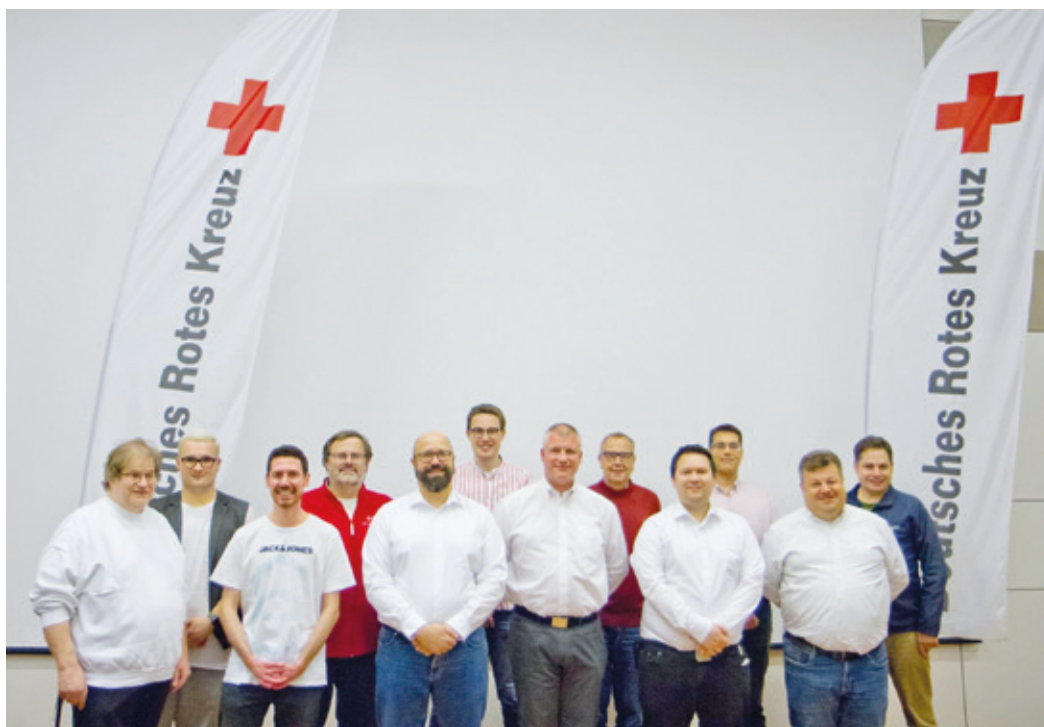
Neuer Vorstand des DRK Arheilgen-Wixhausen (Bild wurde unter 2G Bedingungen gemacht)