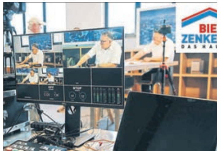
Mit dem innovativen Live-Stream schuf Bien-Zenker ein Informationsangebot, das es so in der Branche vorher nicht gab.

Draht zu ihren Bien-Zenker Ansprechpartnern. „Der digitale Hausbau-Infotag war als kurzfristiger Ersatz für den ausgefallenen Tag der offenen Tür gedacht. Über ein Konzept dazu hatten wir zwar schon vorher gesprochen, aber durch die Entwicklungen im Frühjahr haben wir die Umsetzung des Live-Streams forciert. Die Beiträge dafür, genauso wie die Infrastruktur für die Sendung, wurden in Rekord-