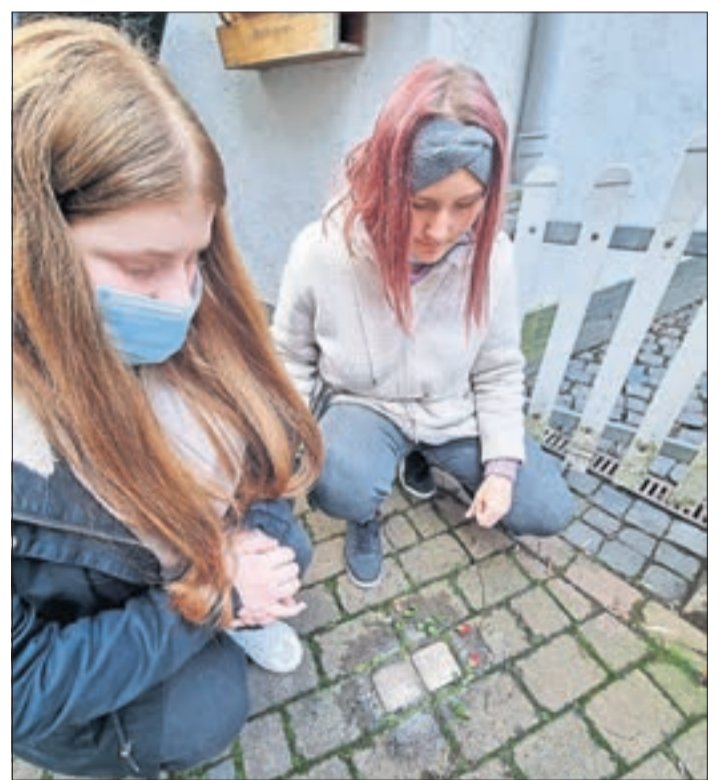
Polierte Stolpersteine und Rosen für ehemalige Salmünsterer Mitbürgerinnen und -bürger.

„Doch nicht nur jüdische Bürgerinnen und Bürger Salmünsters wurden deportiert und um-