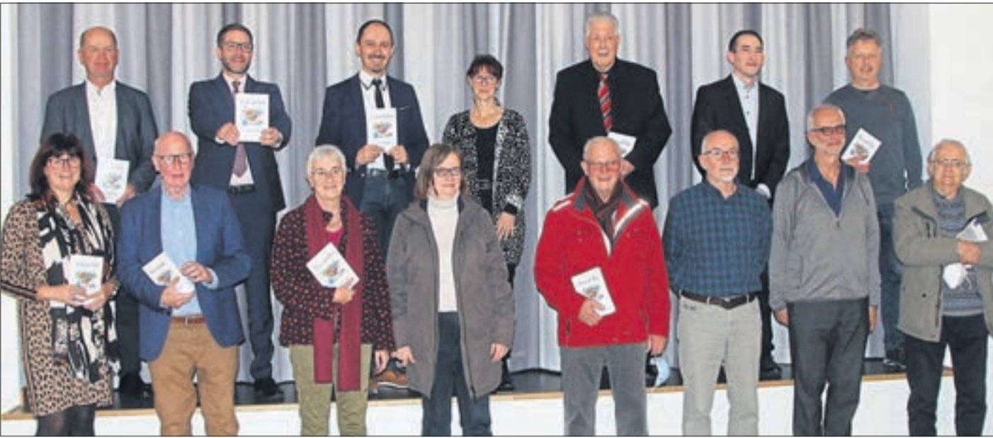
Gruppenfoto mit den Autoren des Heimatkalenders 2022.