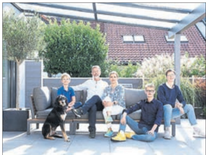
Bien-Zenker Bauherren hatten dank vorausschauender Terminplanung immer volle Terminalsicherheit.

SIE HABEN FRAGEN? Wir beraten Sie gern. Telefon 06655 / 9652-0 www.reisebuero-happ.de info@reisebuero-happ.de