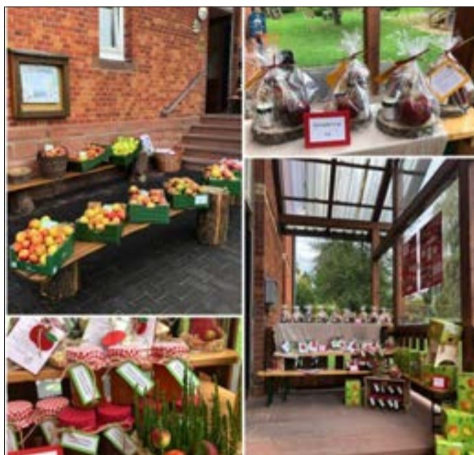
Äpfel, Bratäpfel to Go, Apfelsaft, Gelees und Apfelmus – all das wurde von hübsch dekoriert und verpackt angeboten.

Einladend und hübsch anzusehen empfing der Markt schließlich die Eltern vor dem Eingang der KITA. „Wir waren schnell gut ausverkauft“, berichten Stefanie Röder und Julia Schnarr. Und rasch war die Idee geboren: Wir gehen mit unseren Apfelprodukten auf den Wochenmarkt am Kumpen! Dazu musste allerdings die Produktion wieder angekurbelt werden und das übernahmen die Erzieherinnen übers Wochenende