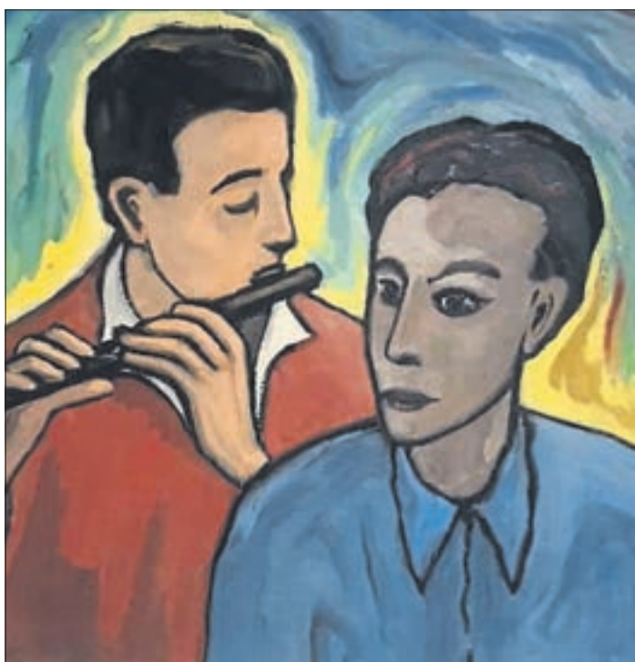
Eines der gezeigten Werke von Willy Tripp in der Ausstellung im Museum Brüder-Grimm-Haus.