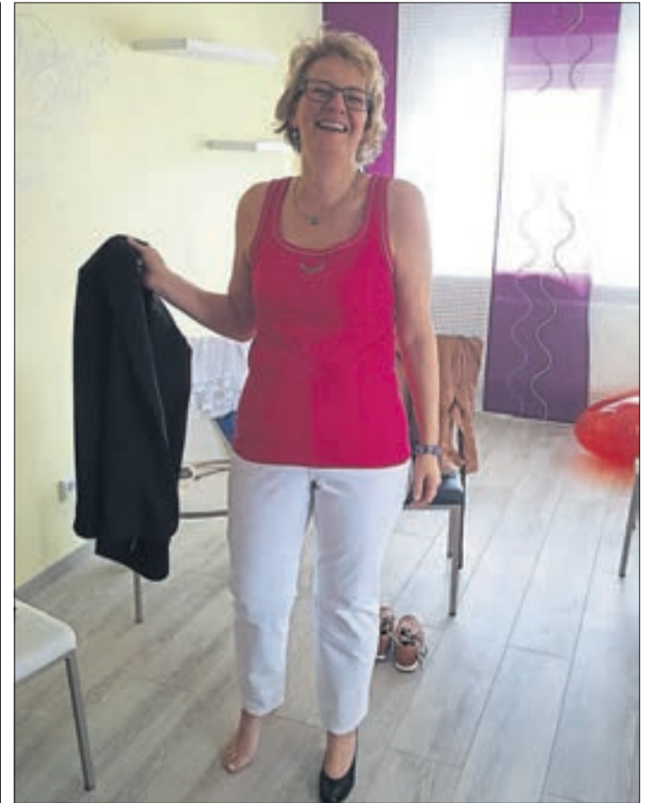
Während der Stabilisierungsphase im Juli 2016 gab es zur weiteren Motivation ein Fotoshooting von einer namhaften Frauenzeitschrift.