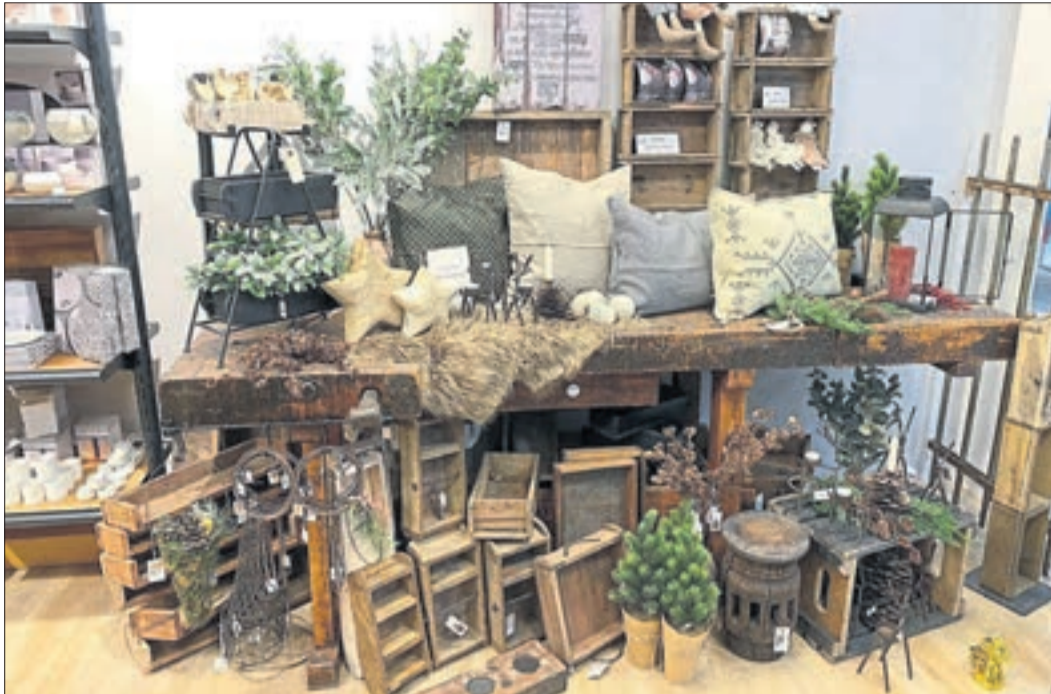
Geschmackvolle Geschenkartikel in einer großen Auswahl und von namhaften Lieferanten finden die Kunden bei Paperoffice & more in Wächtersbach.