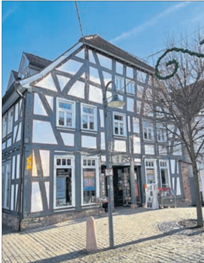
In den neu gestalteten Geschäftsräumen im Fachwerkhaus in der Frankfurter Straße 20 in Salmünster findet nun das gesamte Sortiment von Beisler Platz.