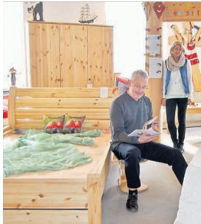
Bei Wohngesund in Bad Brückenau findet der Kunde unbehandelte Naturholzmöbel mit einer wohnlich behaglichen Ausstrahlung.

Kontakt: Wohngesund Kirchplatz 1 Bad Brückenau Telefon (09741) 727 www.wohn-gesund.com