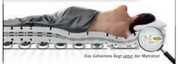
Das Geheimnis liegt unter der Matratze!

Viele Rückenschmerzen lassen sich vermeiden!®