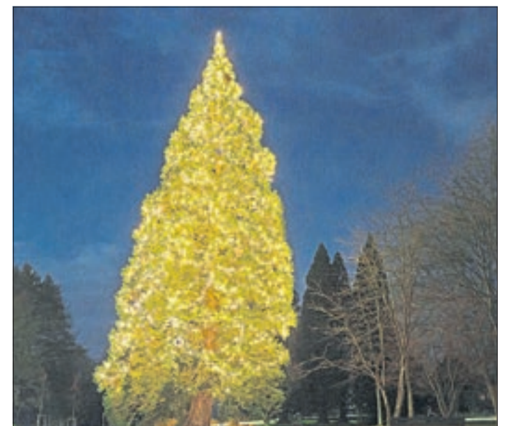
12.000 Lichter und der Schmuck der Kindergartenkinder lassen den Mammutbaum im Kurpark erstrahlen.