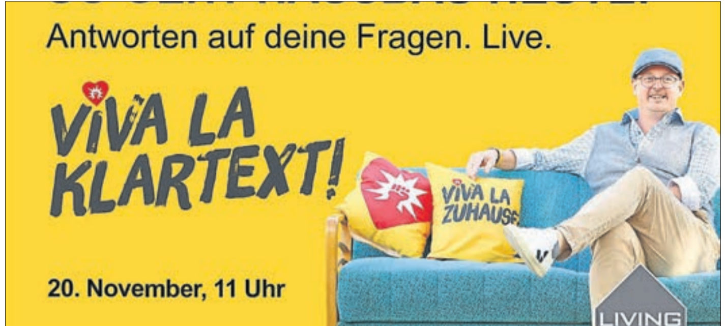
Extra lang. Extra informativ: „Viva la Klartext!“ am 20. November, ab 11 Uhr live aus dem Bauhaus in Dessau.