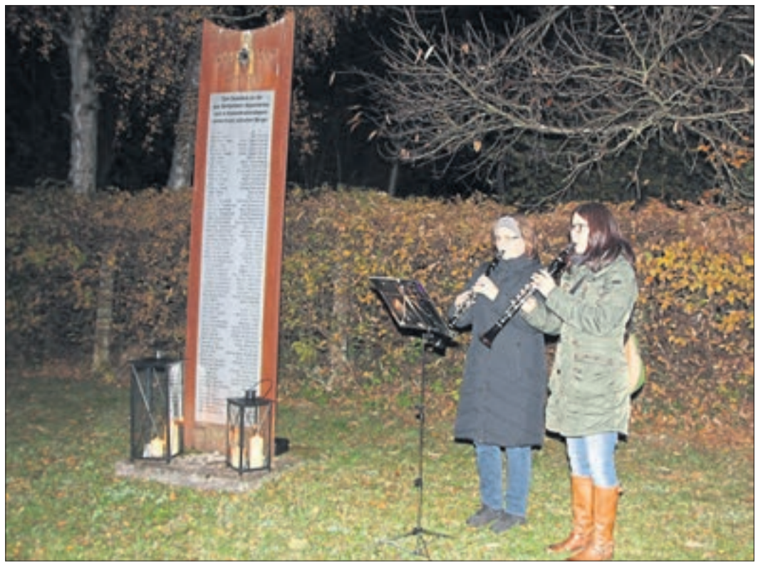
Die Gedenkfeier auf dem jüdischen Friedhof umrahmten die Klarinetistinnen Sabine Rau und Angelika Hahn mit klagenden Klezmer-Klängen.