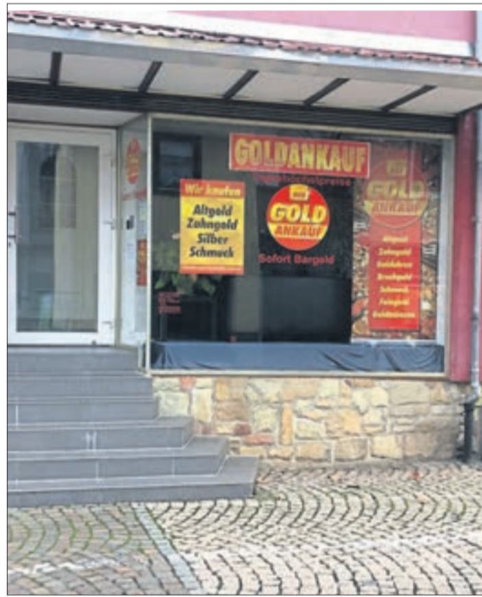
Seit zehn Jahren ist der Goldankauf in der Nähe des Rathauses am Stadtplatz in Schlüchtern ansässig.