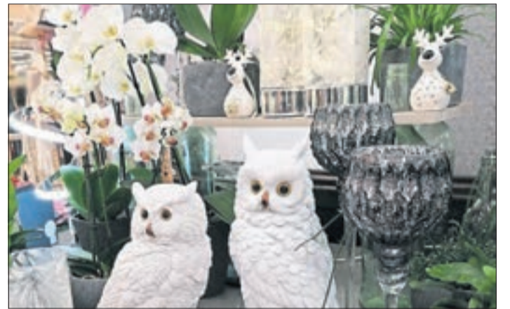
Weihnachtliche Dekorationen gibt es ab kommendem Samstag bei „Uschis Blütenzauber“ zu sehen.