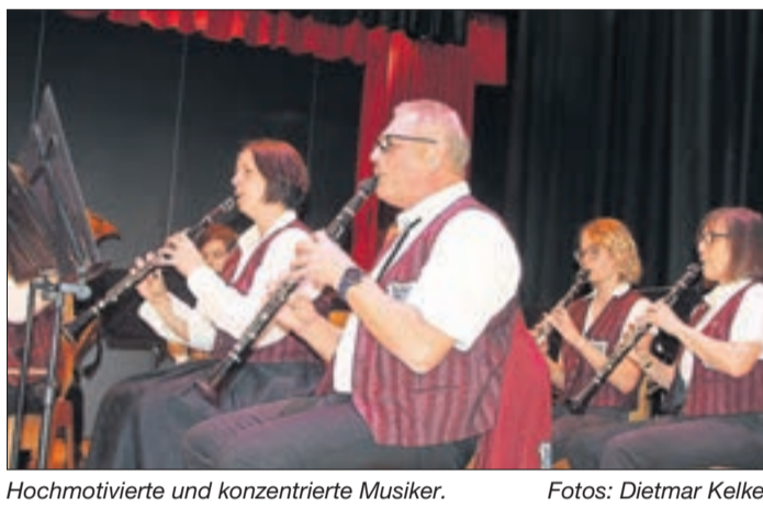
Hochmotivierte und konzentrierte Musiker.