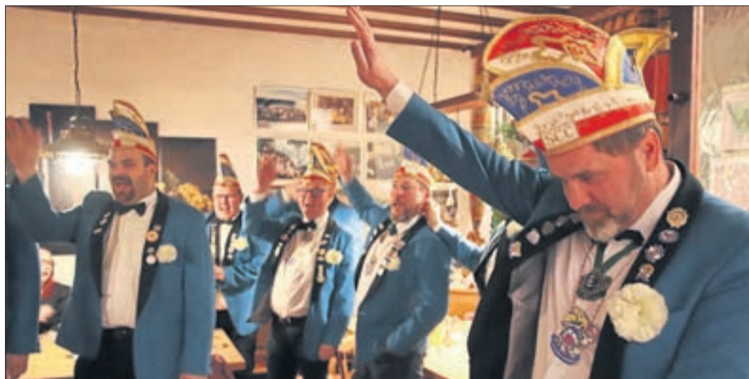
Gemeinsam setzten die Schlüchterner Elferräte zum Auftakt der neuen Faschingskampagne ihre Narren-Kappen auf und sprachen den Narren-Eid.

Um auch in Corona-Zeiten einen sicheren Verlauf der Auftakt-Veranstaltung zu gewährleisten, galt an dem Abend die 2G-Regel. Zusätzlich hatte jeder Gast vorher einen Schnelltest gemacht.