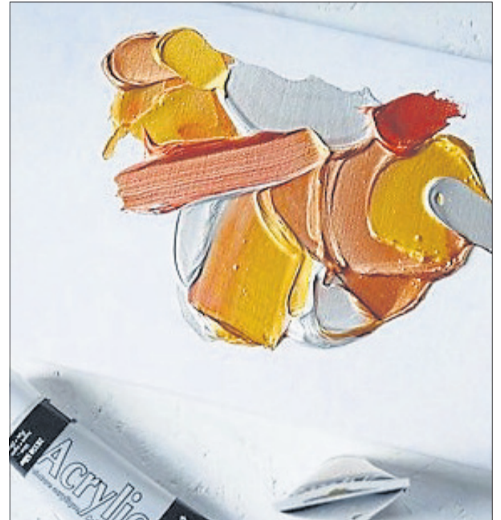
Die hochpigmentierte Acrylfarbe von Kreul verleiht Kunstwerken einen stilvollen Touch. Es gibt sie in der Kreativwelt in Schlüchtern.

SCHLÜCHTERN (BWB). Die Planemächer Schlüchtern laden für Samstag, 20. November, um 18 Uhr zur Jahreshauptversammlung in der Stadthalle ein. Auf der Tagesordnung stehen auch Vorstandswahlen. Anschließend ist eine Nikolausfeier. Es gelten die aktuellen Corona-Bestimmungen.