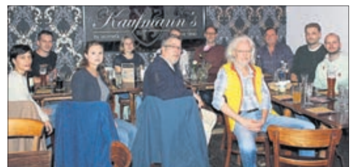
Mittlerweile nehmen sieben Medizinerinnen und Mediziner an der Weiterbildung teil. Vor wenigen Tagen trafen sie sich in lockerer Runde zu einem ersten Kennenlernen mit Impulsvortrag.

www.verbund-weiterbildung-allgemeinmedizin.de