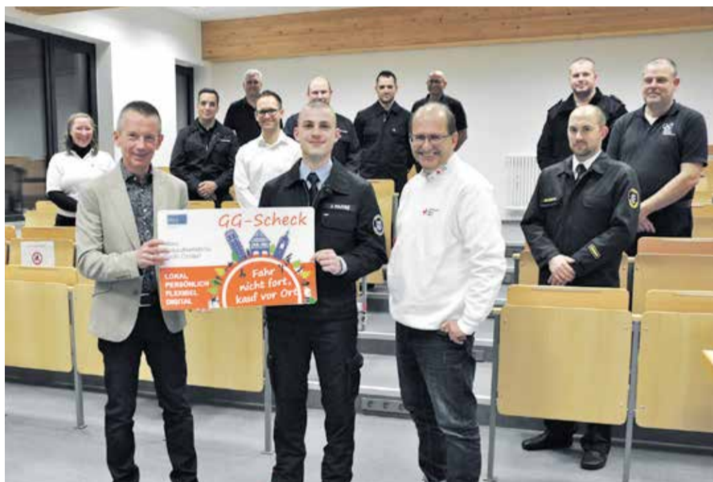
Landrat Thomas Will dankt den Einsatzkräften aus dem Kreis, die nach der Flutkatastrophe in Erfstadt und im Ahrtal als Helfer*innen mit dabei waren, mit einem Danke-Brief und einem Groß-Gerau Scheck.

Kreis Groß-Gerau – „Ihnen braucht niemand zu sagen, was es heißt, einsatzbereit zu sein“ – mit diesen Worten hat Landrat Thomas Will Mitgliedern des Katastrophenschutzes des Kreises Groß-Gerau für ihren Einsatz in den Hochwassergebieten in Rheinland-Pfalz und Nordrhein-Westfalen gedankt. „Sie haben Zivilcourage, Mut und Selbstlosigkeit gezeigt und bewiesen: Solidarität und Hilfsbereitschaft werden in unserem Land gelebt.“