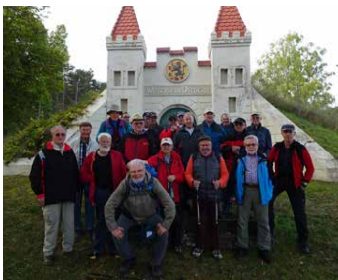
Gruppenfoto vor dem imposanten Wasserwerkseingang.

Groß-Gerau - Noch am Ankunftstag gingen die 22 OWK'ler aufwärts zur Burgruine Lichtenburg. Nach der Stärkung im Burghotel bestieg ein Teil den Bergfried: herrliche Aussicht auf die Rhön. Der Rückweg ließ sie in ein Nandu-Gehege und auf ein Großkreuz einer Anhöhe blicken.