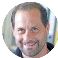
Peter Erbach Autohaus Iser Riedstadt