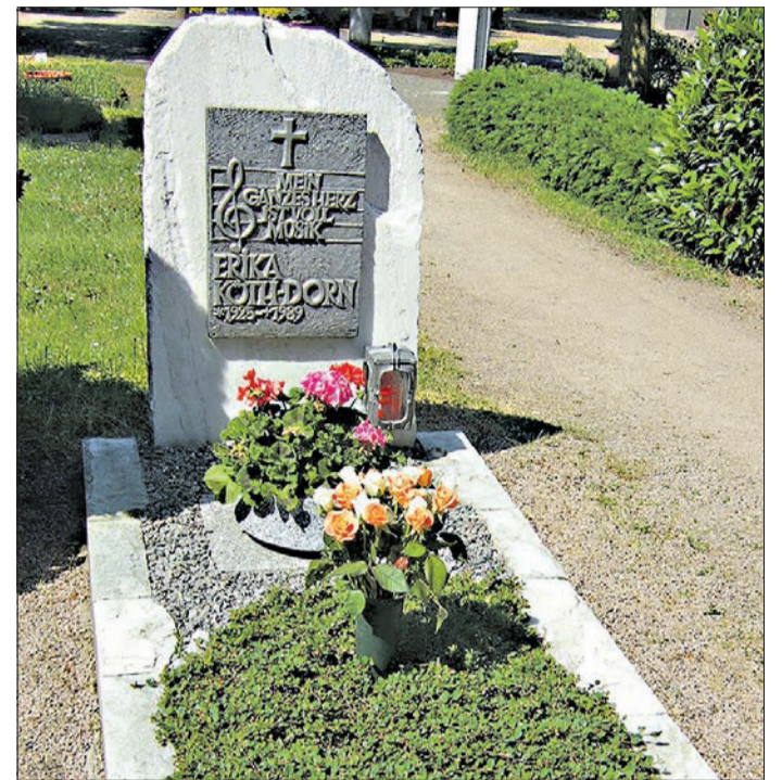
DIE GRABSTÄTTE von Erika Köth auf dem Alten Friedhof. (Zum Bericht)