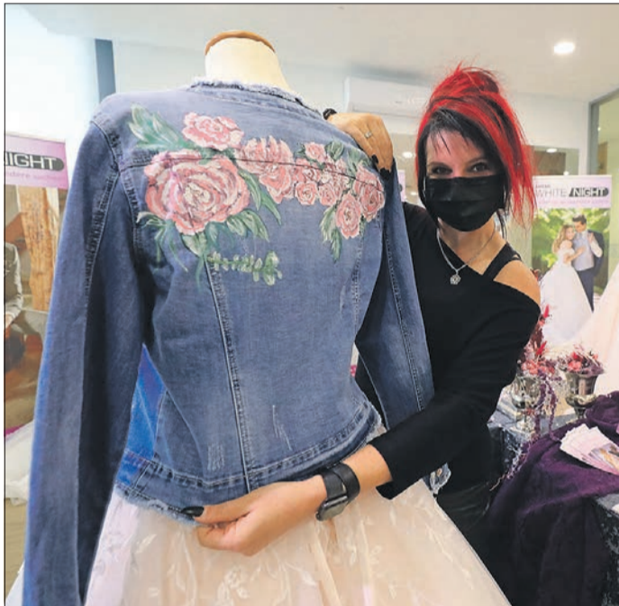
EXCLUSIVE MODE und Accessoires rund ums Heiraten wurde sehr charmant präsentiert.