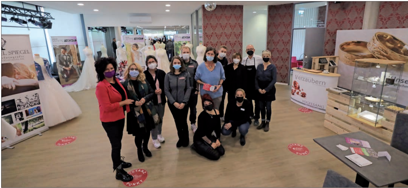
GRUPPENBILD MIT (DREI) HERREN. Die Veranstalter waren sehr zufrieden mit der Resonanz zur Hochzeitsmesse am vergangenen Wochenende im „Das Stroh“ an der Eberstädter Wartehalle. (Zum Bericht)

EBERSTADT – Am vergangenen Sonntag hieß es „Alles für Euren Tag“ – es wird wieder gefeiert.