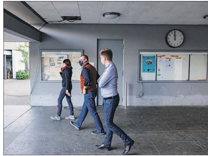
SCHULLEITUNGEN der Gutenbergschule und Boeselager Realschule mit Schuluhr. Das Hochwasser erreichte die Höhe der Uhr.

Mit großer Begeisterung haben die SchülerInnen aufgebaut, abgebaut, gehandelt, gebacken, gegrillt, gespielt, verlost, gegessen, gescherzt, gelacht, verkauft und selber auch eingekauft. Es herrschte den ganzen Vormittag über eine sehr gute Atmosphäre.