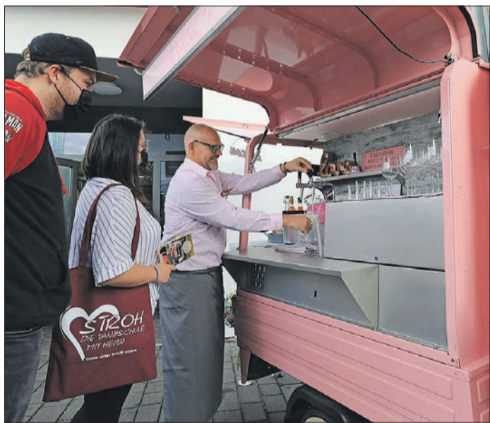
ERSTMAL ANKOMMEN. Herzliche Begrüßung mit einem Prosecco am Eingang zur Hochzeitsmesse.

Motto Sternenzauber in Eberstadt geben. In Hütten werden Leckereien und Getränken angeboten. Sollte es die Corona Situation zulassen, überrascht der Nikolaus die kleinen Besucher und es ist ein Konzert für Kinder bei der Tanzschule „Das Stroh“ geplant. (ng)