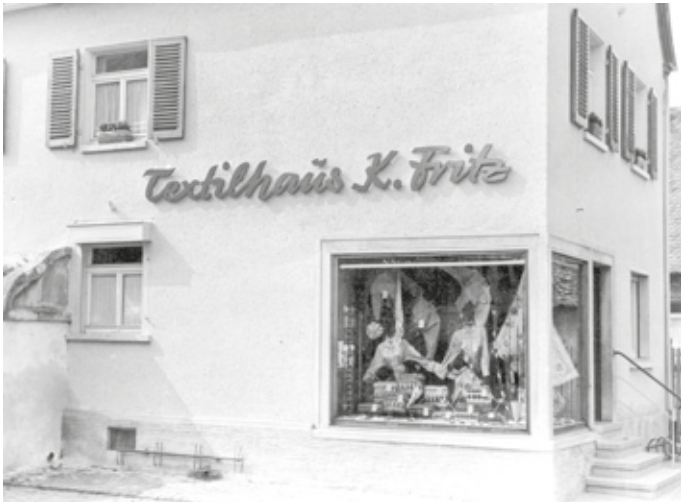
Das Textilgeschäft in der Bahnstraße („Gässelche“)

(gw) Nachdem das neue Buch des Ortskundlichen Arbeitskreises (OAK) „Verschwundene Orte“ erschienen und in kürzester Zeit ausverkauft war, hatten sich viele Erzhäuser mit Ergänzungen und Anregungen zu dem Buch gemeldet. Ein Beispiel dafür ist das ehemalige Textilhaus Käthe Fritz („Fritze Käthche“) in der Bahnstraße („Gässelche“). Im Buch ist unter anderem dieses Foto zu sehen: