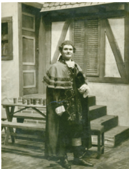
Als Wilhelm Meister in Mignon 1948 in Trier.