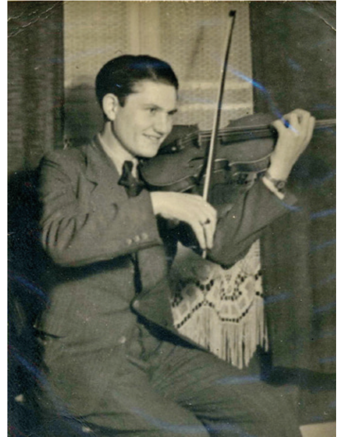
Sein eigentlicher Berufswunsch war Geiger gewesen

Schon als 10- und 12-jähriger Junge stand er in Wixhausen bei Vereinen auf der Bühne, spielte die Geige und sang. Vor seiner Militärzeit stand er in den Reihen des Gesangsvereins Sängerkunst. Nach seiner Rückkehr aus der Gefangenschaft im Dezember 1945 nahm er sein Gesangsstudium bei Frau Horn-Stoll wieder auf. Im Jahre 1946 ging er als lyrischer Tenor an das Staatstheater in Trier, 1950 wechselte er nach Heidelberg. Von da an begann seine eigentliche Karriere. Es folgten Zürich,