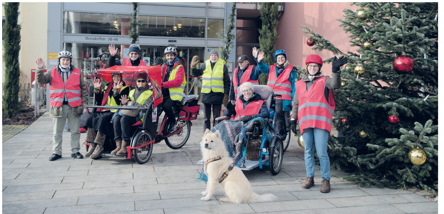
Unsere Aktiven in den neuen Schutzwesten vor dem Portal unseres 2. RoA Einrichtungs-Partners, dem Wohnpark Kranichstein beim Antrittsbesuch.

Die RoA-Pilot*innen und -Aktiven feiern Weihnacht und begrüßen den Wohnpark Kranichstein als weiteren Einrichtungs-Partner