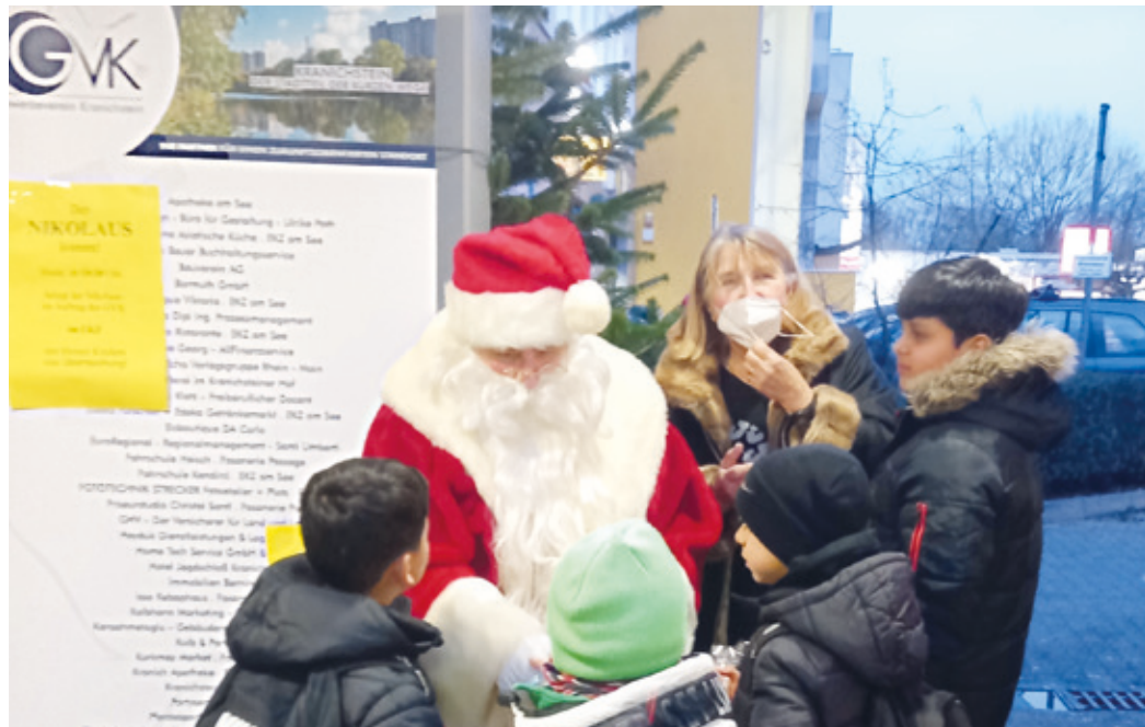
Nikolaus- und Adventsaktion des Gewerbeverein Kranichstein (GVK) im EKZ.