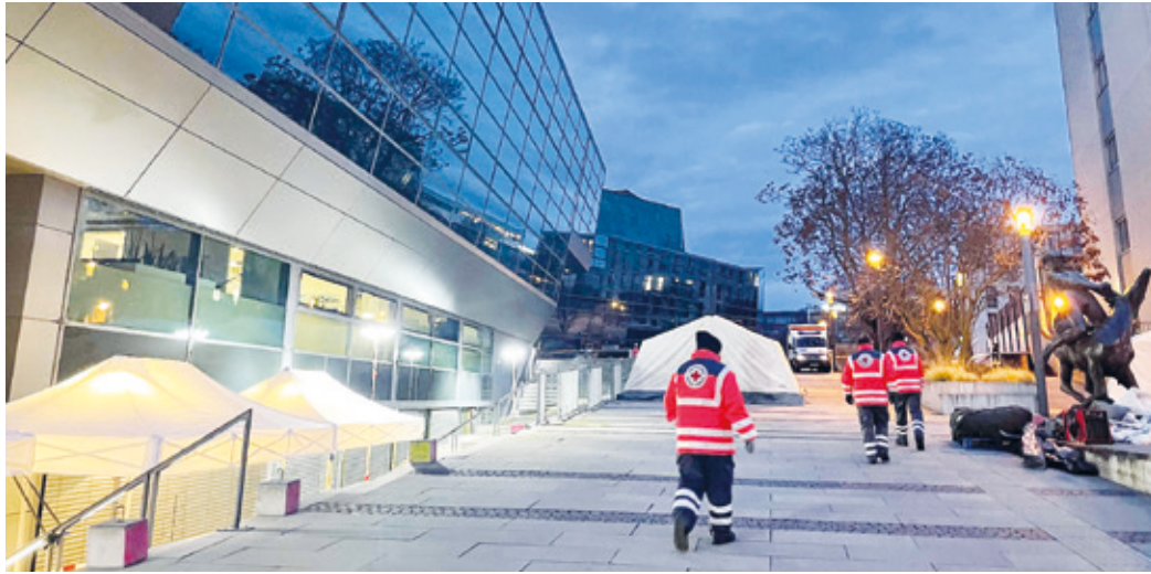
Am Freitagabend vor dem zweiten Adventswochenende haben rund 60 ehrenamtliche Einsatzkräfte des DRK Darmstadt, der Freiwilligen Feuerwehren Darmstadt, Darmstadt-Arheilgen und Darmstadt-Eberstadt am Darmstadtium unter Leitung der Feuerwehr Darmstadt Zelte aufgebaut.

(Darmstadt, DRK) Das DRK-Ehrenamt hilft, den Impffortschritt zu beschleunigen: Jeweils elf ehrenamtliche Einsatzkräfte des DRK-Kreisverbands Darmstadt-Stadt e.V. (DRK Darmstadt) – genauer aus den DRK-Ortsvereinen Arheilgen-Wixhausen, Eberstadt und Darmstadt-Mitte – unterstützen pro Dienst an den kommenden Adventswochenenden die Impfabulanz im Darmstadtium. Bereits am zweiten Adventswochenende konnten so rund 450 zusätzliche Impfungen in Darmstadt durchgeführt werden. „Die Pandemie verdeutlicht, wie wichtig die Leistung des Ehrenamts im Bevölkerungsschutz ist, und wie gut und planmäßig die Zusammenarbeit von Haupt- und Ehrenamt verläuft“, sagt Jürgen Frohnert, Kreisgeschäftsführer des DRK Darmstadt. Das bestätigt auch Daniel von Hauff, Geschäftsführer der DRK Rettungs- und Sozialdienste gGmbH, die im Auftrag der Wissenschaftsstadt Darmstadt und des Landkreises Darmstadt-Dieburg die Impfabulanz im Darmstadtium und das Impf-