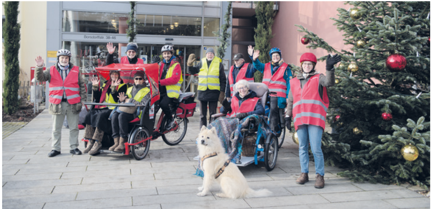
Unsere Aktiven in den neuen Schutzwesten vor dem Portal unseres 2. RoA Einrichtungs-Partners, dem Wohnpark Kranichstein beim Antrittsbesuch.

Die RoA-Pilot*innen und -Aktiven feiern Weihnacht und begrüßen den Wohnpark Kranichstein als weiteren Einrichtungs-Partner