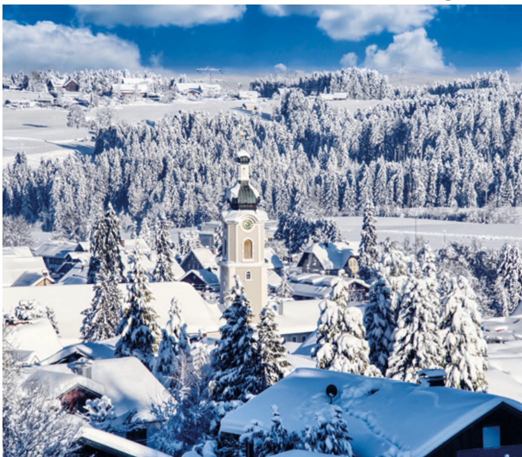
Scheidegg im Winter.

Liebe Erzhäuser*innen, ich wünsche Euch allen ein gesundes Jahr 2022 und möchte Euch Scheidegg in seiner Winterpracht zeigen, herrliche