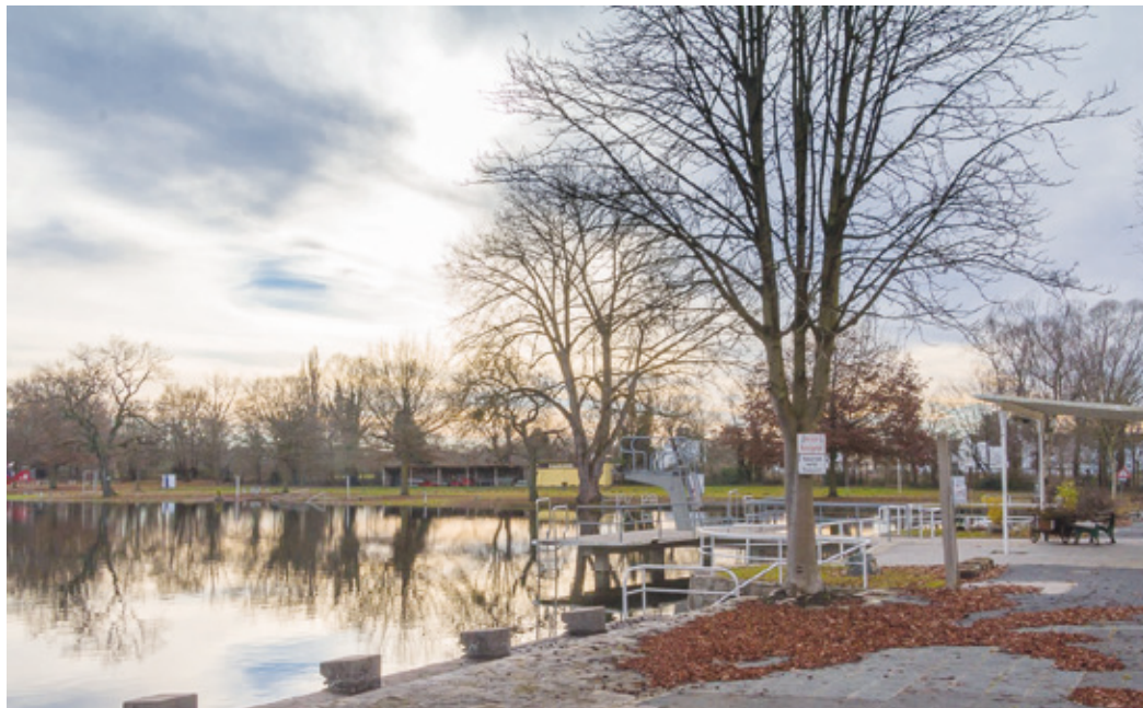
Das Arheilger Mülchen im Winter mit einem Silberstreif am Horizont.

(Arheilgen, MG) Die Stadtverordnetenversammlung hat im Rahmen der Haushaltsberatungen 300.000 Euro für die Entschlammung des Arheilger Mülchens beschlossen. Der Förderverein freut sich sehr, dass damit die schon lange erforderliche Entschlammung endlich in Aussicht ist. Für den Förderverein ist dies eine wichtige und dringende Maßnahme, um den Naturbadesees langfristig zu erhalten, und ein wichtiger Schritt, um die Wasserqualität im Mülchen zu verbessern. Denn in den letzten Jahren hatten sich die Tage gehäuft, an denen das Mülchen nicht für die Arheilgerinnen und Arheilger geöffnet werden konnte, was zu großen Teilen in Verbindung mit dem angehäuften Schlamm und seinen Auswirkungen auf die Wasserqualität stand. So wird z.B. im Schlamm Phosphat gebunden, der ein Nährstoff für Algen ist und deren Bildung begünstigt. In Gesprächen mit den städtischen Eigenbetriebe Bäder und auch in der öffentlichen Erklärung „Das Mülchen braucht Hilfe“ (2019) hatte der Verein mehrfach auf die Dringlichkeit und Bedeutung der Entschlammung hingewiesen. Wichtig ist zudem, dass diese Entschlammung großflächig vollzogen wird. Denn kleinere, halbherzige Entschlammungsmaßnahmen haben eine Vorgeschichte im Mülchen. Eine kleine Entschlammung im vorderen Bereich rund um den Sprungturm hatte der Förderverein vor einigen Jahren mit 15.000 Euro mitfinanziert – leider erfolgte die Durchführung nicht professionell genug, so