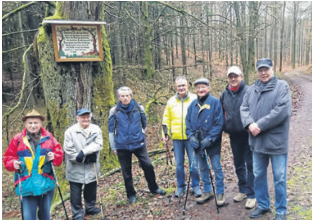
Die Mittwochsturner bewahren sich ihre Fitness bei Unternehmungen und Aktivitäten im Freien, etwa bei Tageswanderungen rund um Salmünster.