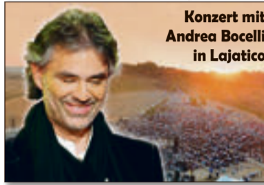
Konzert mit Andrea Bocelli in Lajatico

4. Tag: Kleiner Ausflug nach San Gimignano Abendessen auf einem Landweingut - Konzert mit Andrea Bocelli in Lajatico Nach dem Frühstückbuffet kleiner Ausflug durch das Chianti-Gebiet in die mittelalterliche Stadt San Gimignano . Danach Rückfahrt zum Hotel. Umziehen - frisch machen - kurze Pause. Fahrt auf ein uriges Landweingut . Hier nehmen wir vor der großen Aufführung ein frühes Abendessen in Form eines toskanischen Spezialitäten-Menüs mit speziellen Vorspeisen vom Bauernhof wie toskanische Salami, Käse, Bruschetta und toskanisches Crostino, Pastagericht. Dazu schmeckt ein Glas Rot- oder Weißwein aus eigener Produktion. Anschließend Fahrt nach Lajatico - Heimat und Geburtsort von Andrea