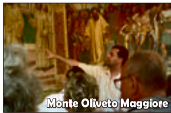
Monte Oliveto Maggiore

2. Tag: Modena - Florenz - Casino di Terra Nach dem Frühstückbuffet Weiterfahrt über Bologna und den Apennin nach Florenz . In der Stadt von Michelangelo und Dante fahren wir zuerst auf den Aussichtspunkt, den Piazzale Michelangelo, um Florenz als Panorama zu bewundern. Am Torre de la Zecca treffen wir unsere Stadtführung und erleben einen geführten Stadtrundgang durch die Altstadt von Florenz. Danach freie Verfügung bis zur Weiterfahrt durch die wunderschöne Landschaft der Toskana in unser exklusives Hotel in Casino di Terra . Es erwartet Sie ein uriges zum 4-Sterne Hotel umgebautes Landgut, im toskanischen Stil . Es besteht aus drei Gebäuden: die Mühle, die alte Mühle und Getreidespeicher. Alle Zimmer verfügen über Bad/DU/WC, Safe, Minibar, Klimaanlage / Heizung, Telefon, Sat-TV, Balkon oder Terrasse. Das Haus verfügt über ein Panoramarestaurant, Hotelbar, Gartenanlage und Park, schöner Außenpool (saisonal), Bar im Poolbereich, Solarium, Wellness Ruheraum, Sauna und Türkisches Bad. Zum Abendessen serviert man Ihnen ein leckeres 3-Gänge-Menü. Übernachtung.