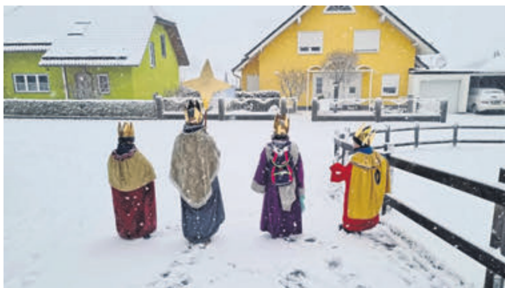
In einer winterlichen Schneelandschaft – hier im Stadtteil Wallroth – waren die Schlüchterner Sternsinger in diesem Jahr unterwegs.