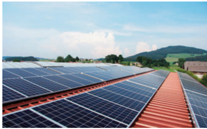
Auch im Odenwald machen PV-Anlagen Sinn.