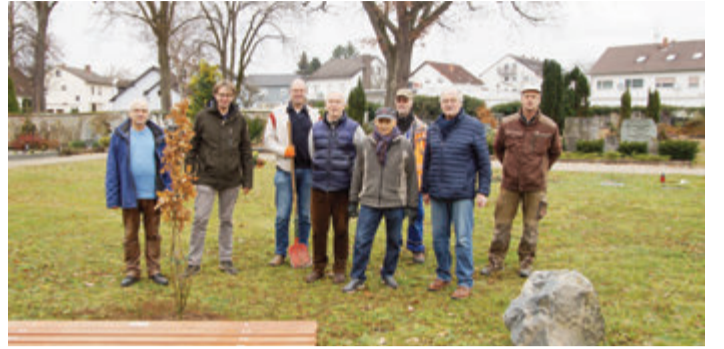
Das Rotary-Helferteam nach der Einrichtung der Gedenkstätte auf dem Babenhäuser Friedhof.