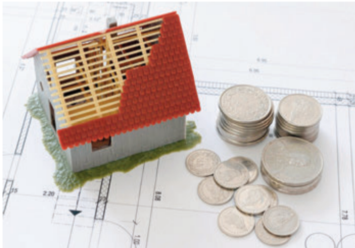
Auch im Alter lohnt sich Eigentum.

Müssen Zins und Tilgung noch aus den Alterseinkünften bedient werden, kann es knapp werden. „Deshalb sollten die über 50-jäh-