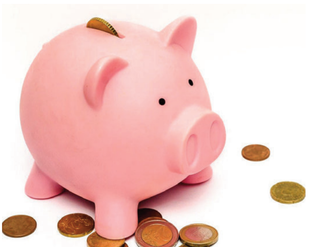
Zu wenig Eigenkapital steht dem Wunsch nach Wohneigentum entgegen. Die Chancen, ausreichend eigenes Geld in die Finanzierung einbringen zu können, müssen erweitert werden.

Im unteren Preissegment liegt der Eigenkapitalbedarf im bundesdurchschnittlich bei 80.000 Euro; damit lässt sich eine Immobilie für rund 270.000 Euro solide finanzieren. Allerdings haben nur zehn Prozent der potenziellen Ersterwerber entsprechendes Eigenkapital in