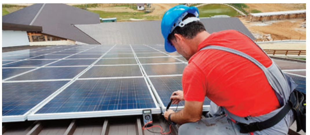
Mit dem richtigen Partner an der Seite klappt es auch mit der eigenen PV-Anlage.

Hier stellen sich Ihnen wahrscheinlich einige Fragen: Was ist