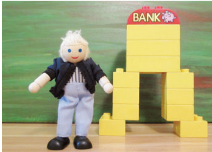
In höherem Alter noch Wohneigentum kaufen? Eine Altersgrenze für die Kreditvergabe dürfen Banken nicht ansetzen. Die Kreditwürdigkeit muss jedoch gegeben sein.

Doch die Generation 50plus hat auch ihre Vorteile. Sie verdient oft mehr als Jüngere und hat nach