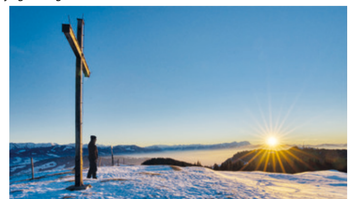
Hirschberg bei Sonnenuntergang.

Besonders das Schneeschuhwandern ist sehr beliebt. Hier ein kleines Video unter: https://www.youtube.com/watch?v=Or_g8y1gkXQ das meine Aktivitäten zeigt. Ein besonderer Tipp, eine Schneeschuhwanderung zum gut 1000m hohen Hirschberg. Bei Sonnenuntergang wird man mit einer traumhaften Sicht über das Rheintal im Nebel, das Appenzellerland mit dem Säntis, dem Altmann und den Kurfürsten, rechts der Pfänder, im schönsten Abendlicht belohnt! Für Fragen und Meinungen bin ich unter der E-Mail: fotodemmel@t-online.de erreichbar.