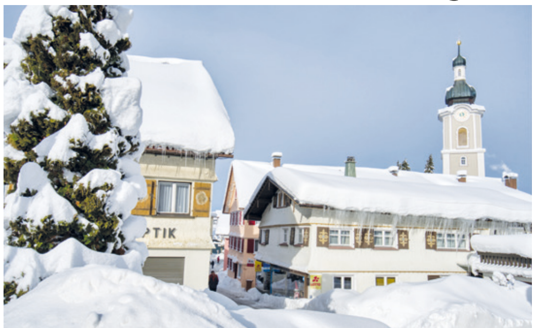
Scheidegg im Februar.

Liebe Erzhäuser*innen, heute möchte ich euch vom Scheidegger Wintersport berichten. Gespurte Loipen, Langlauf, Rodeln, auch eine kleine Skipiste werden gerne von Gästen und einheimischen genutzt.