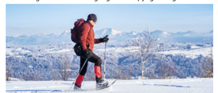
Edgar Demmel Schneeschuhwanderung.