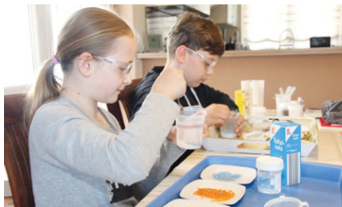
Begeisterung für Naturwissenschaften und Technik wecken.