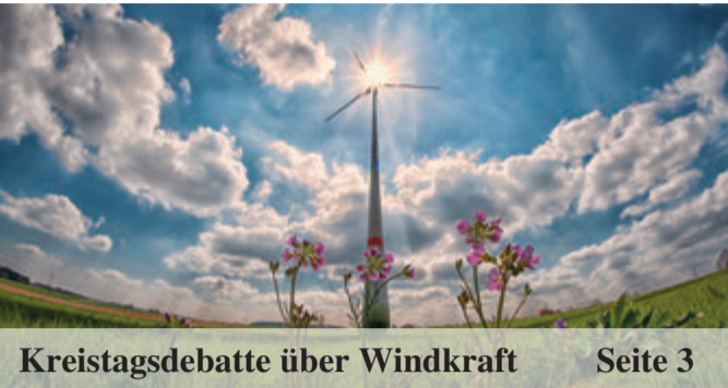
Kreistagsdebatte über Windkraft Seite 3

Analyse: Odenwaldkreis schneidet bei IHK-Studie schlecht ab Seite 11