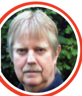
von Dr. Detlef Eichberg