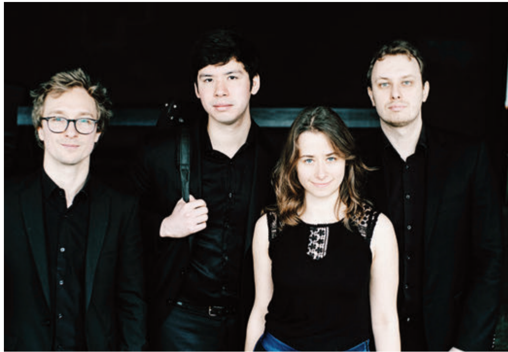
Das nach dem U.S.-amerikanischen Schriftsteller T. S. Eliot benannte „Eliot Quartett“ debütiert am 13. Februar um 17 Uhr in der Erbacher Werner-Borchers-Halle.

Eines der vielversprechendsten Streichquartette