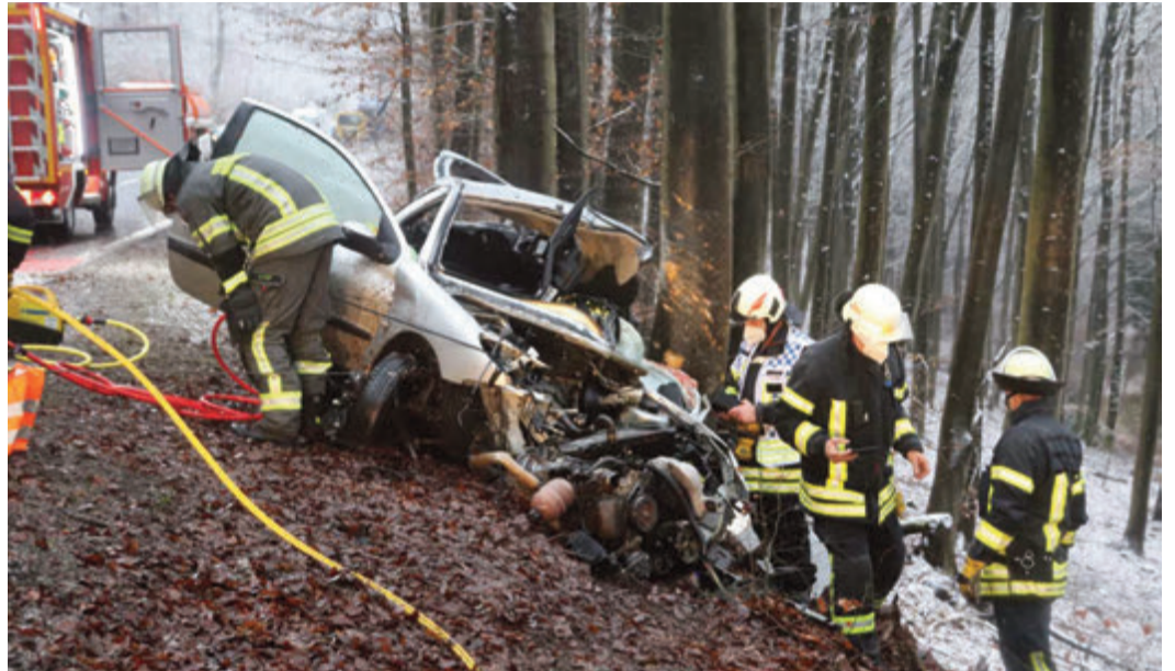
Das Auto wurde total zerstört.