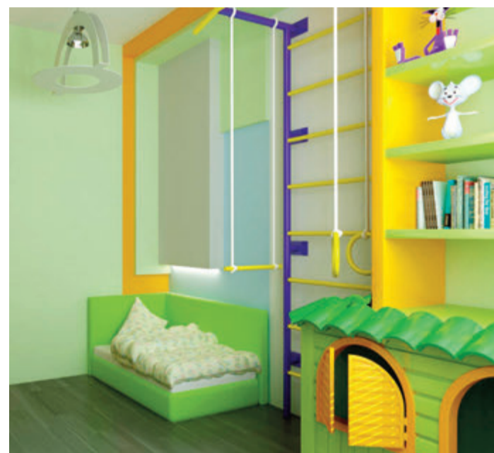
Egal ob in saftigem Grün oder kräftigem Orange gehalten: Farben bei den Möbeln und dem Parkettboden bringen Stimmung und gute Laune ins Kinderzimmer. Kinder neigen jedoch dazu, recht stürmisch zu sein. Daher raten Fachleute, den Belag vollflächig auf dem Untergrund zu kleben. Dann bleibt er schön leise und an den Kanten der Holzdielen gibt es keinen Verschleiß.

Bevor es losgeht, sollte man sich über die Wirkung der einzelnen Farben bewusst sein. Blau und Grün geben sich zum Beispiel be-