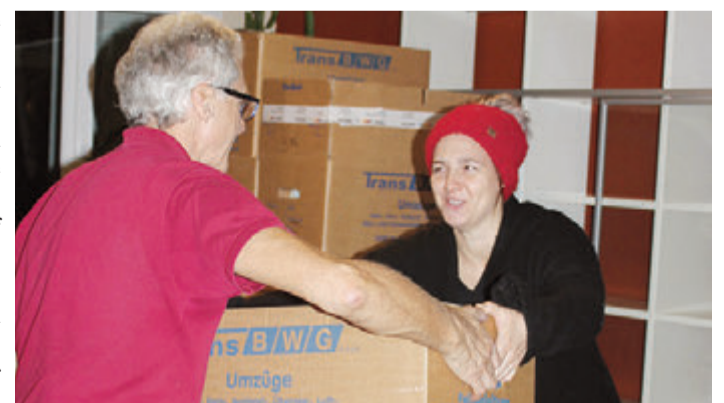
Die staatliche geförderte Eigenheimrente ist wichtig.

Wird hingegen die Immobilie aus beruflichen Gründen lediglich zeitweise nicht selbst bewohnt, bleibt die Förderung erhalten. Die Frist der Nichtnutzung ist in solchen Fällen auf maximal ein Jahr begrenzt. Während dieser Zeit laufen die Zulagen in der Regel einfach weiter. Ist man länger als