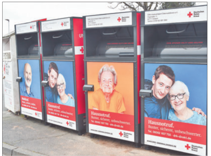
Frisch und ansprechend sind sie, die neuen Altkleider-Container des Roten Kreuzes, die im Laufe des Jahres die ausgedienten Vorgänger (links) ersetzen. Rund 180 der Boxen werden im Odenwaldkreis aufgestellt.

neuen Anbieter für die Abholung von Altkleidern