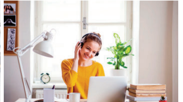
Farben und Lichtverhältnisse beeinflussen unsere Psyche. Daher sollte der Heimarbeitsplatz möglichst nahe am Fenster positioniert sein.

Ihr Partner vor Ort Altes Dach wie neu! Professionelle Dachbeschichtung