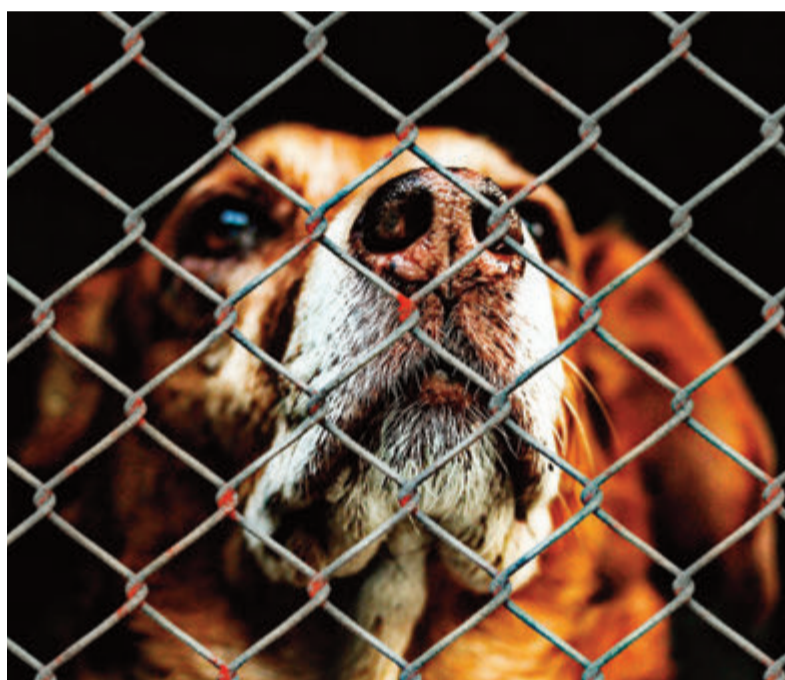
Breuberg hat einen neuen Kooperationspartner, wenn es um Fundtiere geht.

26,3 Kilometer beziehungsweise mit dem Auto 31 Minuten Fahrt sind es von Breuberg bis dorthin, dabei gibt es doch das lediglich 19,8 Kilometer (22 Minuten Fahrt) entfernte Tierheim „Tiere in Not Odenwald“ (TiNO) in Reichelsheim-Spreng, das auch noch Kapazitäten frei habe, erklärt TiNO am Telefon.