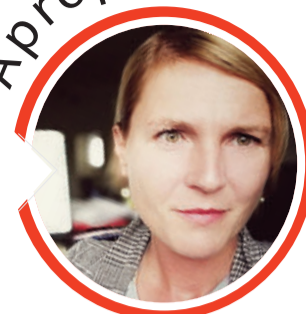
von Sandra Breunig, Redaktionsleiterin