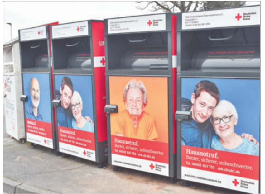
Frisch und ansprechend sind sie, die neuen Altkleider-Container des Roten Kreuzes, die im Laufe des Jahres die ausgedienten Vorgänger (links) ersetzen. Rund 180 der Boxen werden im Odenwaldkreis aufgestellt.

neuen Anbieter für die Abholung von Altkleidern