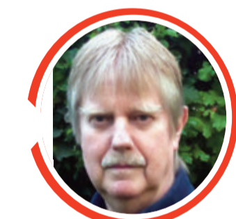
von Dr. Detlef Eichberg

Die beiden jungen Leute im VW kamen mit schweren, aber nicht lebensbedrohlichen Verletzungen in ein Krankenhaus, der 62-jährige Lkw-Fahrer blieb unverletzt. Die B38 musste für zwei Stunden voll gesperrt werden. Warum es zum Zusammenstoß kam, muss laut Polizeipräsidium noch geklärt werden. sab