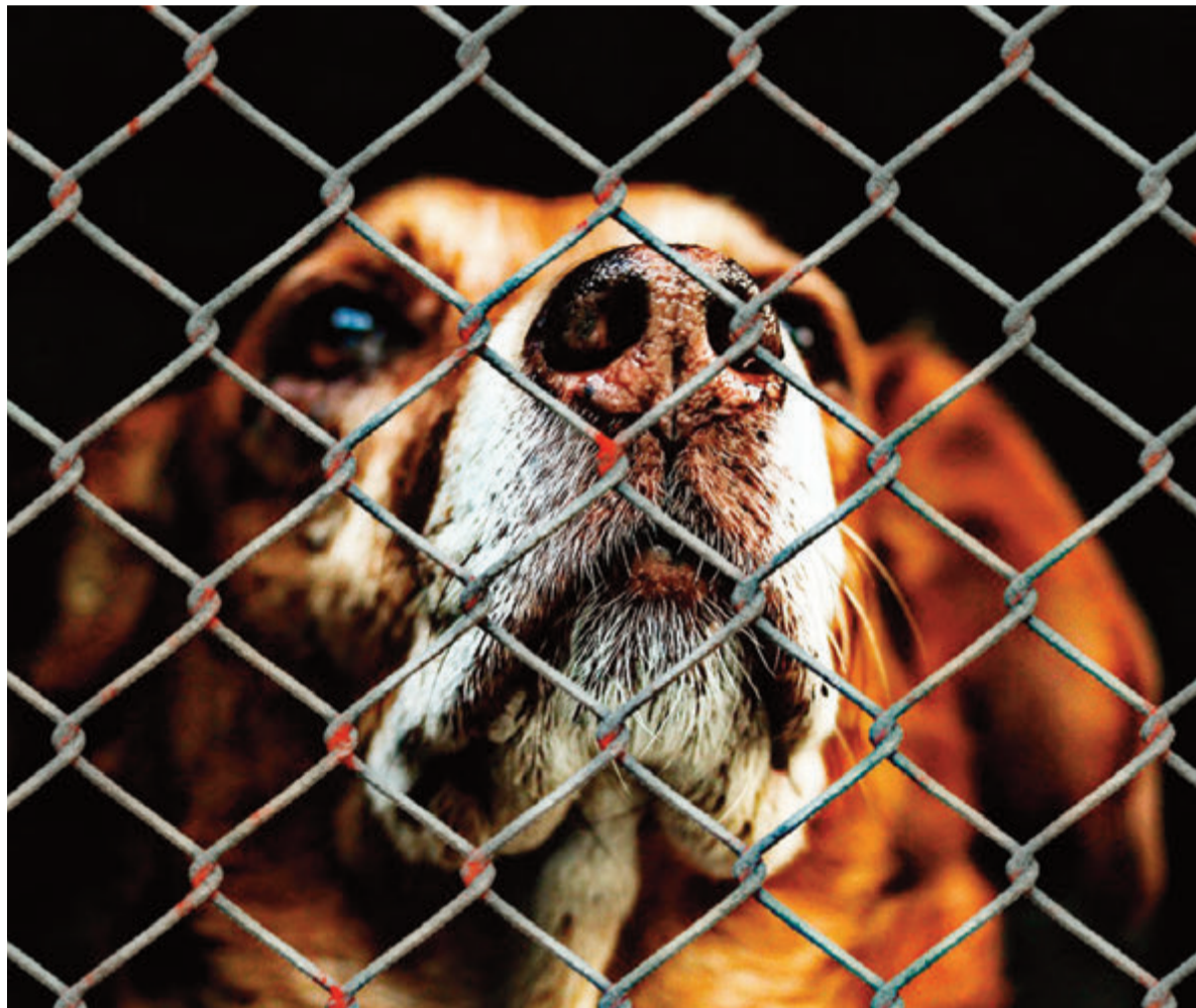
Breuberg hat einen neuen Kooperationspartner, wenn es um Fundtiere geht.