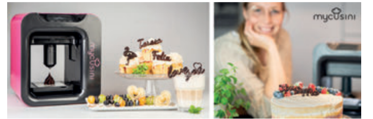
Print2Taste GmbH | Liebigstrasse 11 | 85354 Freising | www.mycusini.com

Alle Infos inkl. Gewinnspiel finden Sie unter www.mycusini.com .