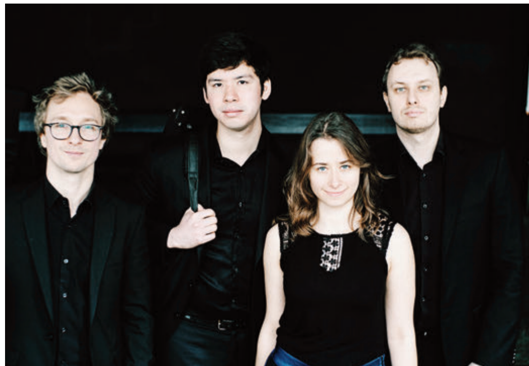
Das nach dem U.S.-amerikanischen Schriftsteller T. S. Eliot benannte „Eliot Quartett“ debütiert am 13. Februar um 17 Uhr in der Erbacher Werner-Borchers-Halle.

Eines der vielversprechendsten Streichquartette