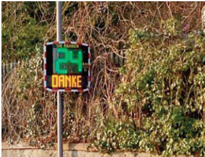
Das Display zeigt die Geschwindigkeit an.

die Übergabe der Tafel an die zuständigen Mitarbeitenden der Stadtverwaltung und wird nun in verkehrlich sensiblen Bereichen wie beispielsweise Grundschulen oder Kindergärten wechselweise angebracht. „Ich bin froh darüber, dass wir nun den Zuschlag für ein Dialog-Display erhalten haben, können wir damit die Verkehrsteilnehmenden visuell sensibilisieren, was die Einhaltung der Geschwindigkeit angeht“, so Bürgermeister Manuel Feick. Und weiter: „Mir ist es sehr wichtig, möglichst viel Sicherheit im Straßenverkehr unserer Stadt zu haben, deshalb werden wir genau schauen, wo diese Tafel zum Einsatz kommt. Selbstverständlich kann diese dem Verkehrsteilnehmenden nur ein Signal sein, sich an die erlaubten Höchstgeschwindigkeiten zu halten. Umsetzen muss es jeder selbst.“