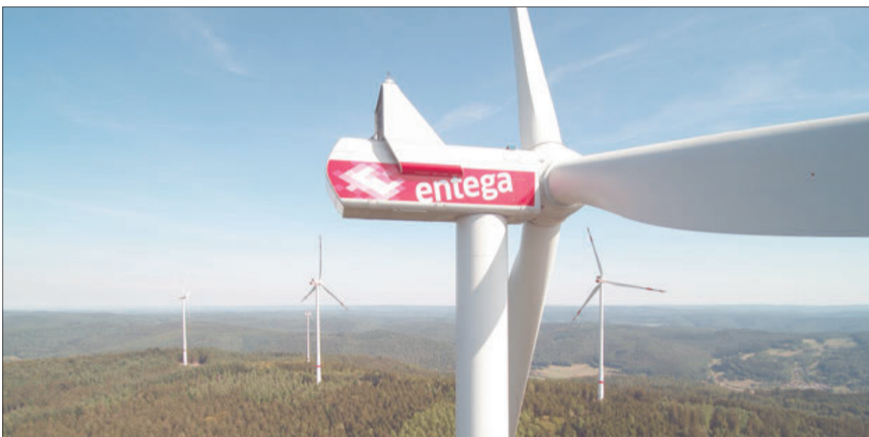
ENTEGA setzt sich laut TÜV Süd-Zertifizierung in besonderem Maße für den Ausbau der Erneuerbaren Energien ein.

ENTEGA erneut als „Wegbereiter der Energiewende“ ausgezeichnet