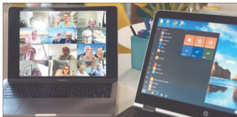
Videoberatung der Wirtschaftsförderung Oberzent/Odenwaldkreis.