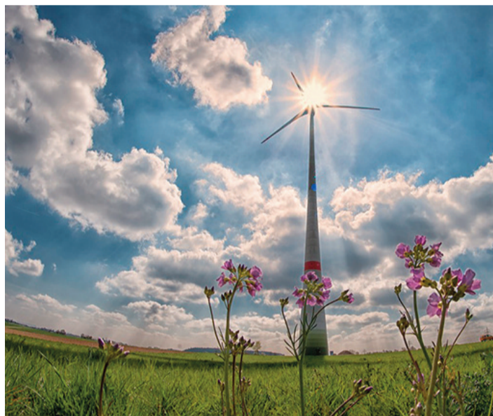
Ein heikles Thema im Odenwald: Windparks.

In den Beschluss aufgenommen wurde auch die Anregung der Grünen, weitere Ausstellungen zu zeigen, insbesondere zu den Themen Migration und Flucht. Landrat Matiaske zeigte sich dafür offen, trat aber dafür ein, nur solche Ausstellungen zu zeigen, die ebenfalls vom Bund oder Land initiiert worden seien beziehungsweise gefördert würden. red