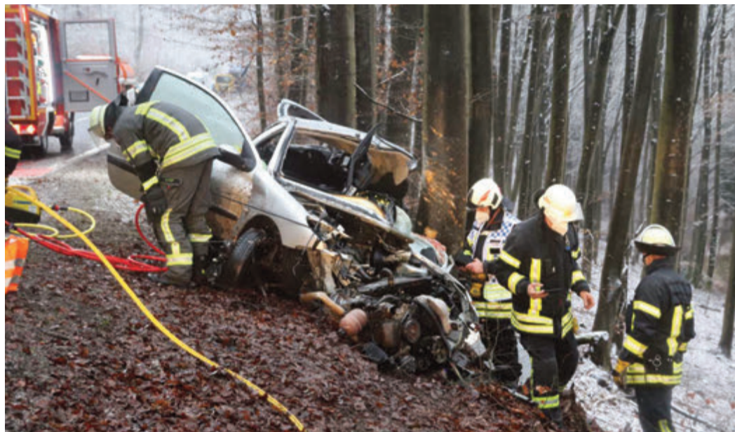
Das Auto wurde total zerstört.