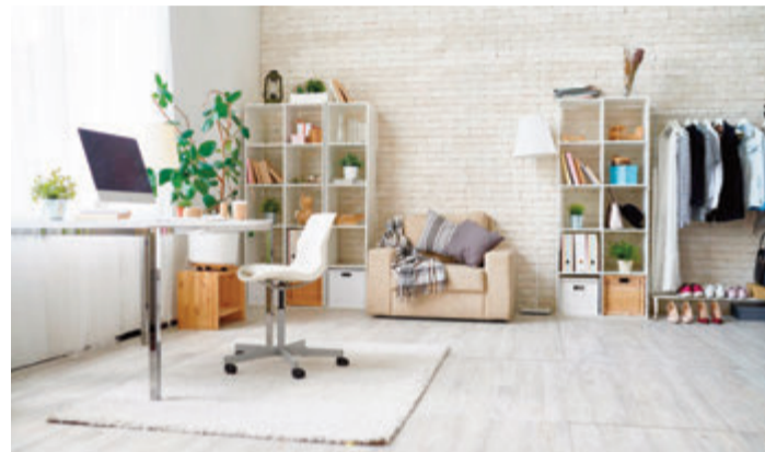
Wer ganz oder zeitweise im Homeoffice arbeitet, sollte auf eine ungestörte und gesunde Arbeitsumgebung achten.