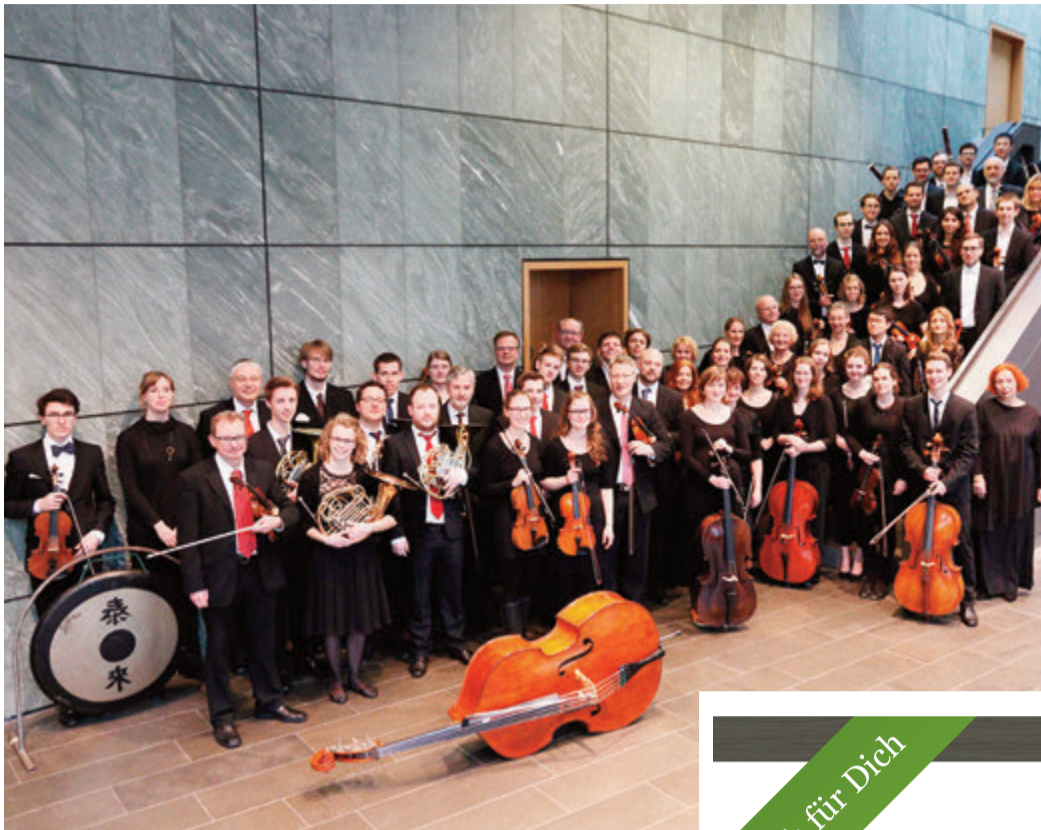
Orchester der TU Darmstadt.