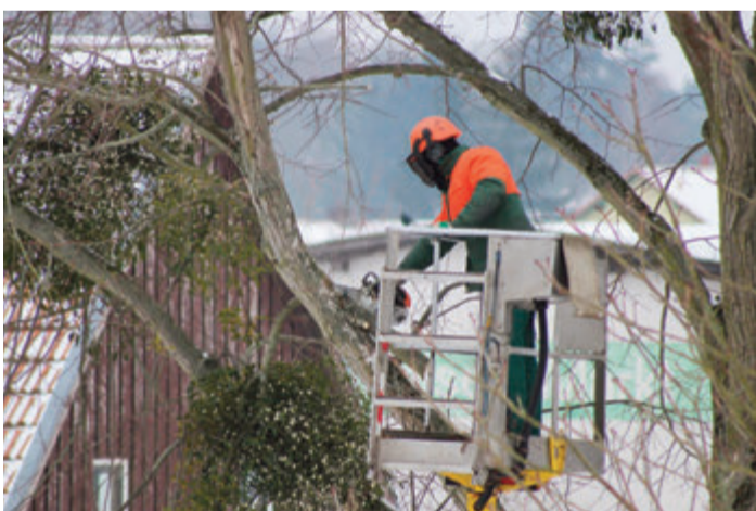
Das Zurückschneiden ist nicht ganzjährig erlaubt.

Kreis Darmstadt-Dieburg. In einigen Tagen werden uns die ersten Amseln in unseren Gärten wieder mit ihrem morgendlichen Gesang erfreuen. Die Kohlmeisen begutachten schon jetzt die Nistkästen in denen sie im Sommer brüten werden. Der Frühling scheint zu kommen, auch wenn es draußen noch kalt ist.