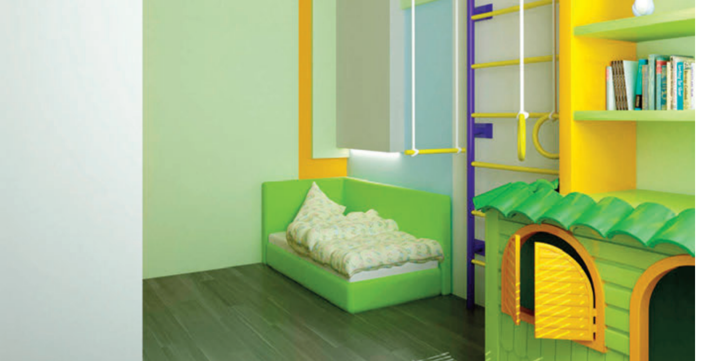
Farben bei den Möbeln und dem Parkettboden bringen Stimmung und gute Laune ins Kinderzimmer.