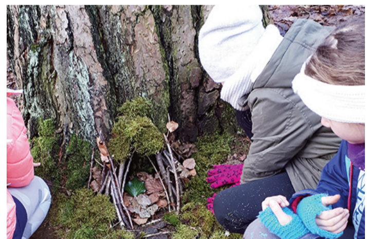
Die Kinder konnten viel entdecken.