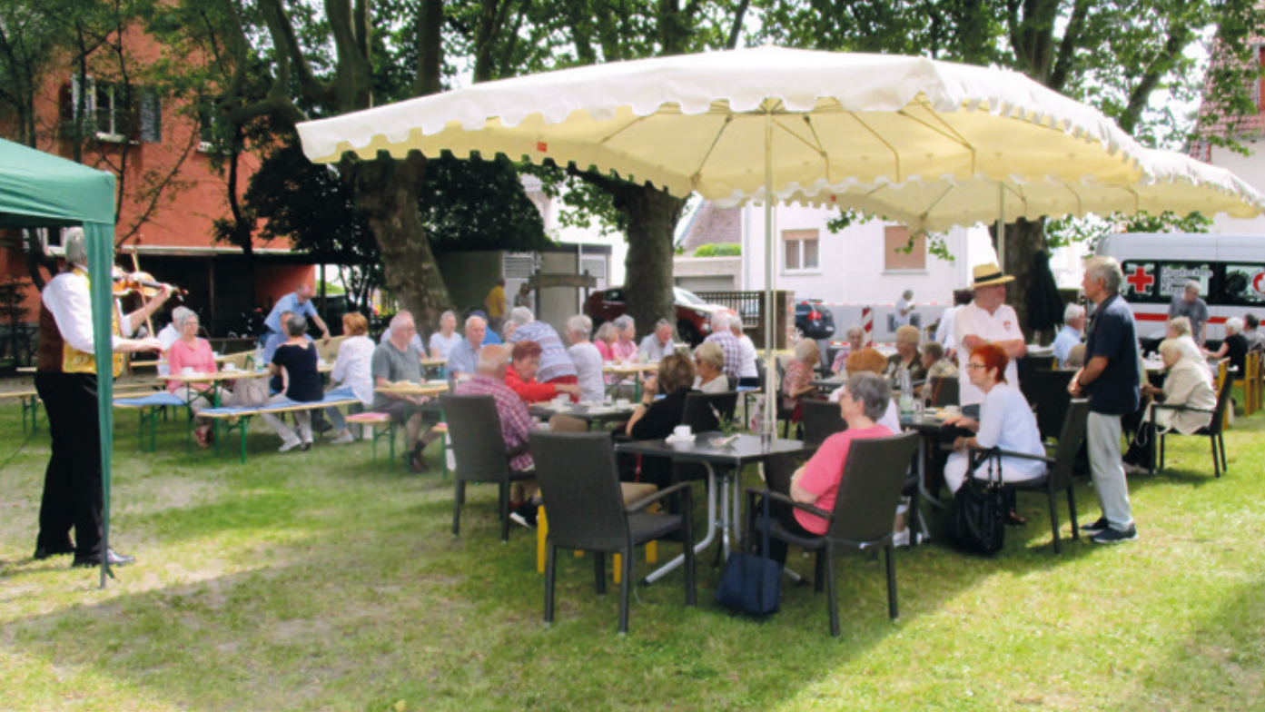
Feste im Freien gab es (hier Sommer 2021) und wird es wieder geben!