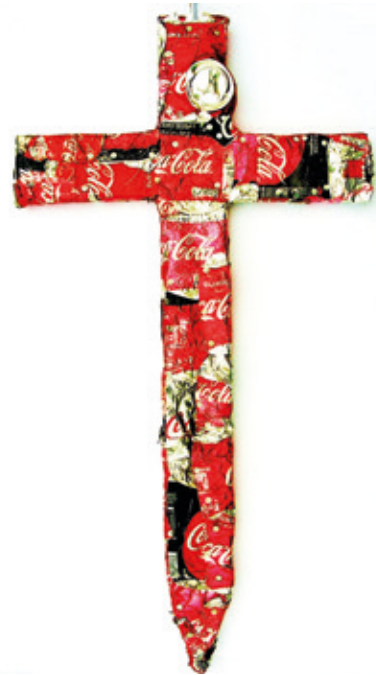
NEDE „KONSUMKREUZ“ – Das Kreuz als Symbol für Hoffnung wird um einen neuen Glaubensaspekt den „Konsum“ erweitert. MixedArt – weg geworfene und platt gefahrene Coca-Cola Dosen auf Holzkreuz genagelt.

mit dem Ansatz seine Kunst als Stilmittel für den Ausdruck persönlicher Verwerfungen, Unangepasstheit und Statements zu nutzen. Er arbeitet unter anderem mit den Verpackungen bzw. Abfällen der Konsumgesellschaft und recycelt sie zu Kunstwerken. Konsum wird bei ihm zur provokativen Macht. Das überzogene selbst porträtieren moderner Lebensweisen. Seine Arbeitsschwerpunkte sind Objekte, Fotografie, Collagen, Skulpturen und Installationen. Hauptthemen der künstlerischen Auseinandersetzung sind vorwiegend der Konsum-, Marken- sowie Verpackungsfetisch.