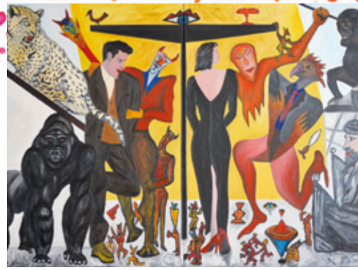
Das Affenhaus, Öl auf Leinwand, 1985.