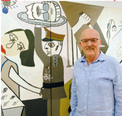
Der Künstler in seinem Atelier vor dem Bild „Militärputsch“ von 1973.