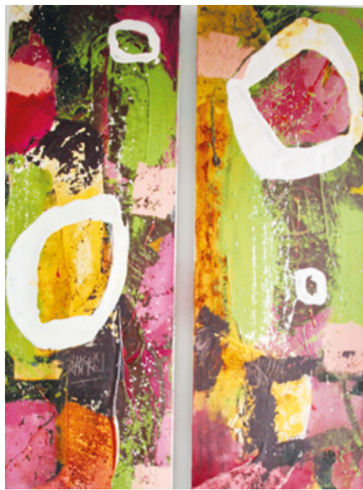
Magische Spuren des Sommers, Mischtechnik auf Leinwand, 2021.