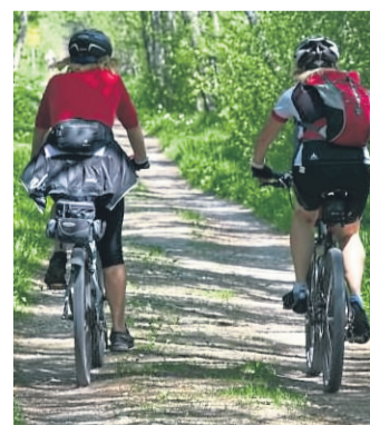
Der Radverkehr im Main-Kinzig-Kreis soll sicherer und attraktiver werden.

Nun ist wieder die Mithilfe der Bürgerinnen und Bürger gefragt. In einer zweiten Online-Beteiligung können interessierte Personen seit Dienstag vier Wochen lang den aktuellen Entwurf des Radverkehrskonzepts einsehen, In-