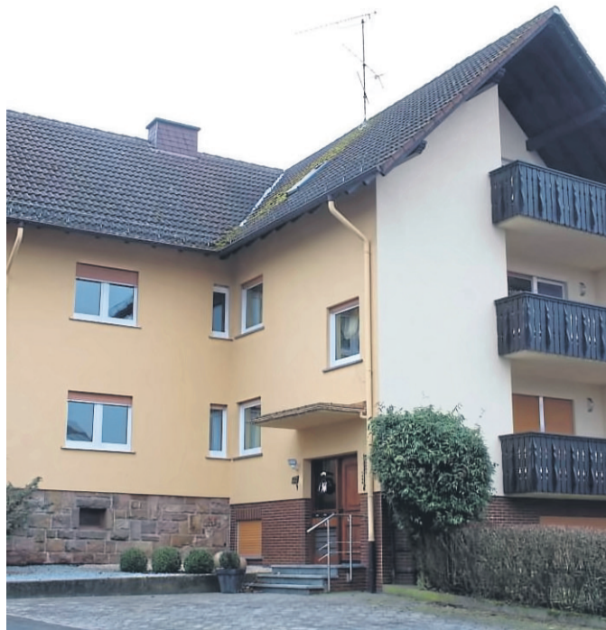
Das neue Pfarramt befindet sich in diesem Gebäude im Friedhofsweg, das die Pfarrfamilie erworben hat.

Ein glücklicher Umstand sei laut Eisenbach der Verkauf eines Wohnhauses in