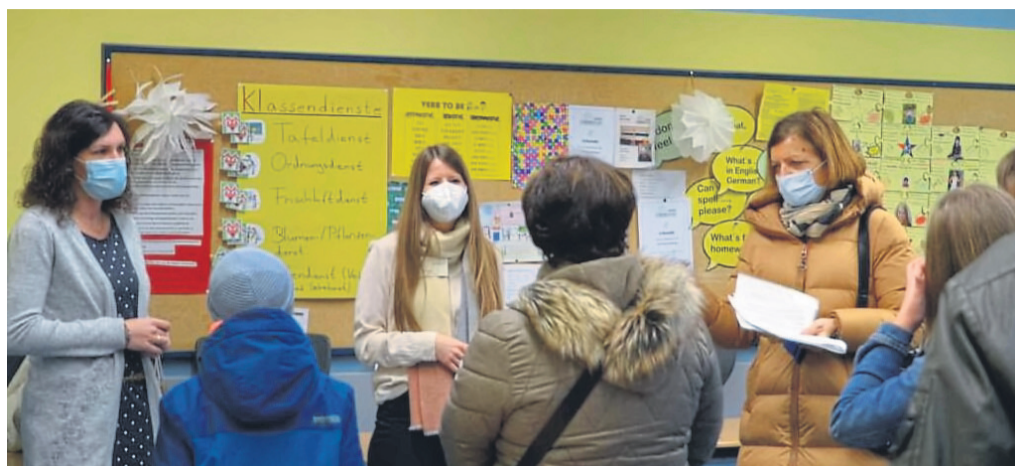
Für den Tag der offenen Tür am Ulrich-von-Hutten-Gymnasium hatte die Schule ein innovatives Konzept entwickelt, um Interessierte empfangen zu können.

Eine wesentliche Station des Rundgangs war das Adamgebäude, wo traditionell die Jahrgangsstufen 5-7 untergebracht sind. Dieses Gebäude ist als geschützter