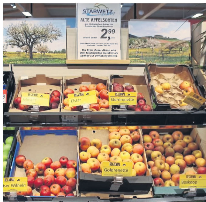
„Starwetz Äpfel“ gibt es im Rewe-Markt in Sterbfritz. Der Erlös geht an den örtlichen Kindergarten.