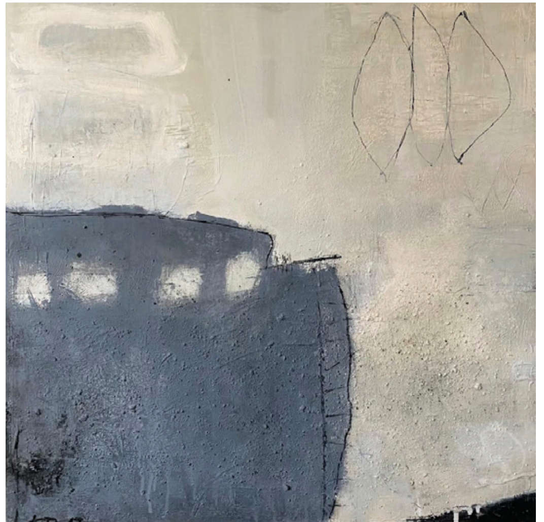
Acryl / Mischtechnik auf Leinwand 70x70 cm.