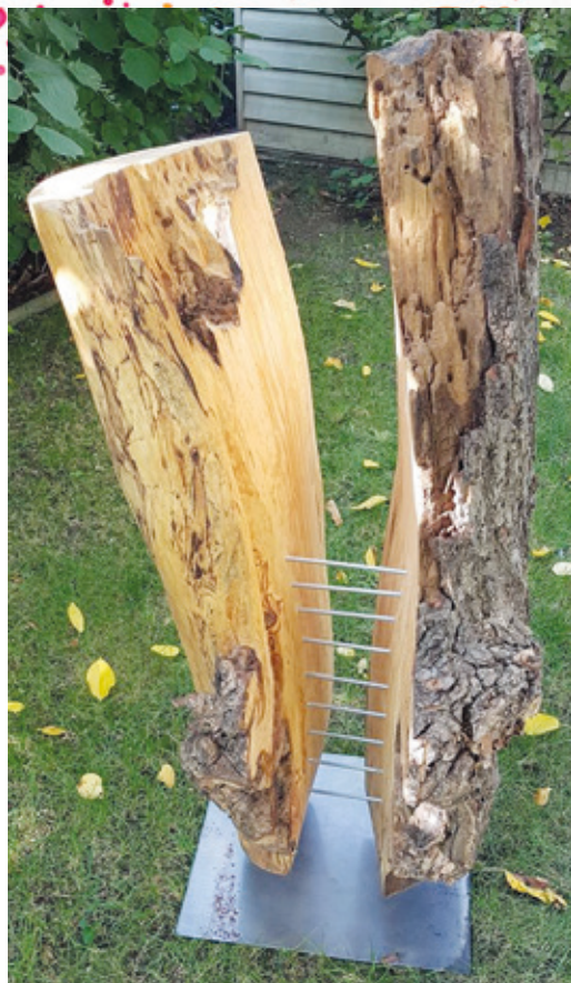
Geteilt und wieder Vereint, Linde, Alustäbe, Stahl 2020.