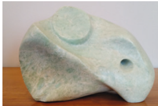
Acryl / Mischtechnik auf Leinwand 70x70 cm.