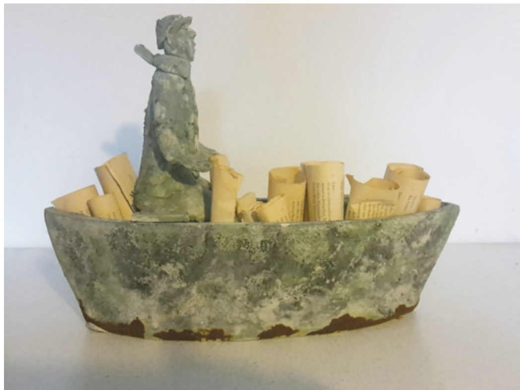
Leonce und Lena. G. Büchner rettet sein Werk durch die Zeit. Ton mit Engobe.