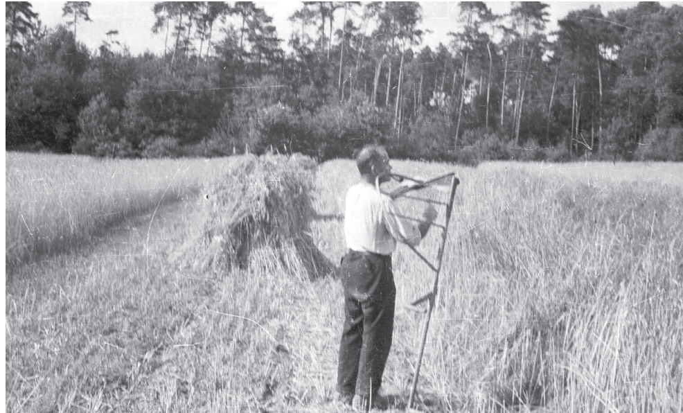
Nachscharfen einer Sense beim Mähen von Getreide vor dem Heegberg um 1950.

(Erzhausen, HS) Fragen Sie einmal jemanden mit Erzhäuser Wurzeln, der in oder nach den Wirtschaftswunderjahren geboren wurde und einen anderen, zwei Jahrzehnte älteren, was denn ein Schloggerfass sei. Vielleicht erhalten Sie die Antworten „weiß nicht“ und „klar, kenn ich noch“.