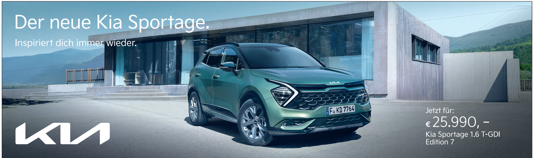
Abbildung zeigt kostenpflichtige Sonderausstattung.

(Arheilgen, AZS) Am 18. März kehren wir aus der Winterpause zurück und nehmen unser beliebtes Freitagsradeln wieder auf. Wie gewohnt treffen wir uns an jedem ersten und dritten Freitag im Monat auf dem dem Platz vor der DM Drogerie um 14 Uhr. Zwischen durch oder am Ende unserer Radtour werden wir irgendwo einkehren, um unseren Durst zu löschen und gemütlich zu plaudern. Wir freuen uns über weitere Mitradler*innen. Die Teilnahme erfolgt auf eigene Verantwortung. www.arheilger-stadtteilverein.de