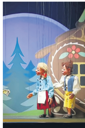
„Die Holzköpfe“ gastieren in Bad Soden.

BAD SODEN – Das Steinauer Marionettentheater „Die Holzköpfe“ gastiert am Sonntag, 20. März, im Spessart Forum Kultur in Bad Soden.