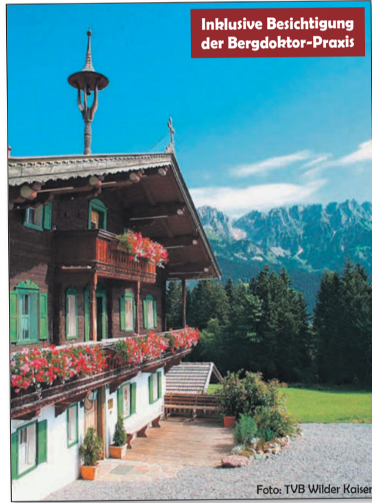
Inklusive Besichtigung der Bergdoktor-Praxis

schönen Schifffahrt über den mächtigen Gebirgssee (Aufpreis - buchbar vor Ort). Danach Beginn der Heimreise über Tegernsee und München zurück in die Ausgangsorte. Erinnerungen an eine tolle Reise und an die Stars haben Sie im Reisegepäck.