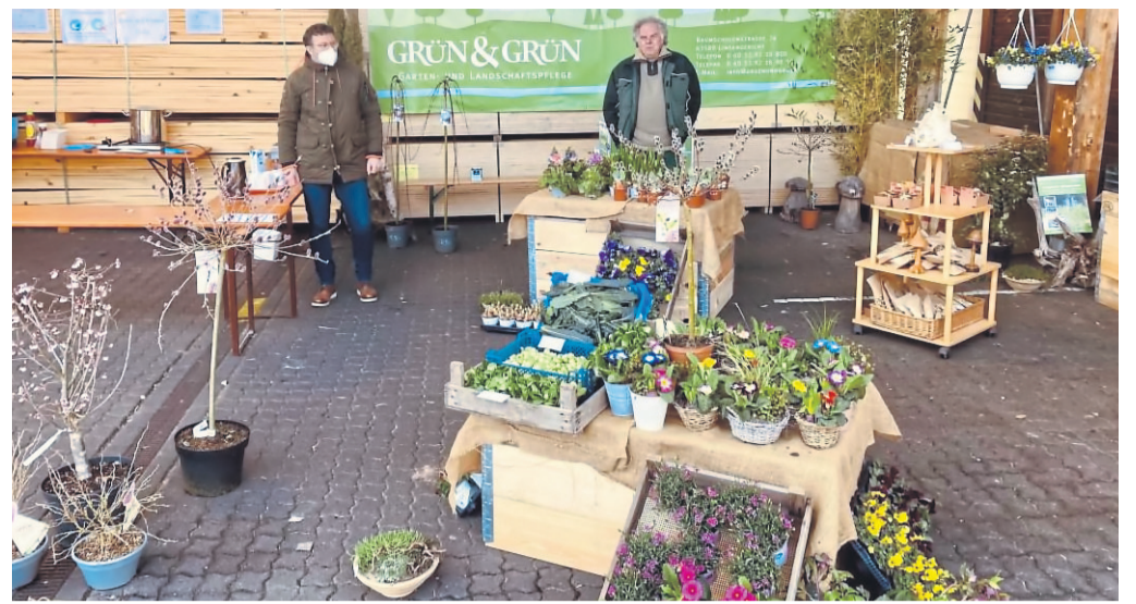
Der Inklusionsbetrieb „Grün und Grün“ hatte beim Imkertag in Schlüchtern die ersten Frühblüher und Gehölze im Angebot.