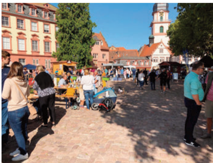
So soll der Marktplatz mit Leben gefüllt sein.