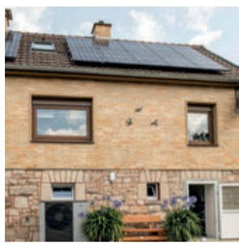
Mit einer Photovoltaik-Anlage selbst erzeugter Strom schafft Unabhängigkeit von steigenden Energiepreisen – NIBE PV-Smart macht die Nutzung in Verbindung mit einer NIBE Wärmepumpe besonders intelligent.

Voraussetzung: Die Wärmepumpen-Regelung sollte den von der Sonne erzeugten PV-Strom zur späteren Nutzung auf verschiedene Arten thermisch speichern oder in heißen Monaten zur Kühlung einsetzen können.