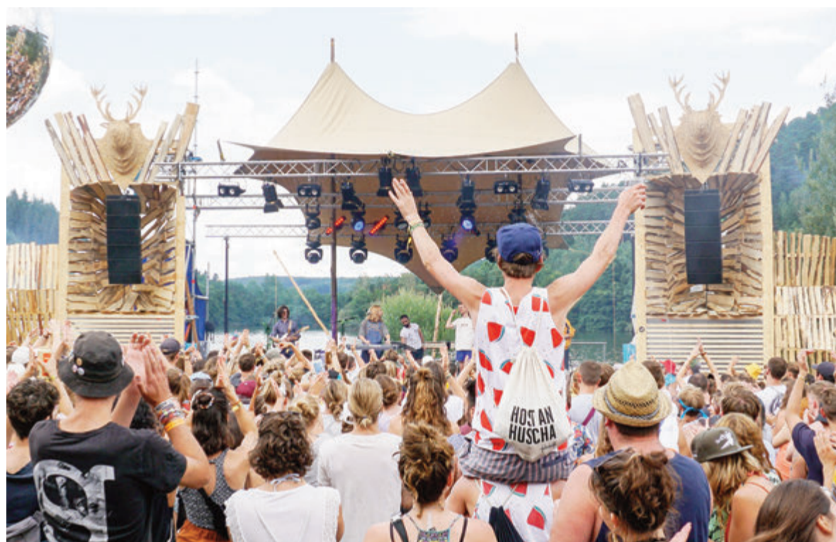
„Sound of the Forest“ ist über die Grenzen des Odenwalds hinaus bekannt.

Odenwald. Nach zwei Jahren pandemiebedingter Verschiebungen kehrt das Team rund um den „Sound of the Forest (SOTF)“-Verein vom 4. bis 7. August zurück an den Marbach-Stausee, um wieder für die gesamte Rhein-Main-Neckar Region und weit über sie hinaus eines der schönsten Festivals Deutschlands zu inszenieren. Die vom SOTF-Team selbstironisch betitelte „Stauseekerb“ ist eben genau das nicht. Seit nunmehr elf Jahren pilgern Bands aus der ganzen Welt zu einem der beliebtesten Musikentdecker-Festivals in den wunderschönen Odenwald. Wo in Zeiten von Social Distancing noch Kameras bei der ARTE TV Produktion „Zeitgleichfestival“ die Bilder vom bunten Treiben am Odenwälder See in über eine Million Haushalte übertrugen, sollen nun die Gäste wieder live vor Ort im Gefühl des Zusammenseins baden. So können die Zuschauer und Zuschauerinnen wieder über 50 Acts auf den Brettern der Festivalbühnen hören, bestaunen und live erleben. „Für uns ist es eine Riesenfreude, die Bands wieder unseren Forest-People live zu präsentieren – Und im Umkehrschluss auch den Bands wieder die Möglichkeit geben zu können, mit ihrem Publikum zu interagieren. Zusammen im See zu schwimmen und einen „Wilden Hirsch“ im Sonnenuntergang zu genießen. Einfach auf eine geile Zeit anzustoßen und darauf, die dunklen Tage die hinter uns liegen zu