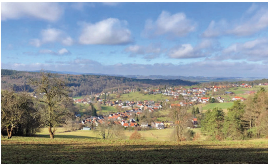
Panoramablick auf Weiten-Gesäß.

Außerdem sorgen sie für attraktive Aktivitäten für alle Altersgruppen