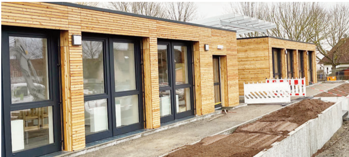
Die neue Kita.