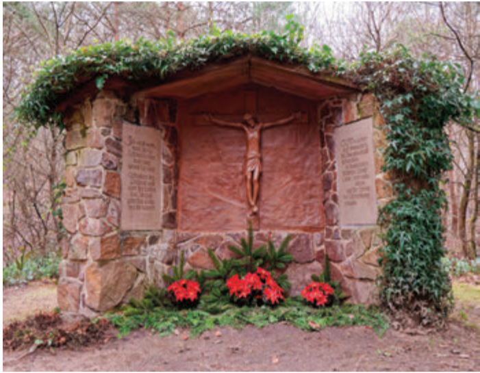
Mitten im Wald steht die beschauliche Freiluftkapelle „Maria-Hilf“.

Groß-Zimmern. Der Odenwaldklub Groß-Zimmern lädt für Sonntag (27.2.) zu einer Wanderung durch einen der vielfältigsten und abwechslungsreichsten Forsten in Südhessen ein.