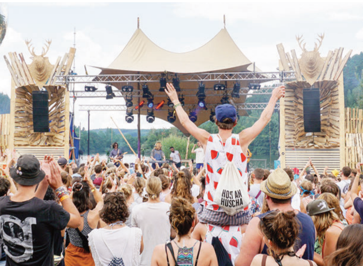
„Sound of the Forest“ ist über die Grenzen des Odenwalds hinaus bekannt.

Odenwald. Nach zwei Jahren pandemiebedingter Verschiebungen kehrt das Team rund um den „Sound of the Forest (SOTF)“-Verein vom 4. bis 7. August zurück an den Marbach-Stausee, um wieder für die gesamte Rhein-Main-Neckar Region und weit über sie hinaus eines der schönsten Festivals Deutschlands zu inszenieren.