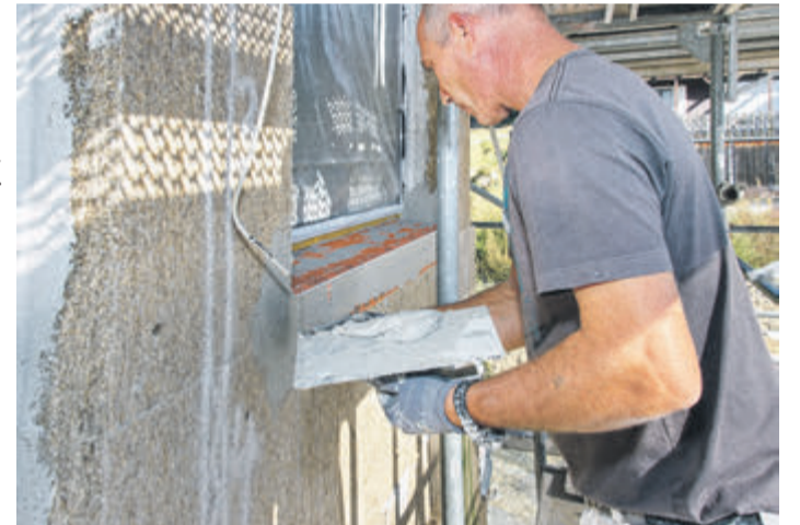
Dämmung mit Hanf, eine der ältesten Nutzpflanzen der Welt