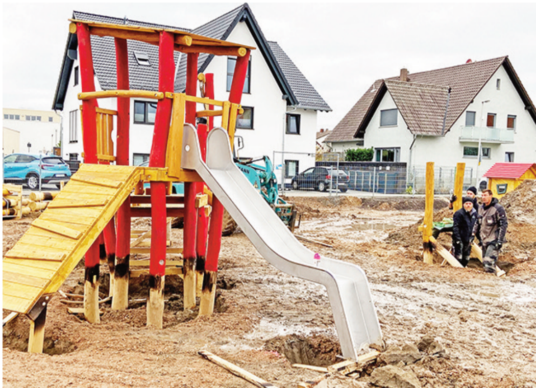
Der neue Spielplatz in der Nelly-Sachs-Straße.

Im Rahmen der Spielplatzbegehungen des Sozial-, Sport, und Kulturausschusses im Jahre 2019, wünschten sich Eltern und Kinder, dass bei der Neugestaltung des Spielplatzes der Rutschurm auf alle Fälle erhalten wird. Dieser Wunsch wurde von Annette Wreesmann in die Tat umgesetzt. Im Mai 2021 stellte sie in der Sitzung des Sozial-, Sport und Kulturausschusses ihre Planung zur