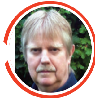
von Dr. Detlef Eichberg

verwenden? Tatsächlich wirkt Brennessel-Kraut harntreibend und entwässernd. Daher der Einsatz bei Gicht. Der hohe Gehalt an Kieselsäure wirkt zudem kräftigend auf das Bindegewebe. Als Haarwasser entfaltet der Brennessel-Extrakt eine durchblutungsfördernde Wirkung und kann aufgrund des Kieselsäuregehalts die Haarstruktur kräftigen. Die Anregung der Durchblutung wird durch den Gehalt an Ameisensäure ermöglicht.