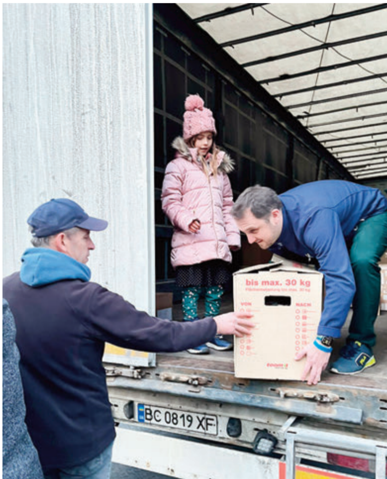
Am Dienstag trafen die ersten Hilfspakete ein.

„Das alles ist so furchtbar.“ Von einem Psychopathen spricht sie, wenn es um den russischen Staatschef Wladimir Putin geht, einem Menschen, dessen Verhalten nicht zu verstehen sei. Ihre ukrainische Familie sei jetzt glücklicherweise in Sicherheit vor diesem