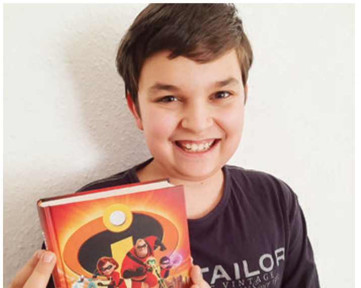
Silas überzeugt die Juroren.

In die Vorlese-Entscheidung der Städte und Landkreise zogen in diesem Jahr bundesweit mehr als 6.000 Schulsieger ein. Alle teilnehmenden Kinder erhalten eine Urkunde und eine Sonderausgabe von „Das Universum ist verdammt groß und supermystisch“ von Lisa Krusche (Beltz). Alle Gewinner der Stadt- und Kreisentscheidung erhalten zusätzlich ein Exemplar von „Calypso Irrfahrt“ von Cornelia Franz (Carlsen). 480.000 Kinder nehmen insgesamt am 63. Vorlesewettbewerb teil. Damit kommt der Wettbewerb nahezu auf das Niveau eines Vor-Corona-Jahres. Der seit 1959 stattfindende Vorlese-