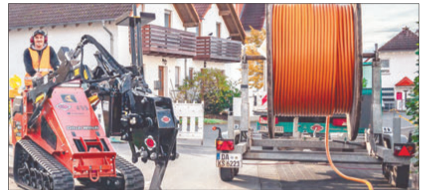
ENTEGA arbeitet beim Ausbau des Glasfasernetzes mit dem regionalen Bauunternehmen Klenk & Sohn, einem Spezialisten für Kabelverlegearbeiten, aus dem Modautal zusammen.

Gemeinsam für Südhessen: Zukunftsprojekt Glasfaser