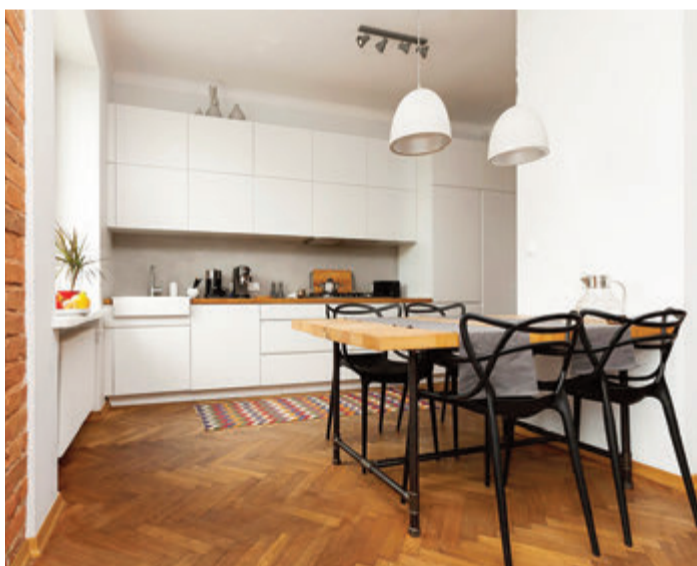
Warme Töne durch Parkett.

Der Inbegriff von Gemütlichkeit ist Parkett, vor allem wenn es gebürstet ist. Bei dieser Technik werden die weichen Teile des Holzes