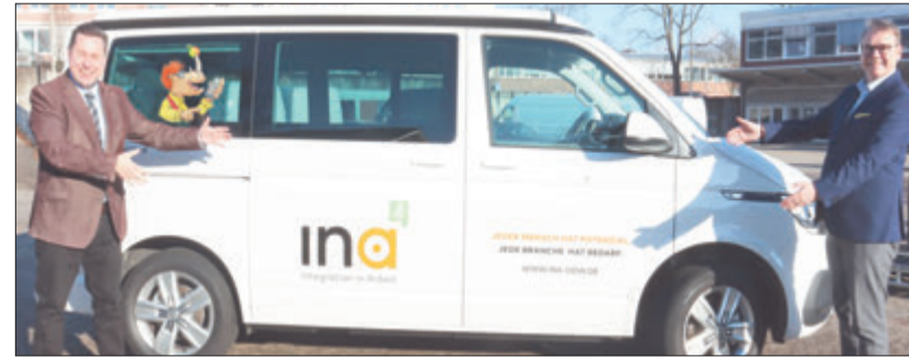
Mithilfe des umgebauten Fahrzeuges können die Maßnahmencoachs täglich die Teilnehmenden vor Ort besuchen und so barrierefrei mit ihnen ins Gespräch kommen.

Mit positiver Perspektive und InA-Mobil zum Arbeitsmarkt