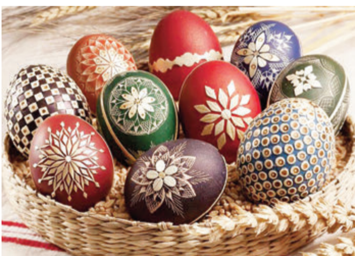
Es gibt Eier in vielen Variationen.

Die rund 40 Künstler freuen sich schon, ihre eiförmigen Werke einem breiten Publikum zu präsentieren. Folgende Techniken am Ei werden in diesem Jahr vertreten sein: Aquarellmalerei, Fimoarbeiten, Straußeneilampen, Serviettenteknik auf Hühner-Gänse und Nandueiern, Eier mit Faberge, Eier mit Wachs- und Batiktechnik, Perlen und Scherenschnitte, Eier in Spitze, Seide und edlen Stoffen gehüllt, Kalligraphie und Wachsboisierungen, Eier mit Sprüchen, Gedichten und Weisheiten, Ölmalerei auf verschiedenen Eiern und Holzdosens, Gravur und Frästechnik, Eier mit Strohhaplikationen