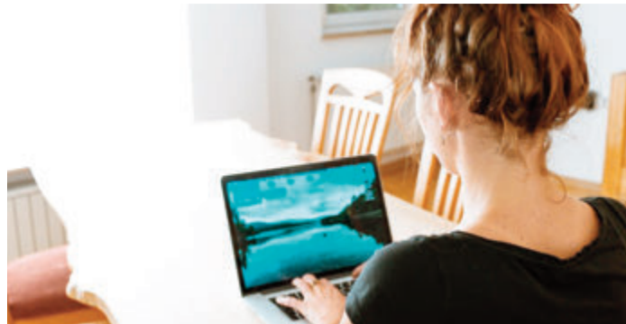
Homeoffice hat viele Vorteile.

Auch wenn die Homeoffice-Pflicht im Rahmen der Pandemie demnächst aufgehoben wird, wird ein gewisser Grad der Digitalisierung in der Arbeitswelt bleiben und die Situation von Frauen mit und ohne Kinder nachhaltig be-