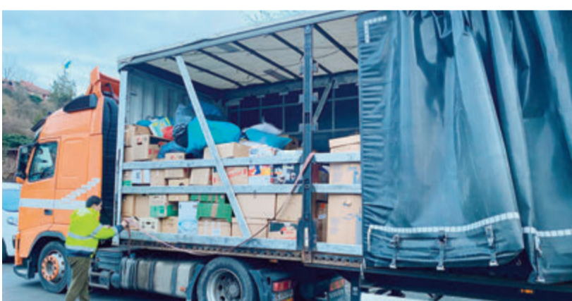
Am Mittwochmorgen war der Lkw schon gut gefüllt.