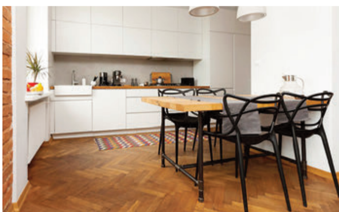
Warme Töne durch Parkett.

Der Inbegriff von Gemütlichkeit ist Parkett, vor allem wenn es gebürstet ist. Bei dieser Technik werden die weichen Teile des Holzes