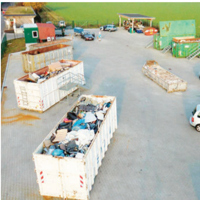
Der Wertstoffhof in Semd.

Bei gleichen Anlieferungsmengen ist für Abfallgemische die Gebühr höher als für vorsortiert Anlieferungen. Weiterhin spart man sich die Zeit für eventuelle Nachsortierungen auf dem Wertstoffhof. Für alle Entsorgungsfragen steht die städtische Abfallberatung unter Tel.: 06078-781-219 zur Verfügung. Der