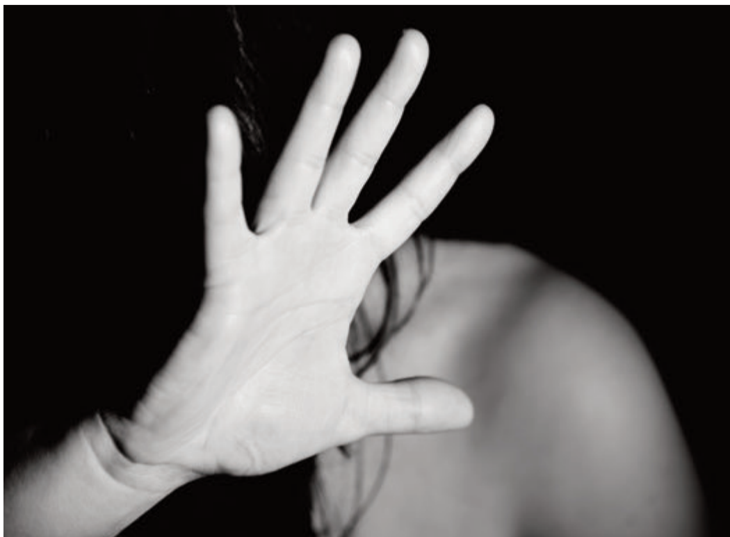
Die Gewalt gegen Frauen steigt.