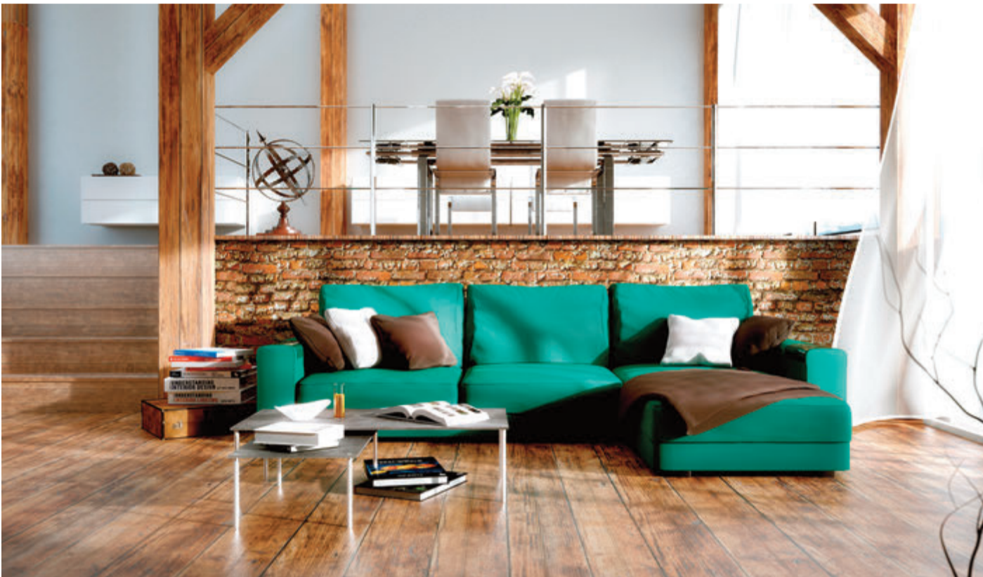
Natürliches und gemütliches Wohnen liegt im Trend.

Echtholz-Parkett in den vier Wänden für mehr Geborgenheit