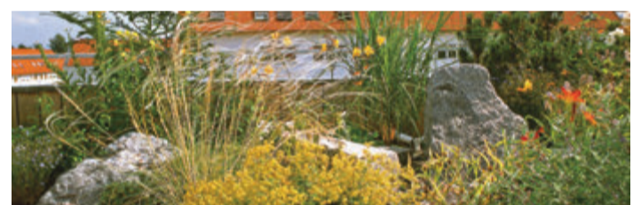
Für eine effektive Dachbegrünung stehen verschiedene Varianten zur Wahl.

Grundstücke in Neubaugebieten werden tendenziell immer kleiner, damit schrumpfen zugleich die Gärten – während der Anteil der versiegelten Fläche zunimmt. Warum also nicht ein Stück Natur aufs Dach holen? Ein Gründach ist eine Bereicherung für das eigene Zuhause ebenso wie für das Mikroklima in der Stadt. Wir geben Tipps und stellen die verschiedenen Gründach-Varianten vor.