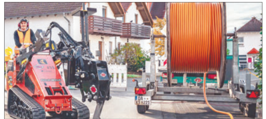
ENTEGA arbeitet beim Ausbau des Glasfasernetzes mit dem regionalen Bauunternehmen Klenk & Sohn, einem Spezialisten für Kabelverlegearbeiten, aus dem Modautal zusammen.

Gemeinsam für Südhessen: Zukunftsprojekt Glasfaser