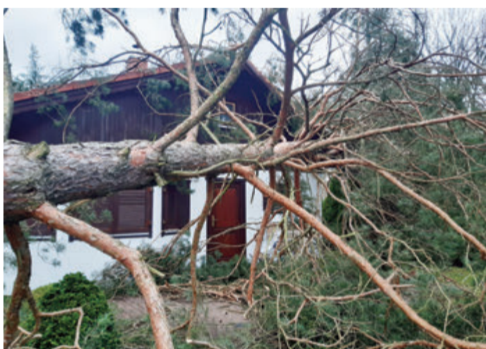
Das ist gerade nochmal gut gegangen.

Ältere Dächer müssen regelmäßig auf Schäden kontrolliert und instandgehalten werden. Besonders gefährdet sind Gebäude auf Anhöhen, Bergkuppen, freien Flächen oder in Hanglagen. Was ist