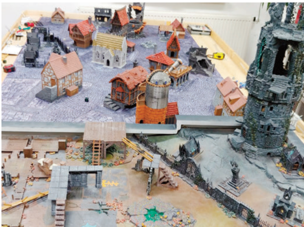
Mittelalter/Fantasy-Welt im JUZ

Das Spiel selbst wird an einem großen Tisch mit mindestens vier Personen gespielt. Natürlich können noch mehr Personen mitspielen, die sich auch als Gruppen zusammenschließen können. Es verbindet Strategie- und Rol-