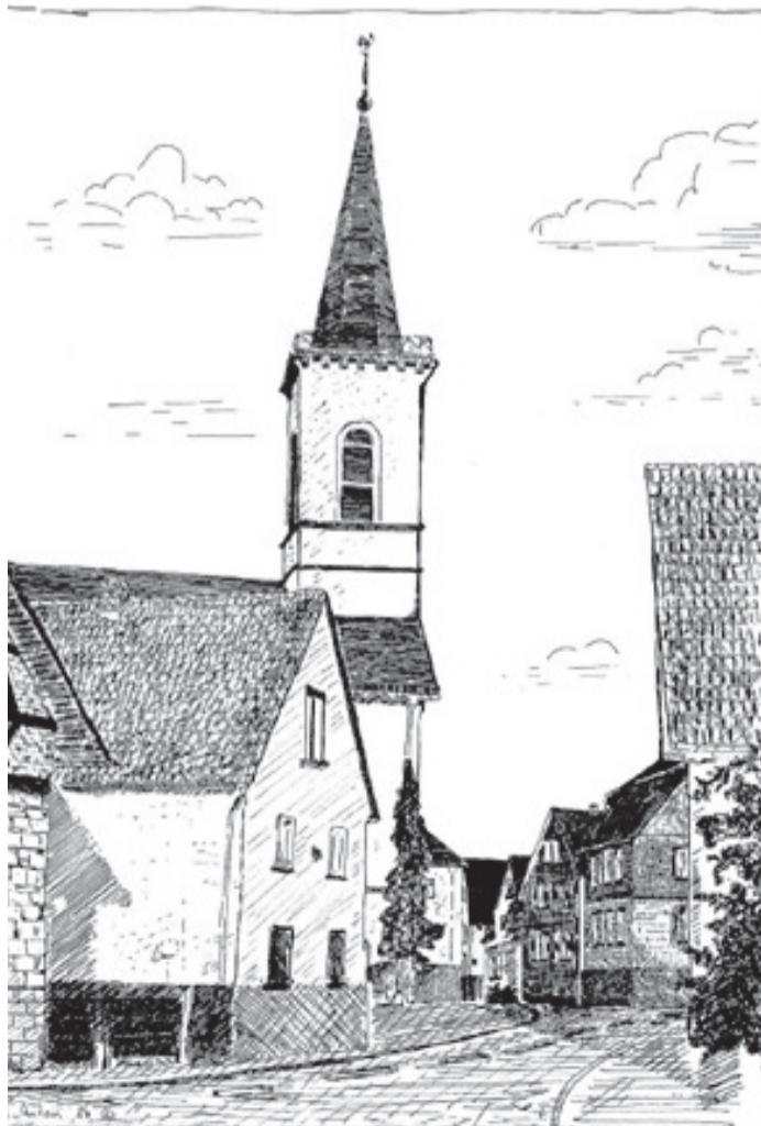
Ortsansicht von der Wiesenstraße her gesehen. (Bild: Zeichnung von Norbert Anton)

kam Eppertshausen durch den Reichsdeputationshauptschluss unter die Oberhoheit des Fürsten von Isenburg-Birstein. Dieser bürdete dem Ort eine ungeheure Schuldenlast auf. Durch den Wiener Kongreß wurde Eppertshausen dem Großherzogtum Hessen-Darmstadt zuerkannt. Die großherzogliche Regierung teilte die Mark Babenhausen unter die Markgemeinden auf. Die Abtei und der Oberwald wurden Gemeindegewald von Eppertshausen.