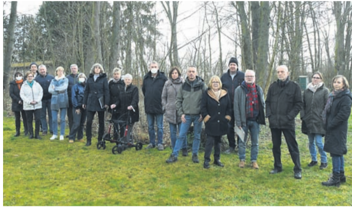
Die Anwohner der Heinrich-von-Kleist-Straße wollen das Wäldchen am Werlacher Weg erhalten und demonstrieren das am Samstag beim Treffen mit unserer Zeitung.