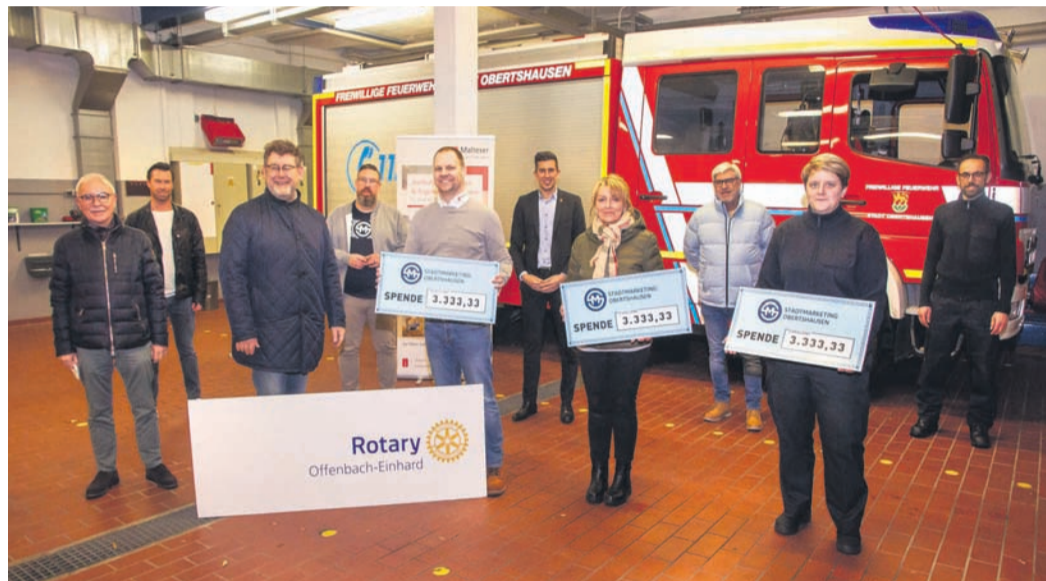
Freude über die Spendenschecks aus dem Adventskalender-Erlös.