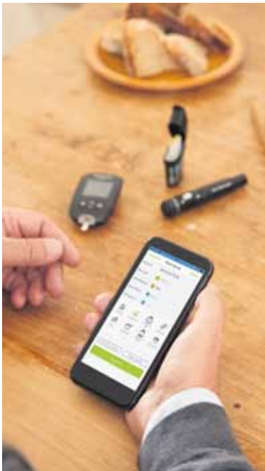
Jeder gemessene Blutzuckerwert wird vom Messgerät automatisch per Bluetooth in die App übertragen.

Diabetestagebuch: Messgerät plus App geben Betroffenen deutlich mehr Sicherheit