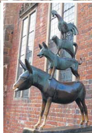
Die Statue der Bremer Stadtmusikanten gilt heute als Wahrzeichen von Bremen.

Unabhängig von seiner beeindruckenden Geschichte und den vielen Highlights für Besucher weiß Bremen auch durch sein vielfältiges Bildungsangebot zu gefallen: Insgesamt neun Universitäten und Hochschulen prägen den Hochschulstandort. An vier staatlichen und fünf privaten Lehrinstituten profitieren Studierende von zahlreichen Bildungsmöglichkeiten. Die große An-