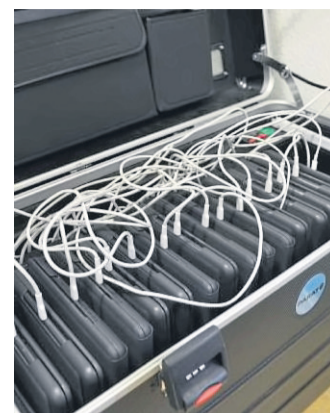
Tablet-PCs beim Aufladen im Koffer.