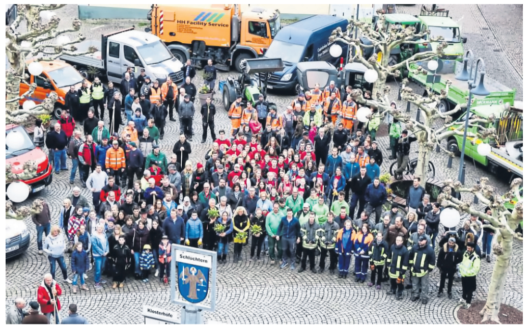
Nach zweijähriger coronabedingter Pause erfährt die Aktion „We kehrt for Schlüchtern“ am 2. April eine Neuauflage.