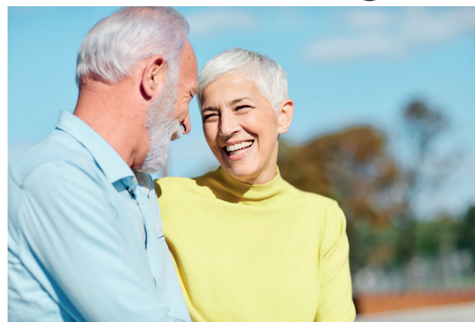
Auch in späteren Lebensjahren noch vital, kraftvoll und leistungsfähig? Eine ärztlich verabreichte B-Vitaminkur kann dazu beitragen.

(WLM) Viele Menschen gerade ab dem sechsten Lebensjahrzehnt fühlen sich müde, abgespannt, erschöpft und niedergeschlagen. Verbreitet liegt diesen Symptomen ein Mangel an B-Vitamin zu Grunde, der sich vielfach durch eine ärztlich verabreichte Aufbaukur mit B6, B12 und Folsäure in kurzer Zeit beheben lässt. Unter dem Begriff „Erschöpfungssyndrom“ fassen Mediziner Symptome zusammen wie andauernde Mutlosigkeit, das Gefühl, einfach keine Kraft mehr zu haben, ständig müde zu sein, nicht ausreichend schlafen zu können bis hin zu depressiven Phasen. Im Extremfall verliert der Körper sogar die Fähigkeit, sich wieder zu regenerieren, also aus eigener Kraft zur früheren Lebensqualität zurück zu finden. Häufig ist in diesem