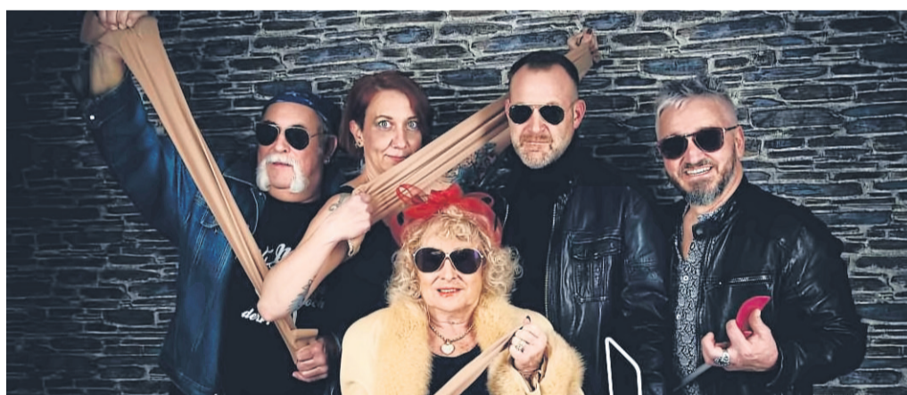
„Hot, hotter, Kompressionsstrümpfe!“ Das verspricht Footopia in Steinau.