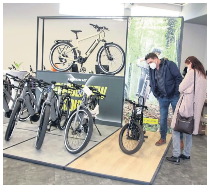
Viele Besucher informierten sich am Eröffnungswochenende über die neuen Bike-Trends, die bei VeloCulTour in der Grabenstraße erhältlich sind.

MOTTGERS – Die Jahreshauptversammlung des Kaninchenzuchtvereins Mottgers findet am Samstag, 19. März, um 20 Uhr statt. BWB