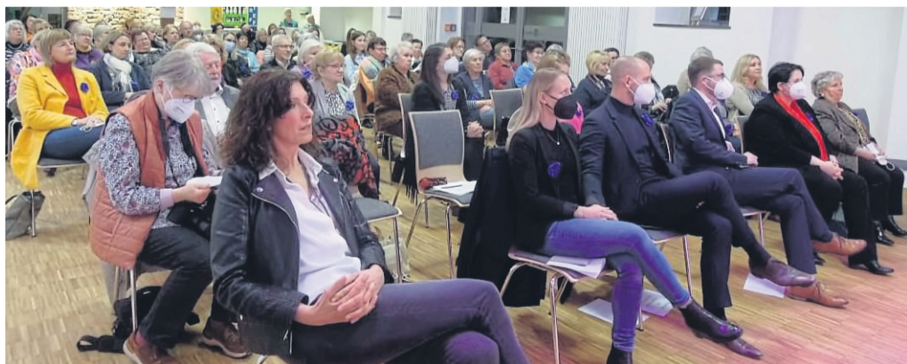
Groß war die Resonanz auf die Veranstaltung zum Weltfrauentag im Generationentreff Salmünster.