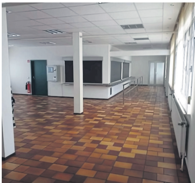
Neue Probenräume konnte der Männerchor Frohsinn Bad Soden in der Sprudelallee 19 anmieten.