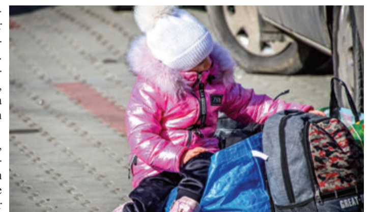
Der Landkreis erwartet mehr Flüchtlinge.

Ergänzend hierzu erwartete der Landkreis Ende dieser Woche nun