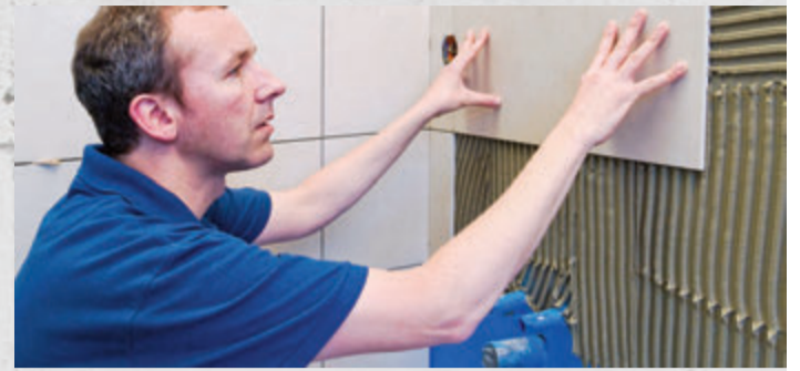
Fliese für Fliese die Wand neu gestalten: Auch Anfänger können sich mit den passenden Hilfsmitteln an diese Aufgabe herantrauen.

Mit ihrer optischen Vielfalt, der einfachen Pflege und der Robustheit sind Fliesen ein zeitloser Klassiker für das Zuhause. Ob als Bodenbelag oder an der Wand: Mit neuen Keramikplatten erhält jeder Raum zügig ein frisches Erscheinungsbild. Und das ist heutzutage einfacher, als manche meinen. Selbst unerfahrene Heimwerker können sich ohne Bedenken an das Verfliesen eines Bodens oder einer Wand herantrauen. Die ersten Schritte zu überzeugenden Resultaten sind eine gute Planung sowie die gründliche Vorbereitung des vorhandenen Untergrunds.