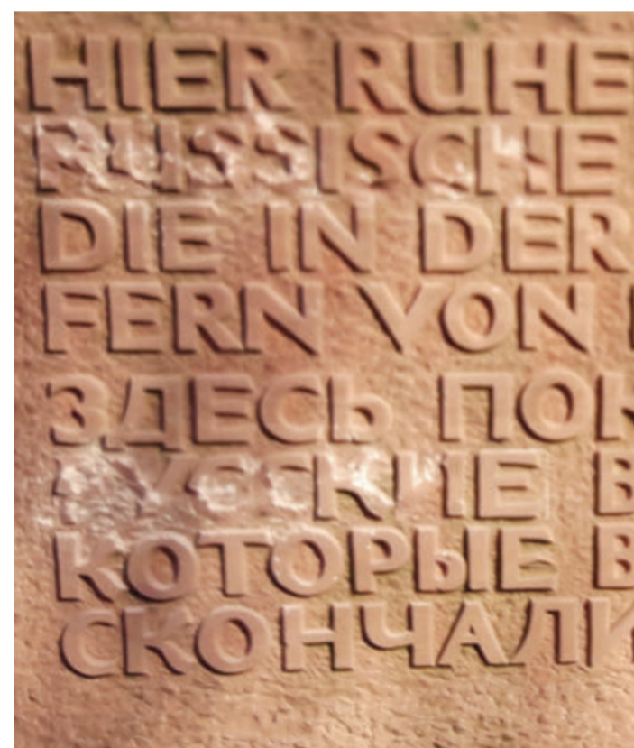
Der beschädigte Gedenkstein.