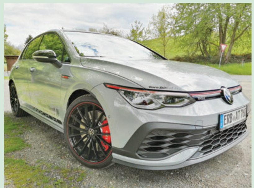
Der GTI Clubsport verfügt unter anderem über 19 Zoll-Räder und kräftig zapackende Bremsen.

Hier erhalten Sie auch weitere Informationen. Treffpunkt Thierolf, Hammerweg 29, 64720 Michelstadt. Tel. 06061/7090 und www.thierolf.de