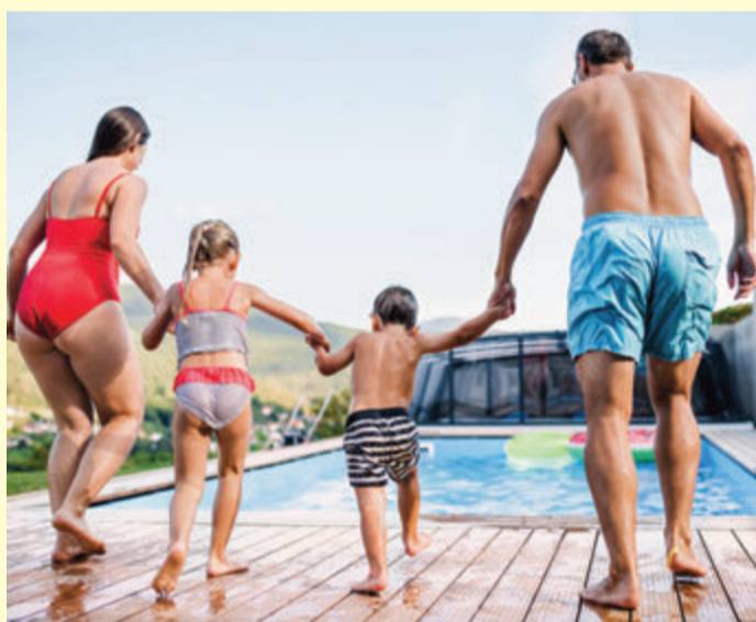
Wer sich im Sommer 2022 ins kühle Nass stürzen will, sollte den Pool ohne Zeitdruck rechtzeitig planen.

Wer ganz sichergehen will, im Sommer 2022 im eigenen Pool planschen zu können, sollte ihn in den kommenden Herbst- und Wintermonaten planen. Im Frühling, wenn die Temperaturen langsam steigen, kann es sonst zu längeren Wartezeiten kommen, weil die Auftragsbücher der Hersteller dann wieder sehr gut gefüllt sein werden. Nach einer Schwimmbadplanung ohne Zeitdruck und dem Ausheben der Baugrube wird das Becken pünktlich zur warmen Jahreszeit angeliefert und eingesetzt. Hier sind die wichtigsten Punkte, die man dazu wissen sollte: