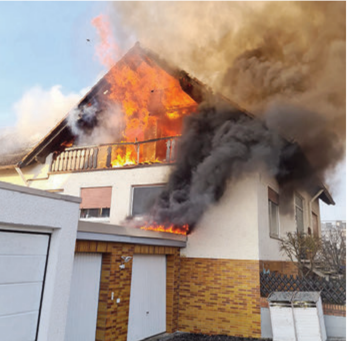
Das Dachgeschoss brannte komplett aus.