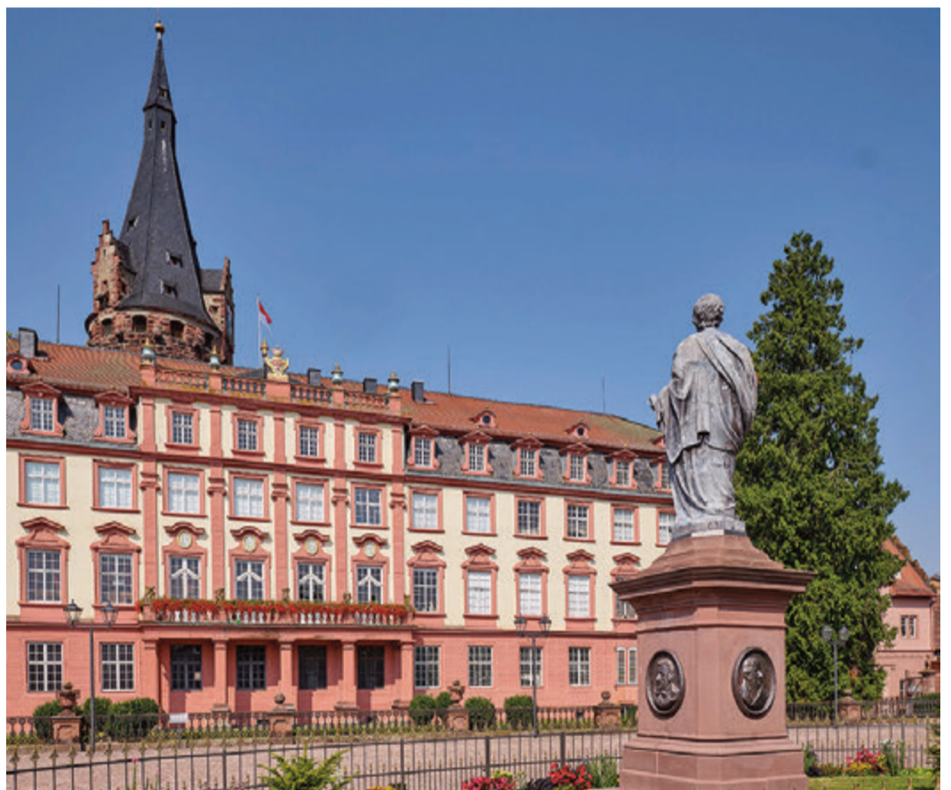
Das Schloss Erbach im Odenwald.