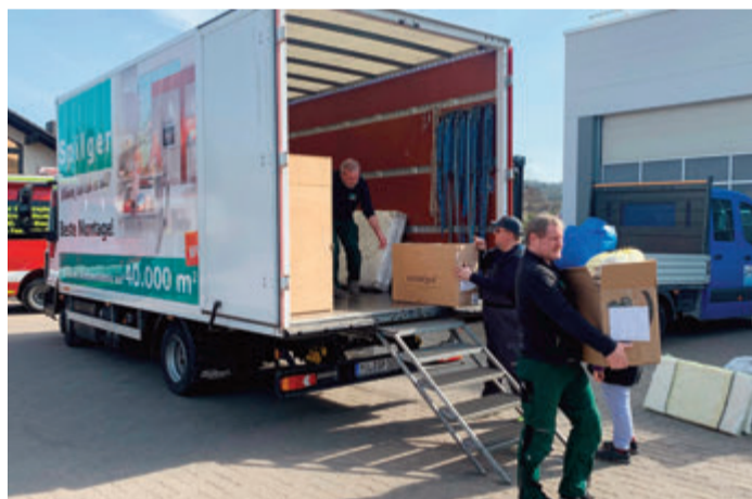
Auch das Wohn-Center Spilger packte mit an.

Vor Ort am Bauhof Obernburg wurden die Sachspenden ausgeladen, vorsortiert und anschließend eingelagert. Insgesamt wurden im Landkreis Miltenberg rund 400 Paletten mit Sachspenden zusammengetragen. red