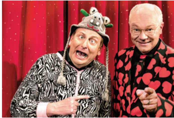
Ein eingespieltes TeamTeam auf der Bühne.

Höchst. Nach über dreieinhalb gemeinsamen Jahrzehnten von Volker Heißmann und Martin Rassau ist die Zeit endlich reif für ein Programm, wie es noch keines zuvor gab: „Wenn der Vorhang zwei Mal fällt“ ist eine furiose Zwei-Mann-Show über die Bretter, die nicht nur für Heißmann & Rassau die Welt bedeuten – und zwar ganz egal, ob sich diese Bretter nun in der Olympiahalle München, dem Ohnsorgtheater Hamburg, der Stadthalle Wien oder aber im Gemeindesaal von Strullendorf befinden.