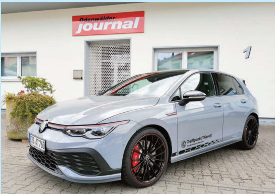
Eine sportlich-aggressive Optik zeichnet den GTI Clubsport aus.