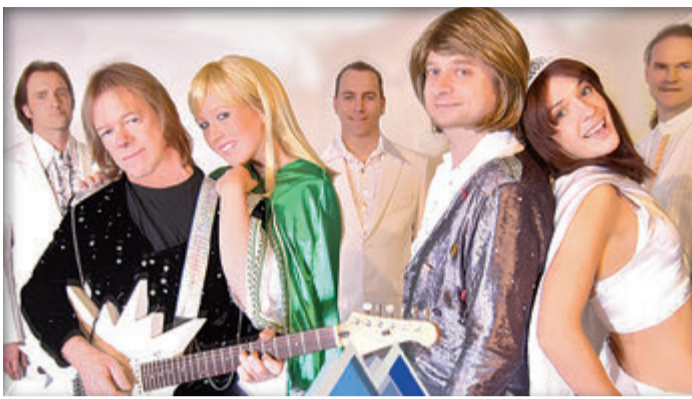
Das Kulturforum Odenwald präsentiert am 14. Mai die große ABBA-Nacht im Volksbank Atrium in Erbach.

von Veranstaltungen kann sehr zeitintensiv sein; Zeit, die sich die Gründer, die alle über umfangreiches Wissen und vielfältige Erfahrung in der Veranstaltungsbranche aus verschiedenen Blickwinkeln verfügen, sehr gerne nehmen.