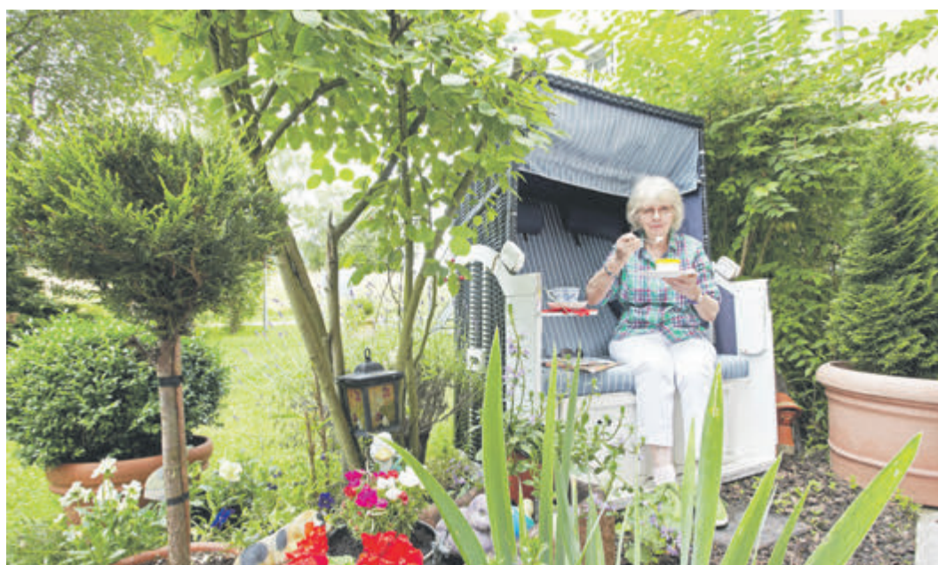
Eine Kaffeepause im Garten ist auch möglich.

Zu Ihrer Erleichterung stehen viele Service- und Dienstleistungen zur Verfügung. Jeder Bewohner wählt selbst aus, ob, wie oft oder wie lange er z. B. Verpflegung oder Wohnungsreinigung, in Anspruch nehmen möchte. Es gibt so viele Möglichkeiten, einen unbeschwerteren Ruhestand in Bad König zu realisieren. Leben Sie in der Residenz „Am Kurpark“ Ihren Traum! red