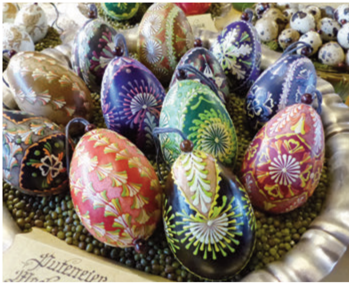
Eier in allen Variationen.

Die Zeit erfordert es aber, dass sowohl für Aussteller wie auch für Besucher Markenpflicht besteht. Beim diesjährigen Markt präsentieren wieder verschiedene Aussteller Ostereier, bemalt mit den verschiedensten Techniken. So findet durch österliche Handarbeiten, Oster- und Kinderbü-