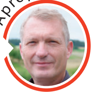
von Volker Zaborowski, Chefredakteur