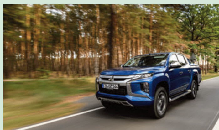
Kraftvoll und sportlich.

Gekleidet in die markentypische „Dynamic Shield“-Designsprache, ist der L200 unverändert in zwei Kabinenvarianten erhältlich: als 2+2-sitzige Club Cab mit gegenläufig öffnenden Türen und als Version mit viertüriger, fünfsitziger Doppelkabine. Die Ladefläche misst 1,85 bzw. 1,52 Meter. Mit seiner hohen Zuladung und bis zu 3,1 Tonnen Anhängelast schafft der Pick-up einiges weg. Spür- und sichtbare Qualitätsverbesserungen im Innenraum, aber auch der erhöhte Fahrkomfort machen Fahrten noch angenehmer – sowohl im beruflichen als auch im privaten Alltag.