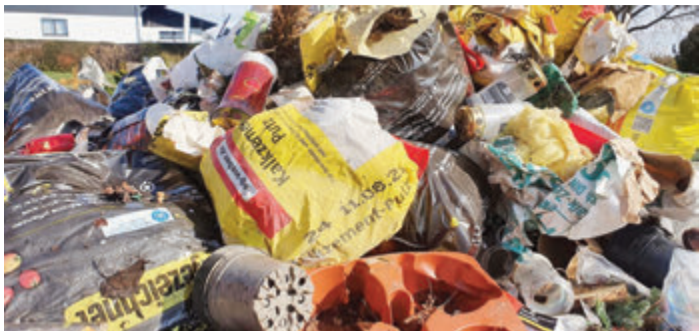
Illegal abgeladener Müll in Friedhofskörben.

Reinheim/Georgenhausen. Eine sehr ärgerliche Überraschung erlebten die Mitarbeiter des Bauhofes, als sie in diesen Tagen die für den Friedhofsabfall vorgesehenen großen Körbe auf dem alten Friedhof in Georgenhausen leeren wollten. Denn nur ein kleiner Teil des entsorgten Abfalls waren wirklich Dinge, die auf einem Friedhof an Abfall anfallen. Alles andere war Hausmüll, sogar Zementsäcke waren dabei.