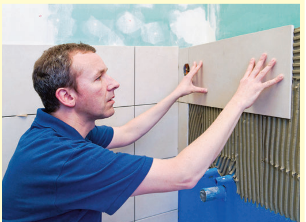
Fliese für Fliese die Wand neu gestalten: Auch Anfänger können sich mit den passenden Hilfsmitteln an diese Aufgabe herantrauen.