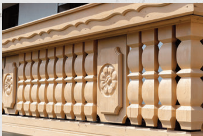
Gesäubert, renoviert und gleichmäßig aufgehellt erstrahlt der Holzbalkon wieder in neuem Glanz.

Mit frischen Farben und milden Holzschutzmitteln, das mit einem Pinsel auf die sanierungsbedürftige Fläche aufgetragen wird. Unter www.adler-farbenmeister.com gibt es hilfreiche Tipps für Heimwerker, worauf man bei der Renovierung der jeweiligen Holzarten unbedingt achten sollte.