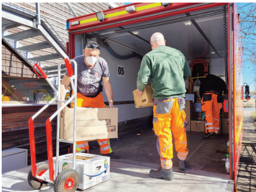
Aktion an der Sammelstelle Erzhausen.

Groß-Zimmern unterstützt Verein „Vergiss-mein-nicht“