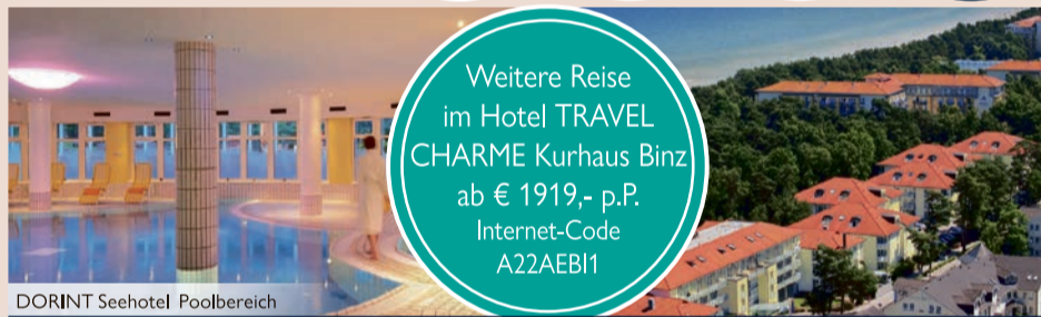
DORINT Seehotel Poolbereich

Weitere Reise im Hotel TRAVEL CHARME Kurhaus Binz ab € 1919,- p.P. Internet-Code A22AEB11