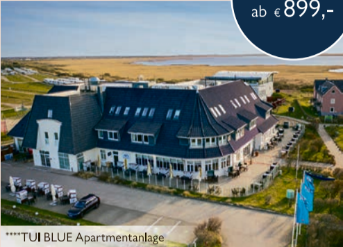
****TUI BLUE Apartmentanlage