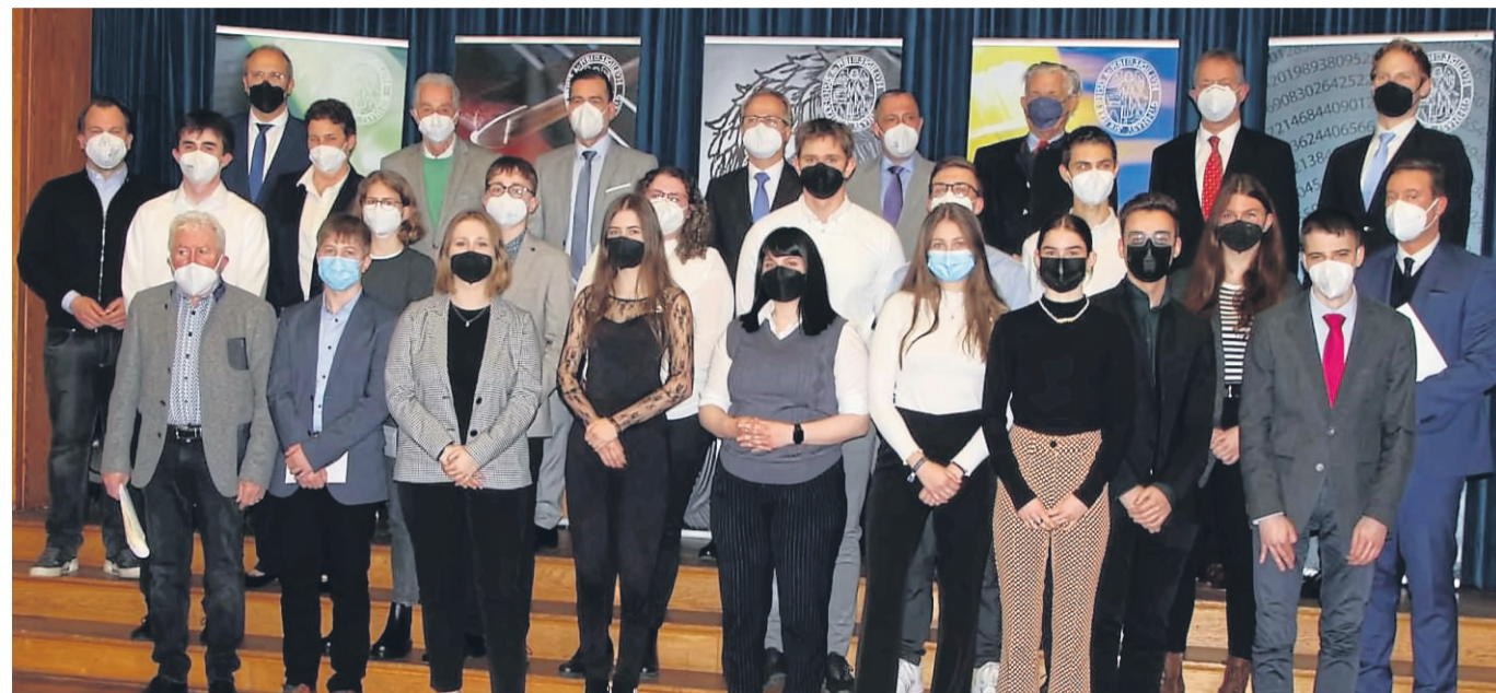
17 Stipendiaten wurden vergangenen Samstag für besondere Leistungen ausgezeichnet. Stiftungsrepräsentanten, Schulleitung und Vertreter der Kommunen gratulierten den Schülerinnen und Schülern.