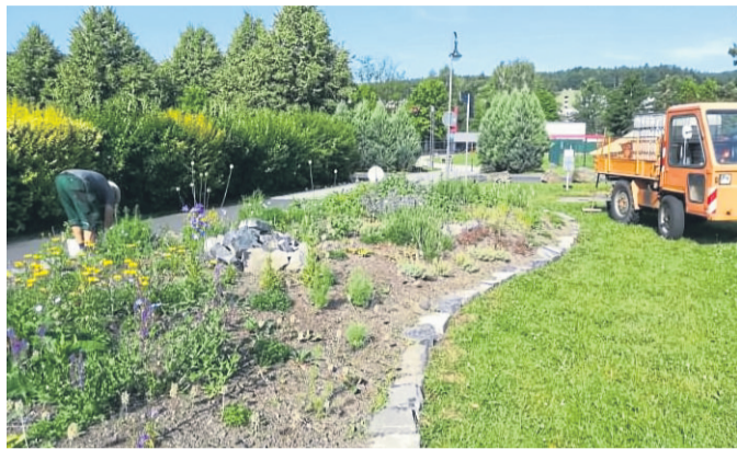
Artenreicher Lebensraum auf kommunaler Fläche.